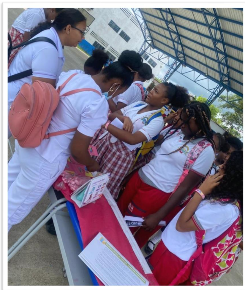
Stands derechos y deberes sexuales y reproductivos.