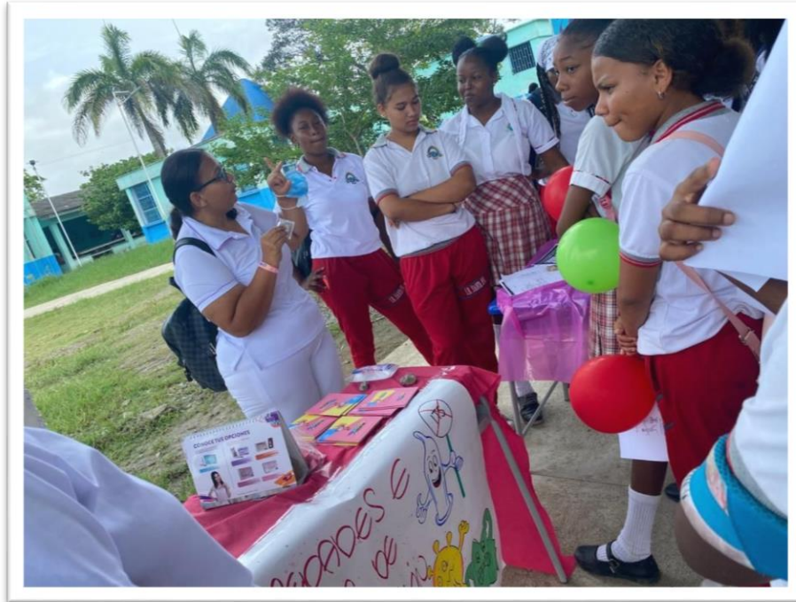
Stand Socialización de enfermedades e Infecciones de transmisión sexual.