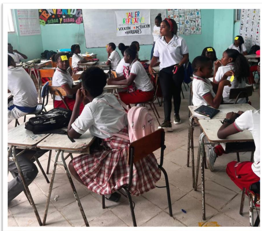
Desarrollo de encuentro grupal "La ruta de mi futuro - idealizando profesiones"

Luego de ello se realiza el abordaje de las temáticas propuestas para cada encuentro y se culmina con la plenaria y evaluación del taller, esta última es propuesta como un estrategia de mejora, se logró con ella que los participantes evaluaran de manera consiente el proceso llevado a cabo, realizando aportes de mejoras y comentarios con respecto a lo asertivo que ha sido o no el encuentro desarrollado bajo la dirección las promotoras del proyecto.