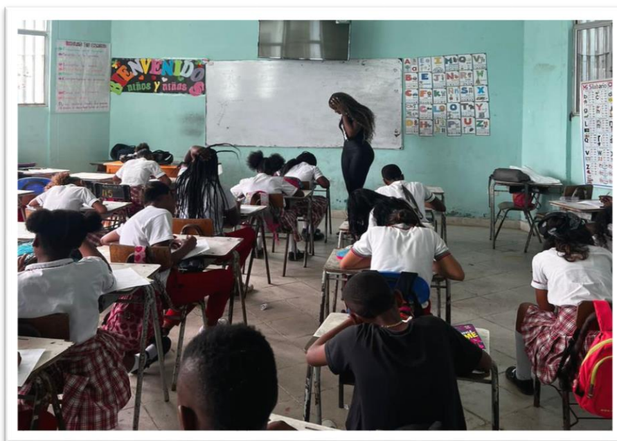
Encuentro y desarrollo de Taller reflexivo individual "Mi vida y yo".

Como talleres individuales se proponen dos respectivamente, "Mi vida y yo" y el "árbol de sueños: ¿qué me interesa? ¿En que soy brillante?" ambos ejecutados bajo el objetivo de Fomentar la construcción de un proyecto de vida para prevenir embarazos no deseados en población adolescente del Distrito de Turbo, bajo la metodología de talleres individuales reflexivos.