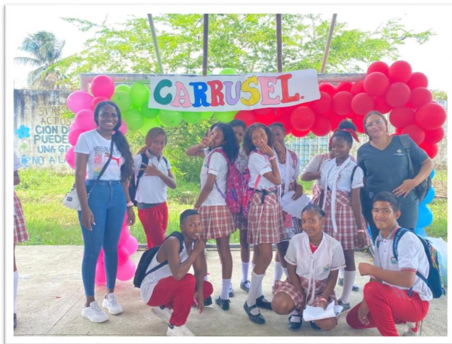
Carrusel informativo: Métodos anticonceptivos, proyecto de vida, derechos y deberes sexuales y pre productivos.

de ellos; además dándoles herramientas para saber cómo acceder a los mismos, se vuelve un espacio bastante significativo ya que se les da la posibilidad a algunos de esos jóvenes incluso de acceder a iniciar su proceso de planificación familiar, sin desconocer el papel fundamental que juega claramente la familia en estos procesos, pero dándole también a los adolescente un rol protagónico en la toma de decisiones sobre su cuerpo, su futuro y su proyecto de vida