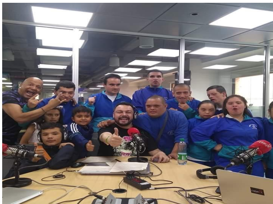
7 Visita a Caracol Radio 2

También cabe recalcar que, dentro de las transmisiones se llevaron a cabo dos temporadas del programa cultural 'Todos Somos Soacha', una fue la estructura que se ejecutó dentro de