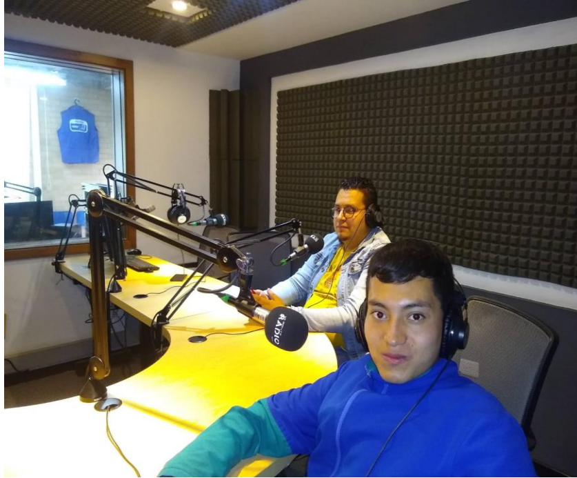
Visita Caracol Radio