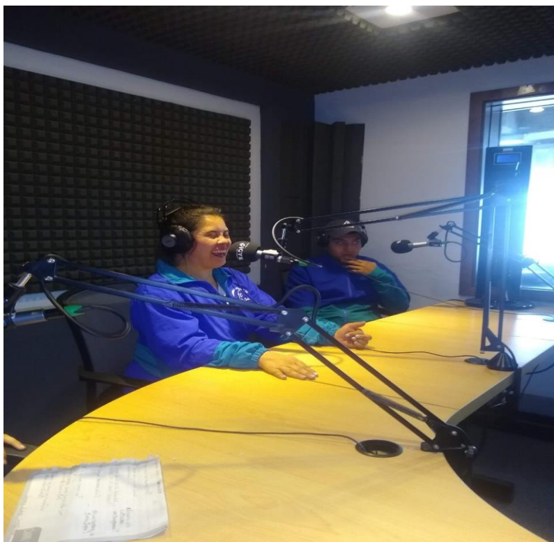
8 'Todos Somos Soacha' Uniminuto1

Al iniciar este proceso, se presentaron dificultades, teniendo en cuenta que los participantes se mostraron tímidos y sus intervenciones fueron muy poco notorias, sin embargo, en el transcurso del desarrollo la apropiación de los temas y la participación fue mucho más activa, ya con un desarrollo óptimo de los temas y así mismo del planteamiento de preguntas hacía los invitados.