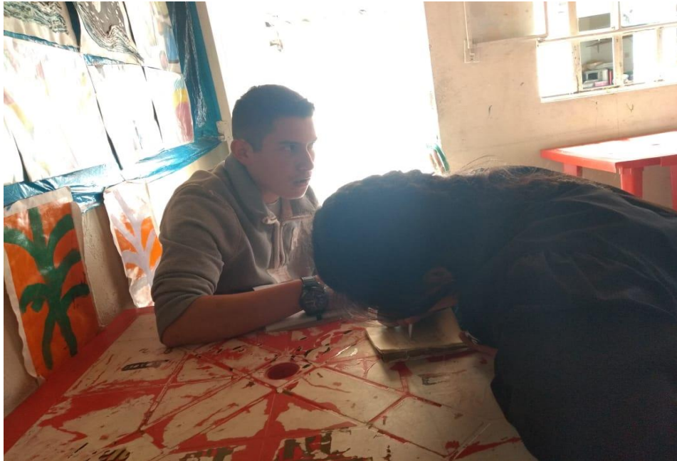
Realización del primer programa realizado en la emisora Soacha Iniciativa Ciudadana