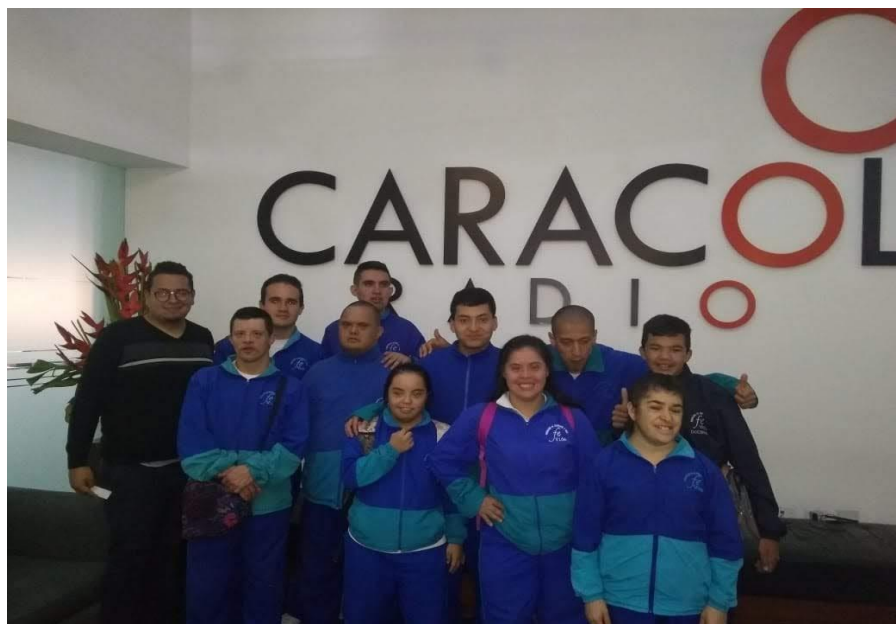
6 Visita a Caracol Radio 1