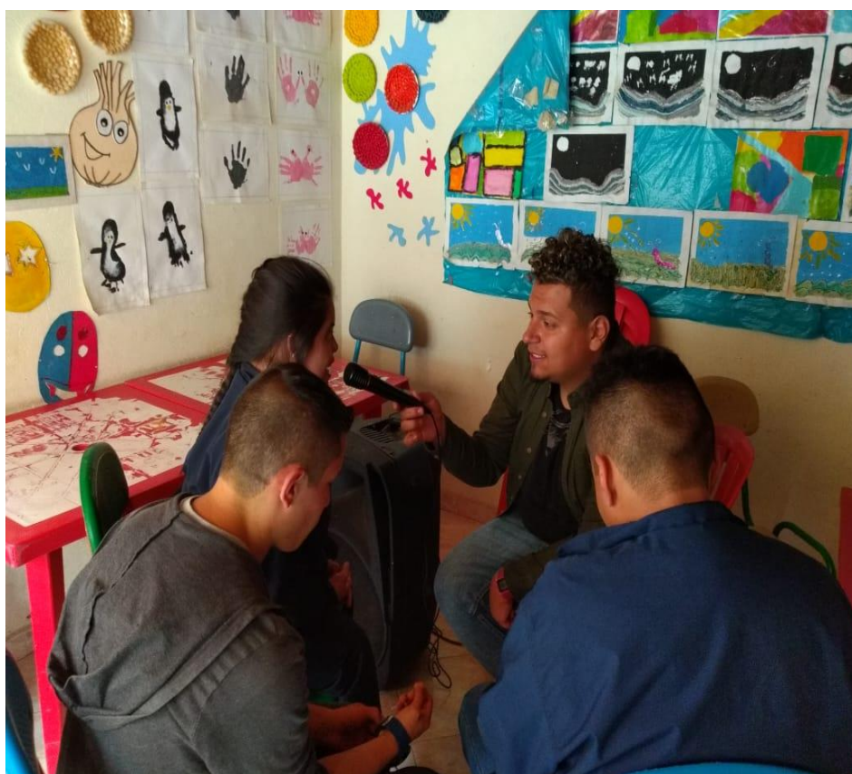
5 Ejercicios de simulacro con micrófono 2