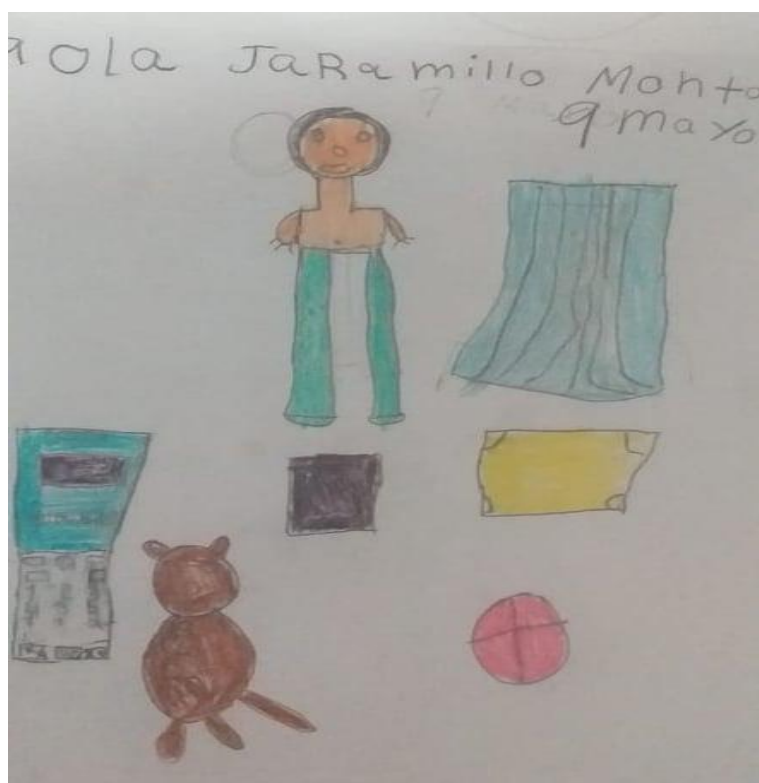
2 Dibujo alusivo a los gustos: Paola Jaramillo