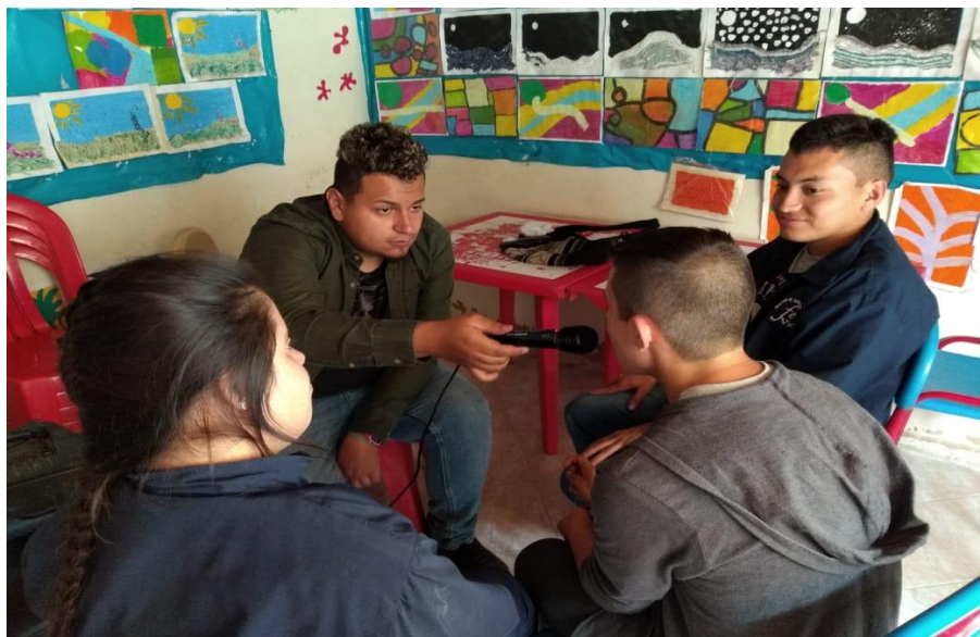
4 Ejercicios de simulacro con micrófono 1