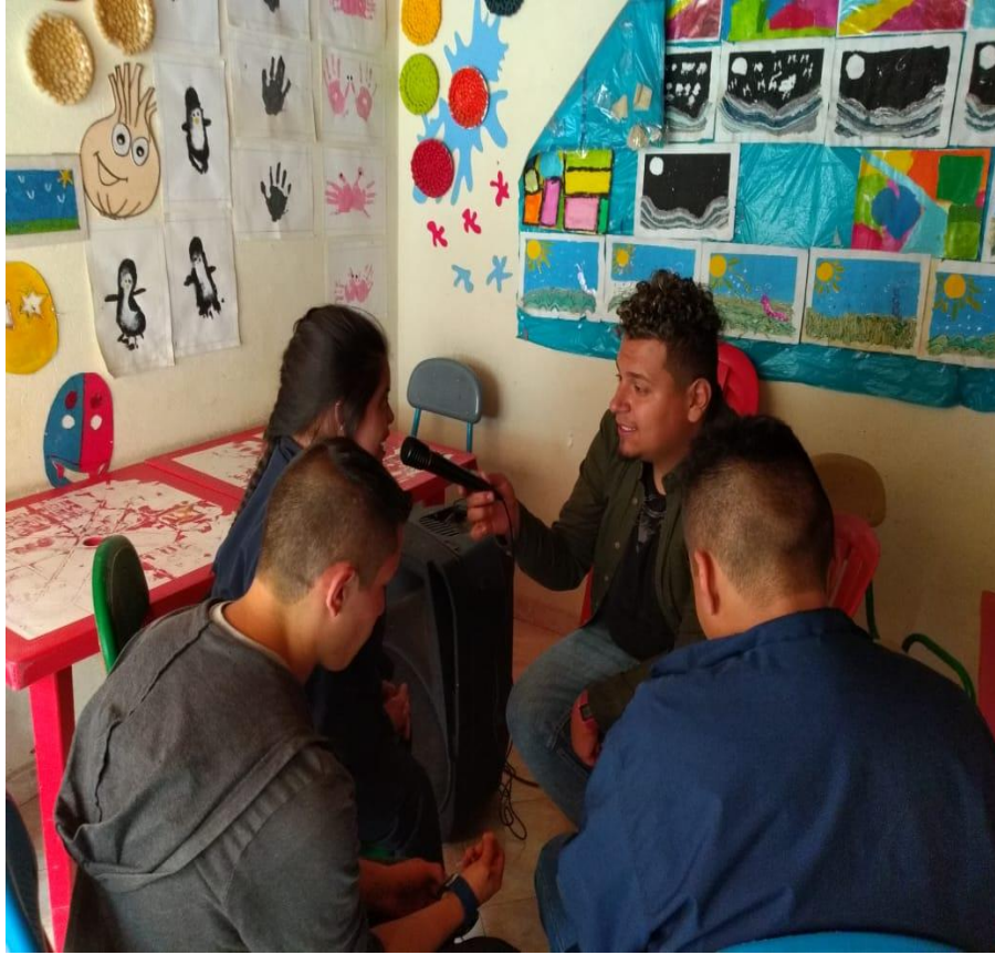
Actividades escritas y planeación del programa