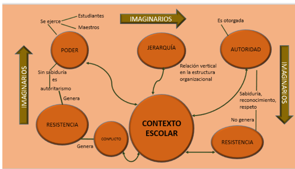
Figura 1. Mapa de relaciones de las categorías propuestas.