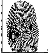
Huella dactilar física

CC Nº 1.022.956.405 SANDRA LILIANA VARGAS VELASCO