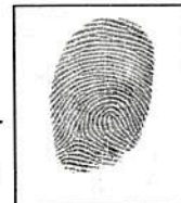
Huella dactilar física