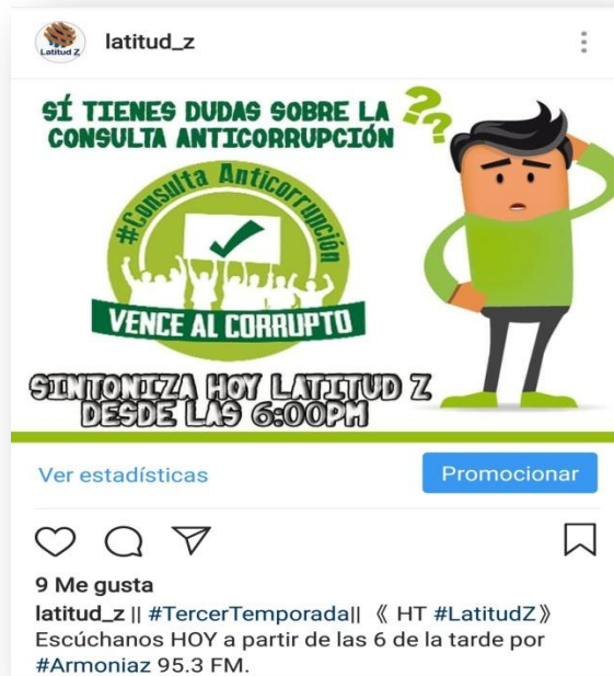
Infografía Especial Consulta AntiCorrupción (Anexo 4)

LatitudZ 2018. Recuperado Instagram @latitud_z