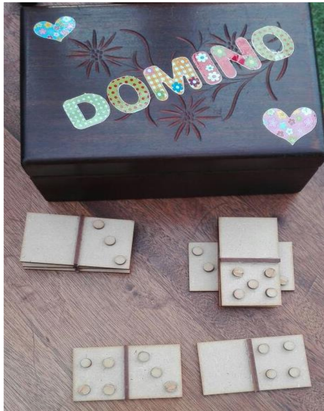
Figura No 1. Domino, juego estratégico para la población con discapacidad visual

Cuando dos personas con discapacidad visual estén jugando siempre tendrá un profesor o alumno presente supervisando las normas de juego.