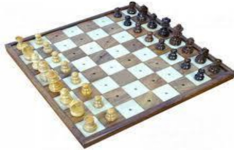
Figura No 2. Ajedrez, juego estratégico para la población con discapacidad visual