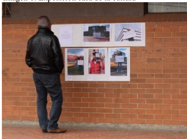
Imagen 6: Exposición casa de la cultura

propias de la labor. Se alude a las transformaciones que debe asumir el profesional en el posconflicto, punto que es pertinente robustecer y reflexionar constantemente, invitando al periodista a repensarse y asumirse en el país también como un constructor de paz.