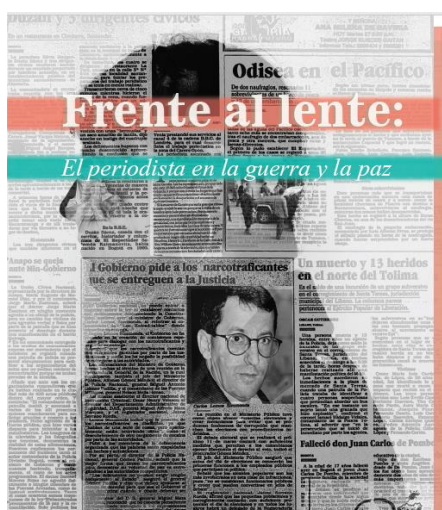
Imagen 4: Portada revista

Complementando el trabajo fotográfico realizado, se realiza la revista “Frente al lente, el periodista en la guerra y la paz”, desde la cual se fortalecen los objetivos planteados y se evidencia parte del proceso realizado. Como contenido de esta se encuentra un artículo periodístico por cada parte del tríptico, los cuales se construyeron usando como fuentes o argumentos, partes de las entrevistas realizadas.