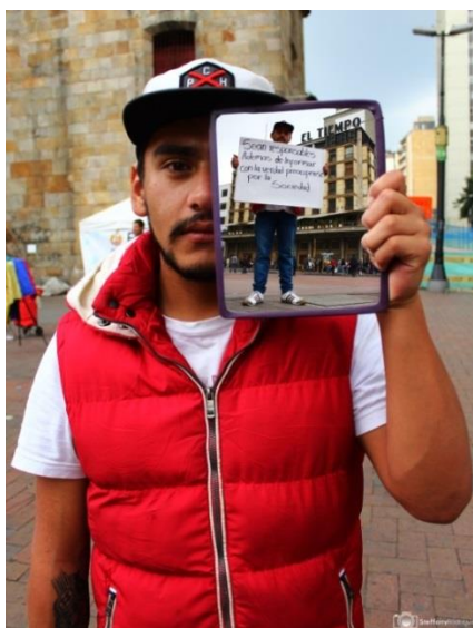
Imagen 3: Tercera parte del tríptico

Esta tercera parte es diseñada con el fin de destacar las expectativas que tienen las audiencias del periodismo colombiano en el posconflicto; con el ánimo de que sean fotografías atractivas se experimenta con planos, montajes y tiempo de obturación. Este es un ejercicio que responde mucho más a la fotografía de ensayo, vertiente del fotoperiodismo, donde la intención del fotógrafo es evidente, manifestar las opiniones de las audiencias sobre el periodismo en el posconflicto.