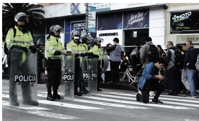
Imagen 2: Segunda parte del tríptico

Esta segunda parte del tríptico busca capturar al periodista en un estado “natural”, sin alterar el comportamiento que tiene al ejercer, destacándose como un ejercicio de reportería gráfica. En un inicio se buscaba realizar el acompañamiento a un periodista, pero con el fin de obtener mayores nociones del accionar, se acude a eventos masivos que permitieron destacar distintos perfiles profesionales.