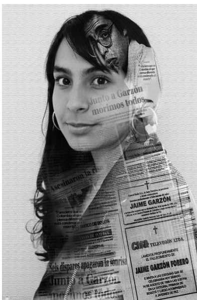
Imagen 1: Primera parte del tríptico

El diseño de esta primera parte del tríptico se basa en la técnica de doble exposición, un ejercicio que resulta interesante y atractivo para los espectadores; además que permite transmitir un mensaje en la fotografía, aludiendo a la memoria en el periodismo y el pasado que ahora recae en los periodistas. Previamente se realizaron fotografías de prueba y se experimentó con la técnica, con el fin de pulir el ejercicio, optimizar los resultados y el tiempo de ejecución del mismo.