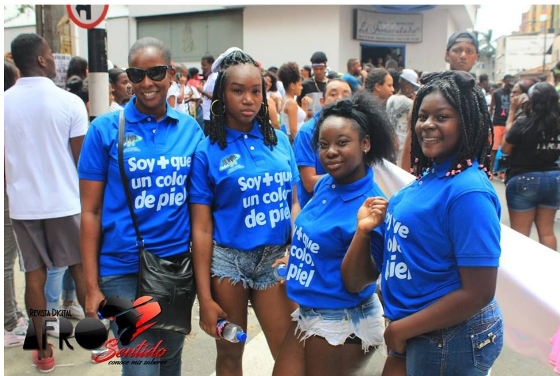
[Fotografía de Edwin Rengifo]. (Medellín. 2017). Archivo fotográfico de la Revista digital AfroSentido San Pachito 2017, Medellín, Antioquia.

El Caché, es el distintivo que cada grupo de amigos o familiares realiza con una frase que los identifique en el momento. En algunas ocasiones, el caché tiene un mensaje sin sentido, sacado de alguna canción de chirimía o del exótico chocono (canciones que fusionan ritmos urbanos, con música del pacífico). Otros buscan llevar un mensajes de resignificación de la identidad afrocolombiana, pero también se pueden encontrar unos con colores y figuras llamativas.