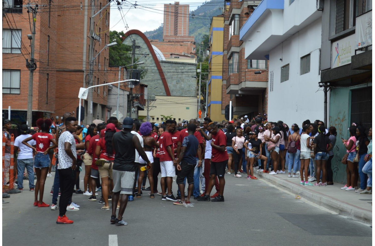
(Medellín. 2017). San Pachito 2017, Medellín, Antioquia.

El revúlu es el momento más alegre del desfile, es el que une a todos los asistentes como familia, porque el sonido de la chirimía causa en todos una especie de corrientazo que los lleva a expresarse con el cuerpo a través de movimientos improvisados, alzando las manos, aplaudiendo; en pocas palabras, causa una alegría en el corazón de todos los asistentes.