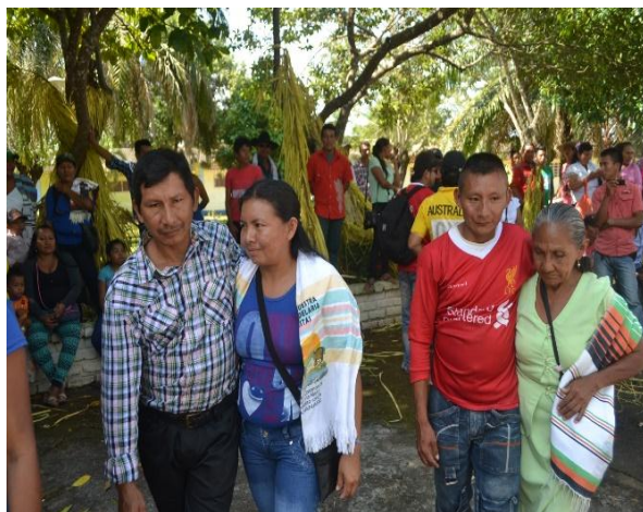
Comunidad Indígena