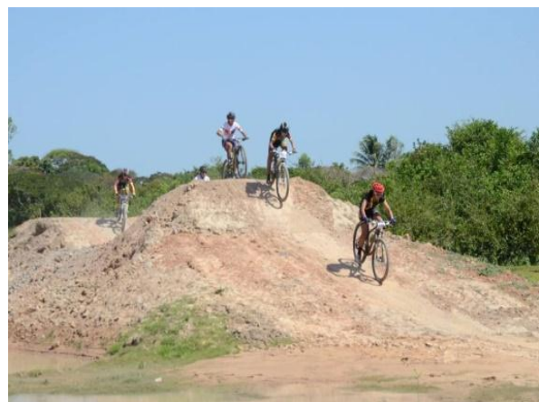
Caño San Miguel en verano