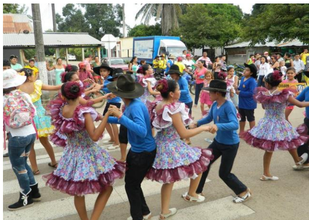
Orojoropo por las calles del Municipio