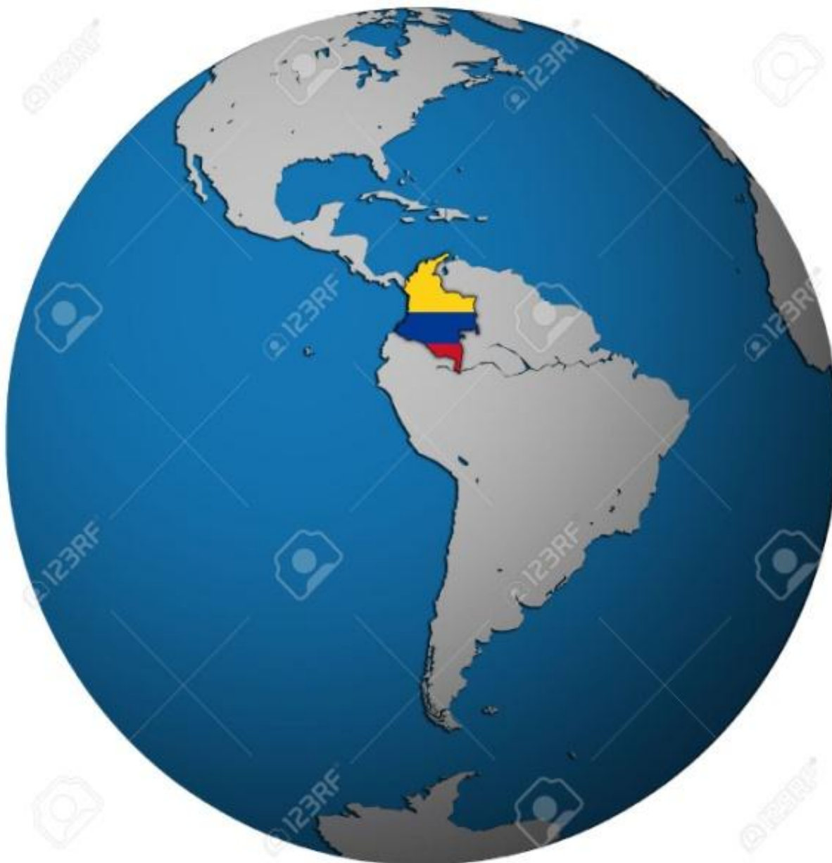
Figura 1 Mapa de Macrolocalización Colombia en el Mundo