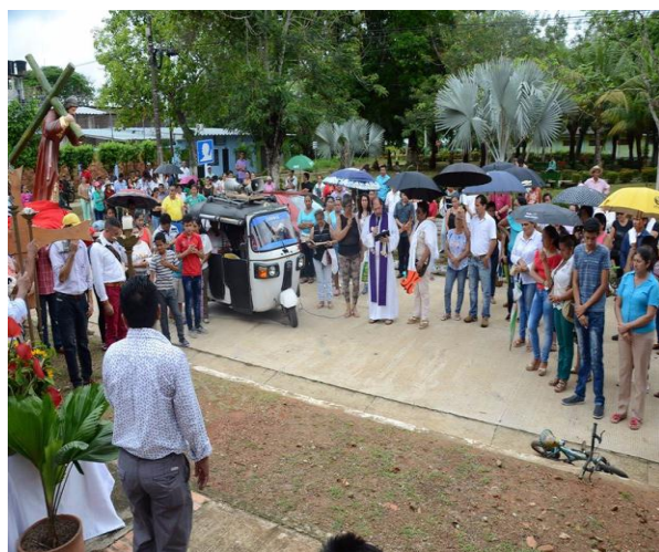
Celebración Santo Viacrucis