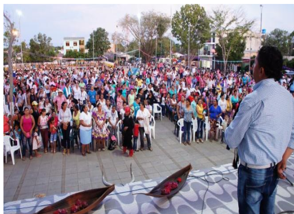
Celebración Familias Orocueseñas – Plazoleta