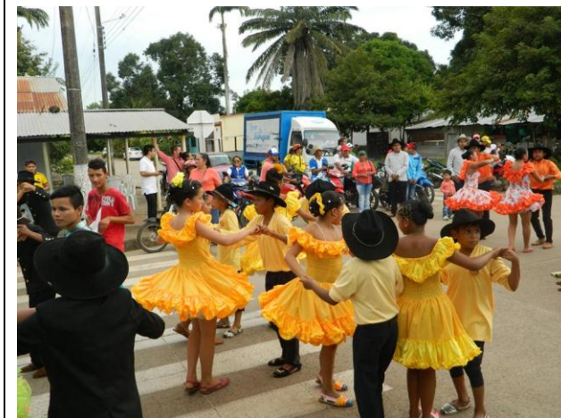
Orojoropo por las calles del Municipio