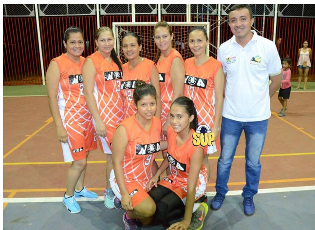
Copa concejo Municipal Baloncesto Femenino