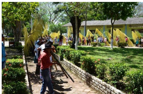
Danza del Botuto, indígenas sálibas