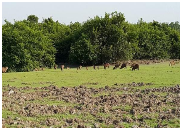
Vista chigueros – Laguna Paravare