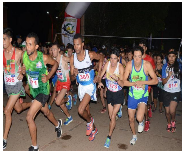
Carrera atlética del Turismo