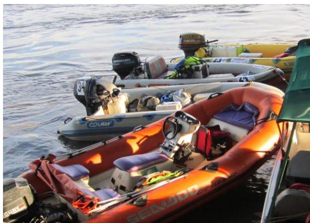
Deporte Náutico en el Río Meta.