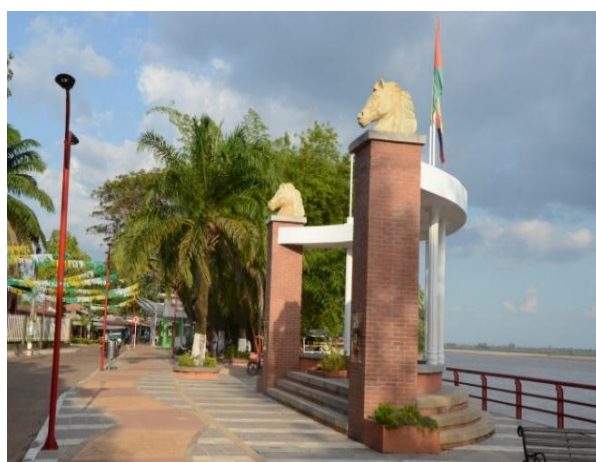
Malecon Sobre el Rio Meta – Orocué