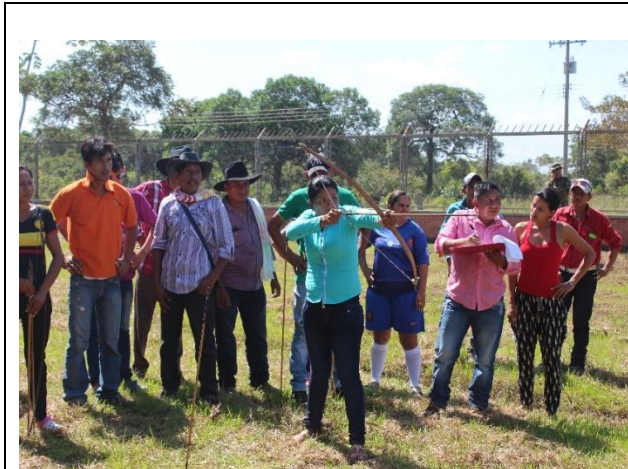
Concurso arco y flecha