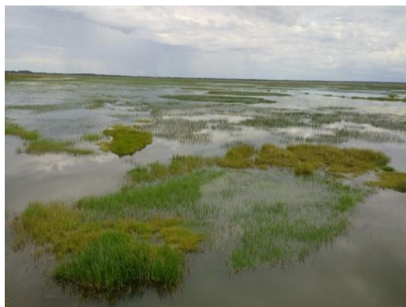
Paisaje en Wisirare