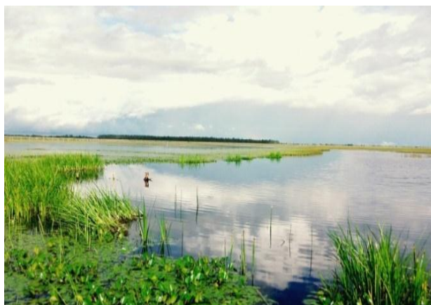
Reserva Natural las Malvinas en invierno