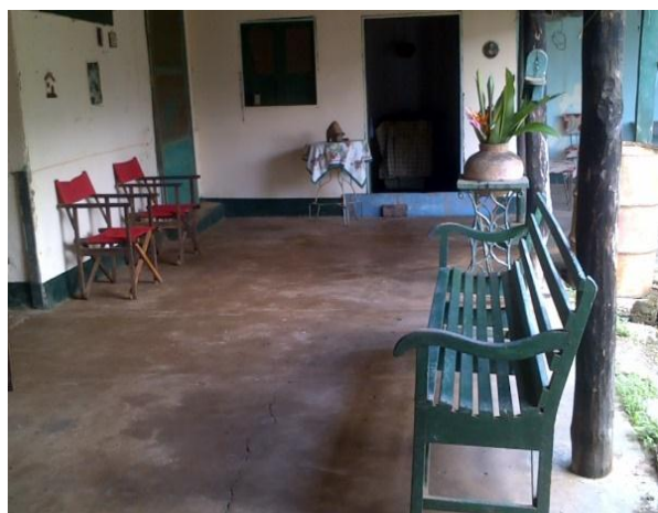
Parte interna Casa Museo Vorágine