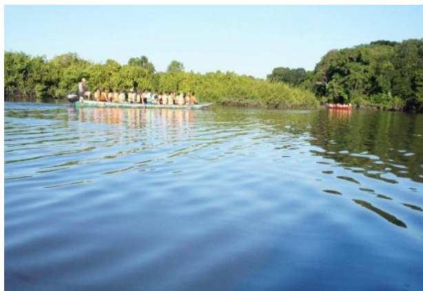
Caño San Miguel en Invierno