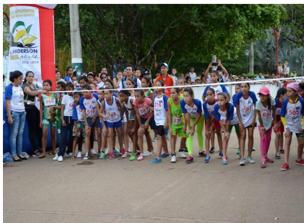
Carrera atlética del Turismo