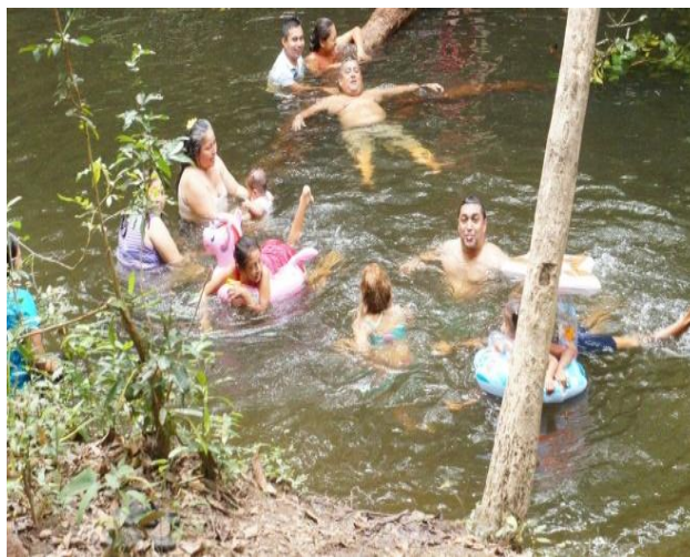
Balneario natural La Argentina