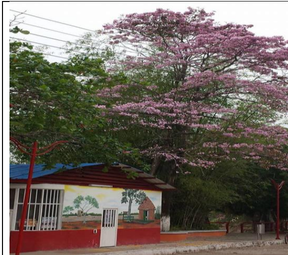
Flor Morado sobre el Malecon Rio Meta