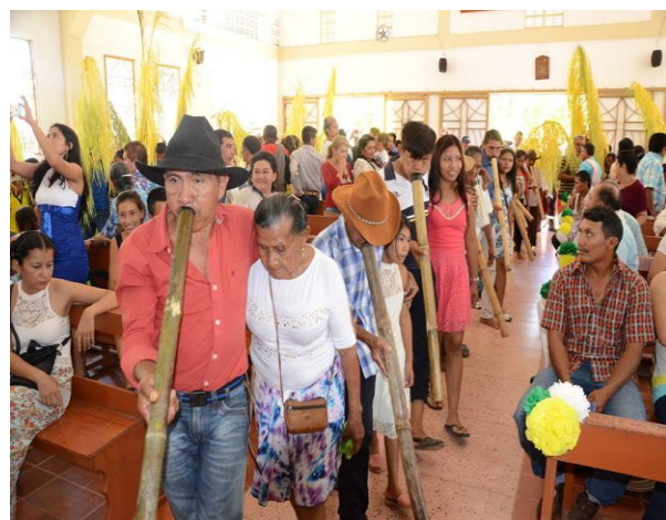
Entrada de los indígenas a la Iglesia- baile del Botuto