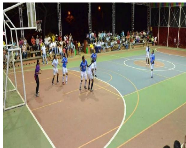
Copa concejo Municipal Microfútbol Femenino