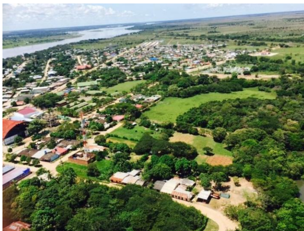
Panorámica de Orocué