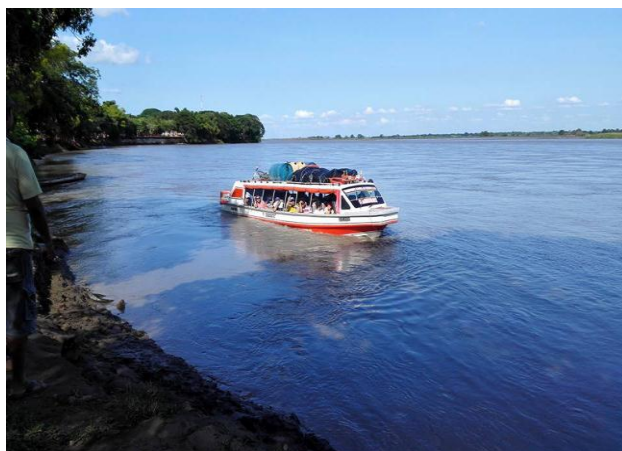
Transporte de Pasajeros en yate – Río Meta