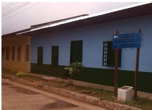
Vista externa Casa Museo VoráGINE