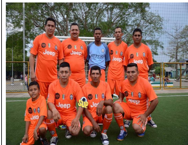
Campeonato Senior Master