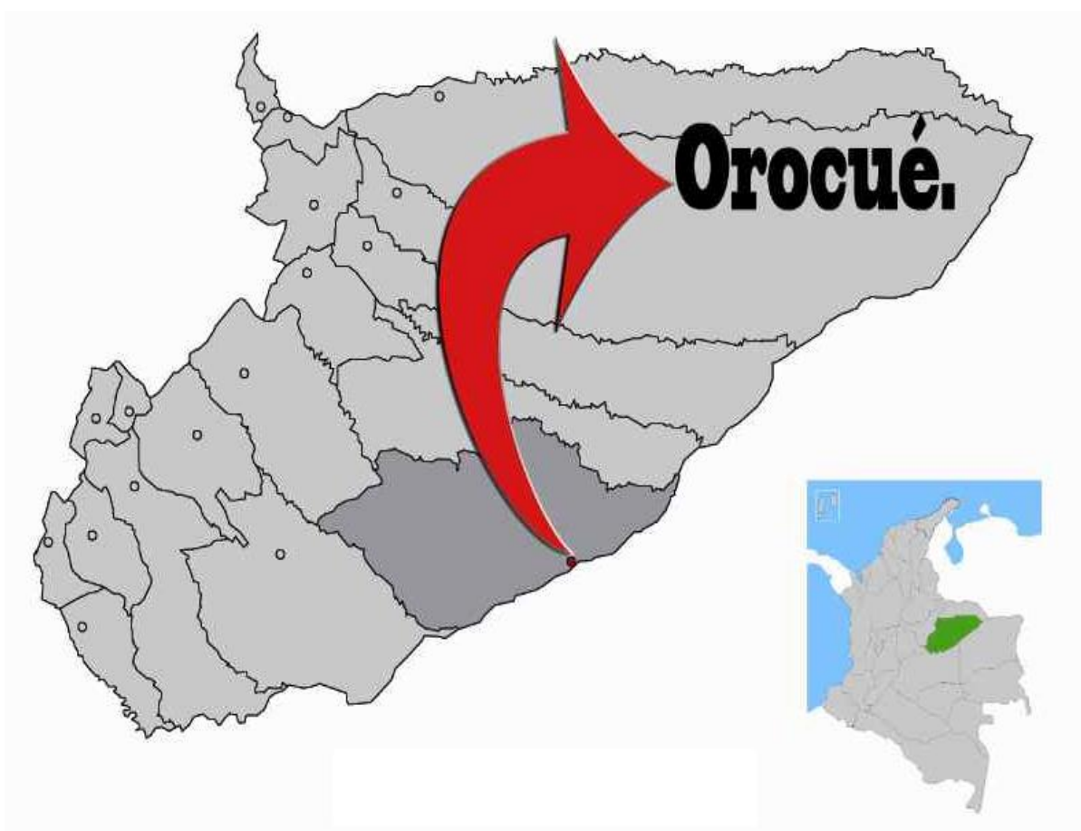
Figura 2. Microlocalización del municipio de Orocué en el Departamento

“El Departamento del Casanare está situado en el oriente del país en la región de la Orinoquía, tiene una superficie de 44.640 km 2 , limita por el oriente con el Departamento del Vichada, por el occidente con el Departamento de Boyacá, por el norte con el Departamento de Arauca, y por el sur con el departamento del Meta. Fue creado en el año 1991, cuenta con una población de 325.389 habitantes según DANE 2005”. (Martinez, 2015, pág. 1)