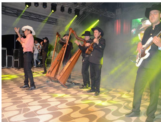
Artistas Ferias y Fiestas virgen de la candelaria