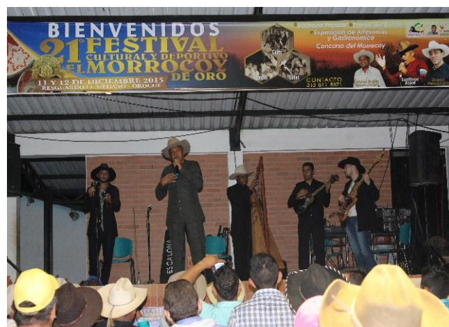
Presentación artistas llaneros en Festival del Morrocoy