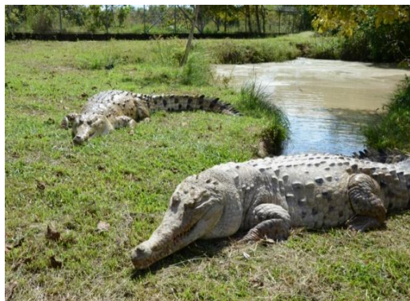
Caimán Llanero – Wisirare