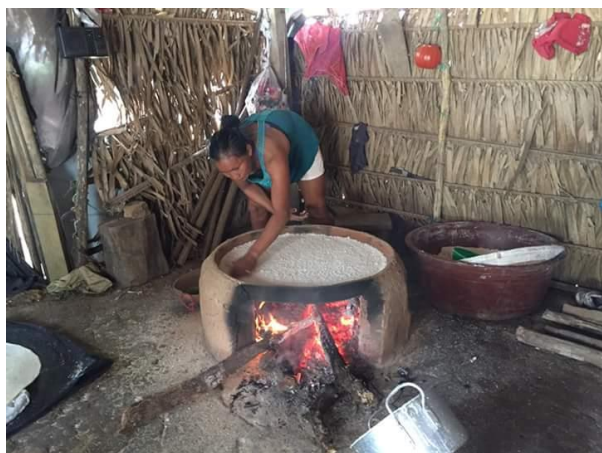
Mujer Indígena Resguardo el Consejo – hacienda Casabe