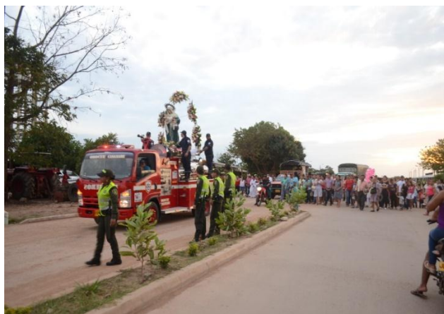
Procesión Virgen de la Candelaria