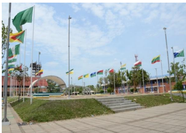
Plazoleta Municipal Las Banderas