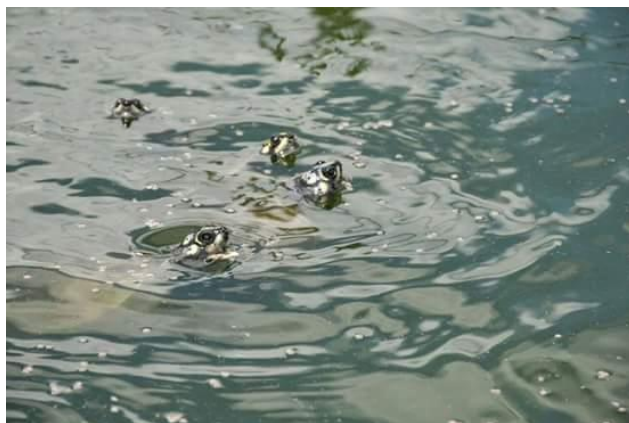
Tortugas charapa – Wisirare