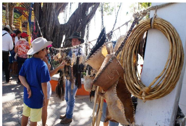
Artesanías de la región en cuero