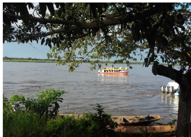
Navegabilidad a través del Rio Meta