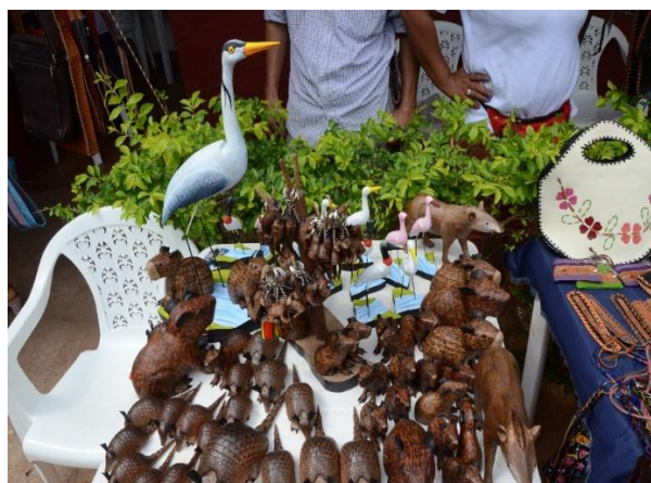
Artesanías en madera elaboradas por los Indígenas Sálibas