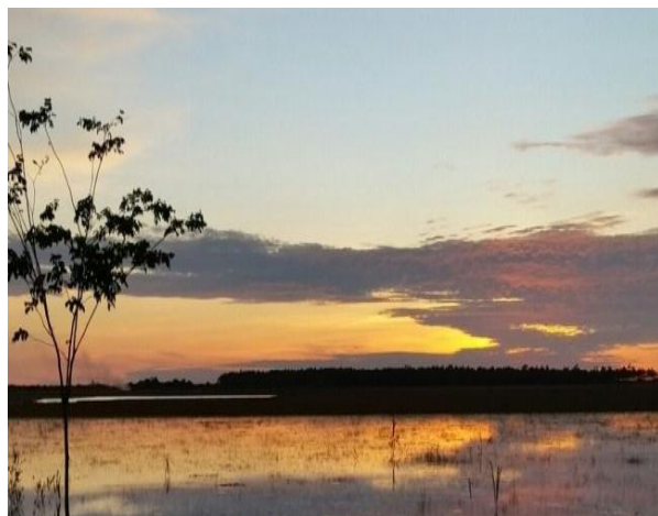
Atardecer en Reserva Natural Las Malvinas