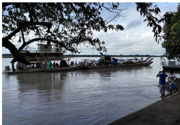
Transporte en lancha de vehículos por el Río Meta