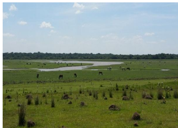
Vista –Laguna Paravare en Verano