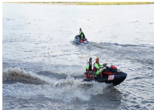
Competencia Náutica – Río Meta Orocué