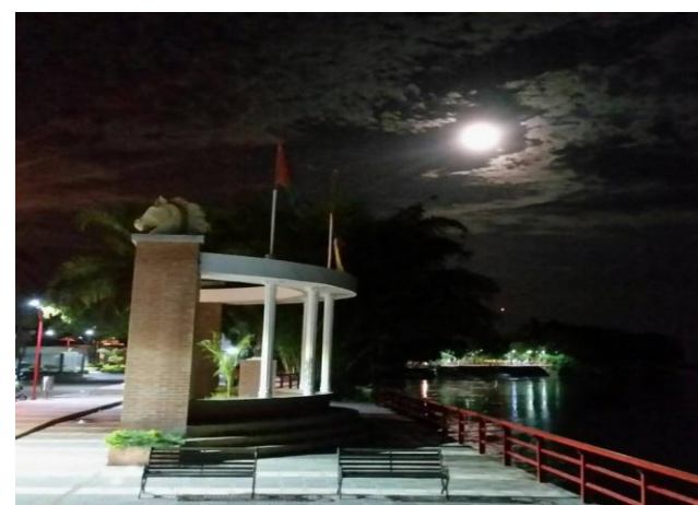
Malecon Sobre el Rio Meta en noche de luna llena