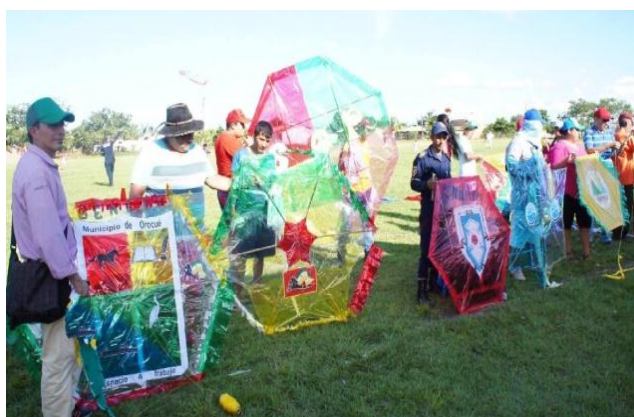
Concurso de cometas - Villa Olímpica