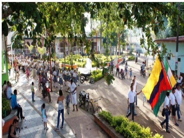
Evento programado sobre el Malecon del Rio Meta