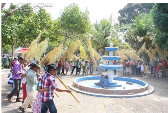
Danza del Botuto