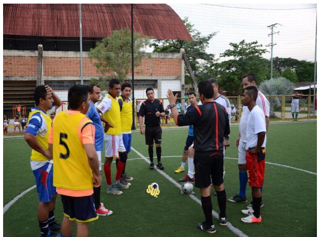
Campeonato Senior Master