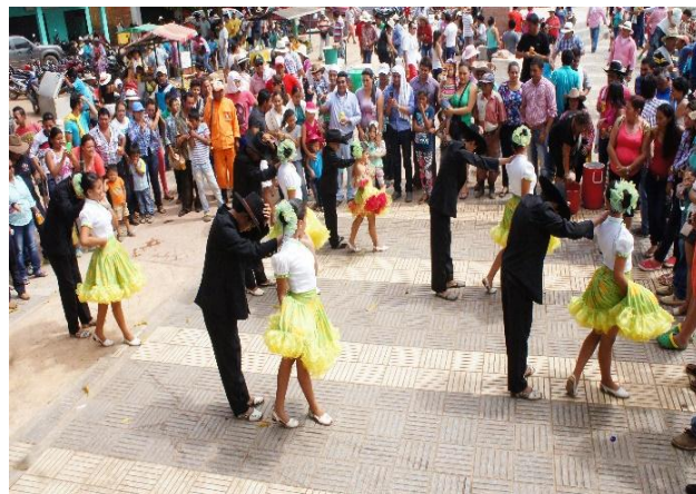
Danza del Joropo