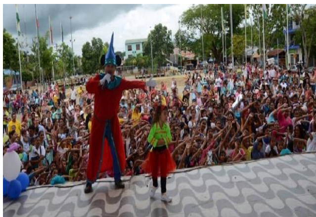
Celebración día del niño