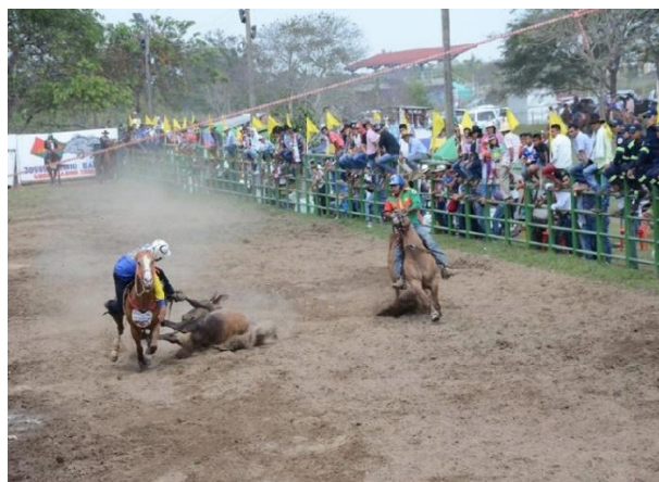
Tarde de Toros Coleados Ferias virgen de la candelaria