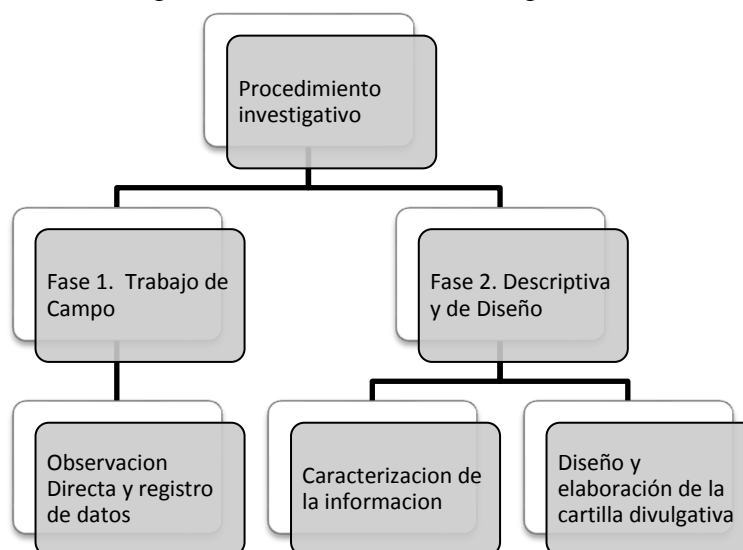
Figura 3 Procedimiento Investigativo