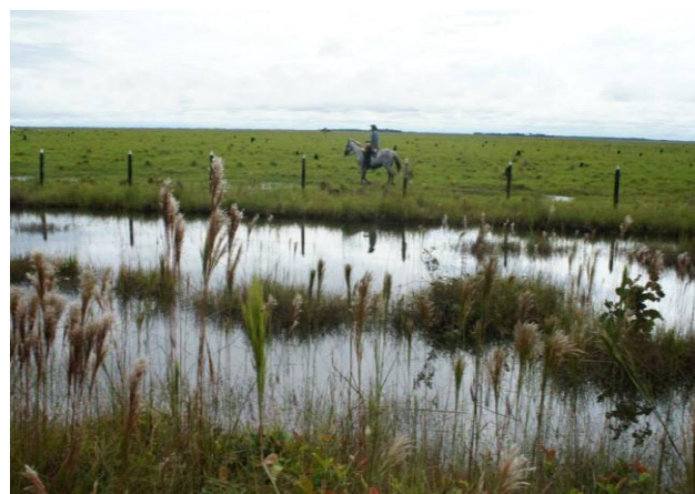
Entre Vereda la Esmeralda y Resguardo Duya