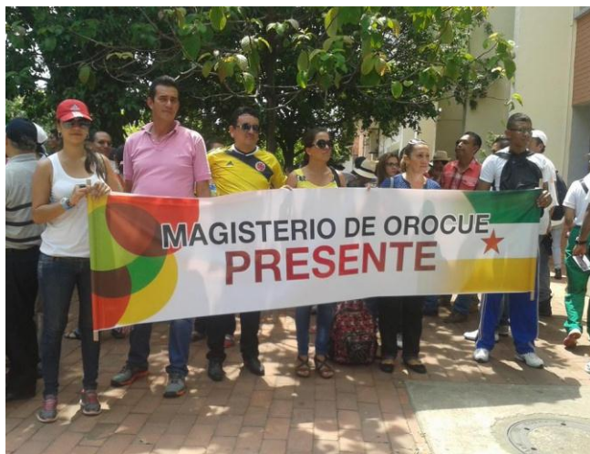
Profesores de Orocué