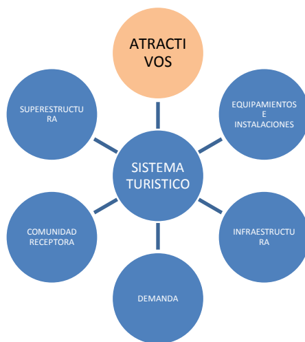
Figura 4 El Sistema Turístico

Teniendo como base el conocimiento propio, se afirma la investigación a partir de las investigaciones de otros autores como es el Sistema Turístico planteado por Molina 2013 citado en (Quijano, 2009, pág. 14), se toma el elemento Atractivos del Sistema, se elabora un listado y descripción que contiene Datos generales, ubicación del atractivo, características del atractivo, situación actual del atractivo, transporte y accesibilidad, facilidades y actividades turísticas de los atractivos turísticos del municipio de Orocué Departamento de Casanare, mediante la ficha 1. De observación encontrada en el (Anexo 1).