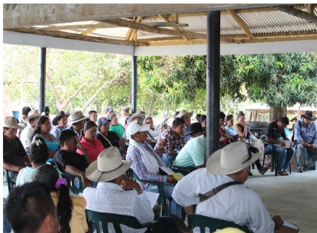
Comunidad Indígena Resguardo el Médano