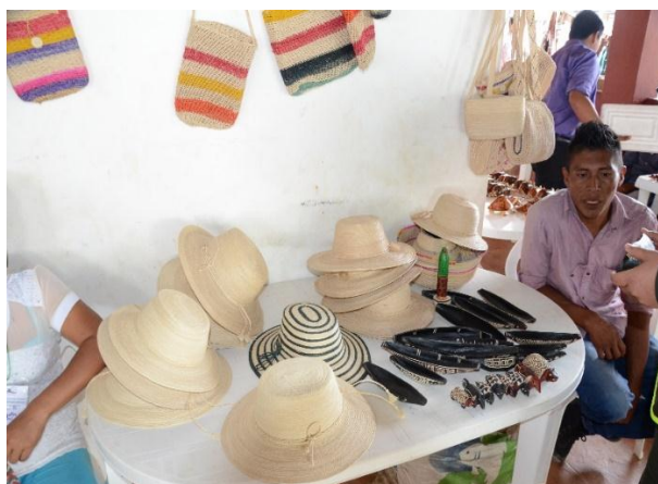
Artesanías en fibra de moriche elaboradas por los Indígenas Sálibas