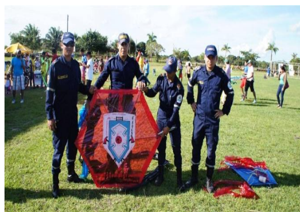
Concurso de cometas - Villa olímpica