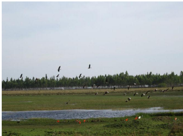
Aves en la Reserva Natural las Malvinas