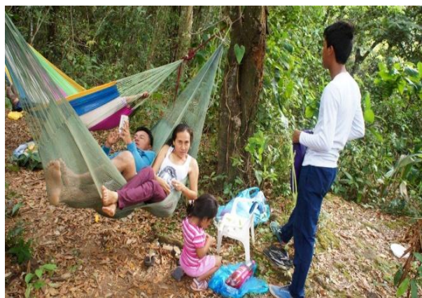
Área de descanso en balneario La Argentina