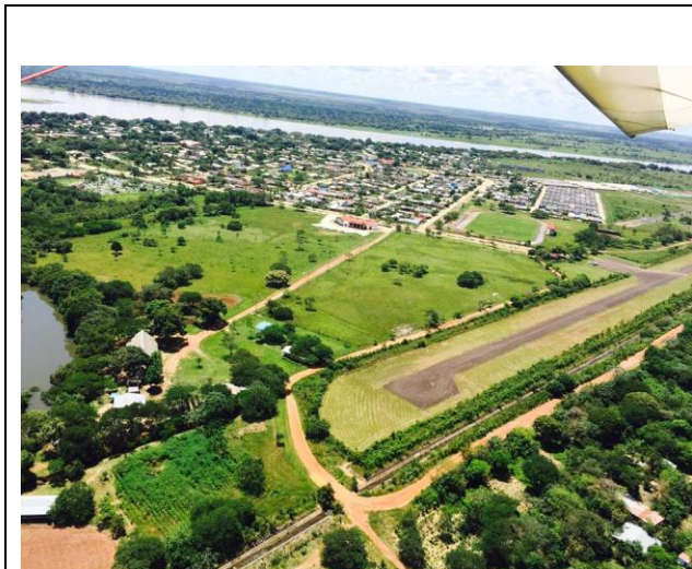
Panorámica de Orocué