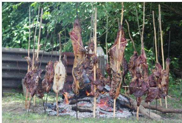
Mamona a la llanera