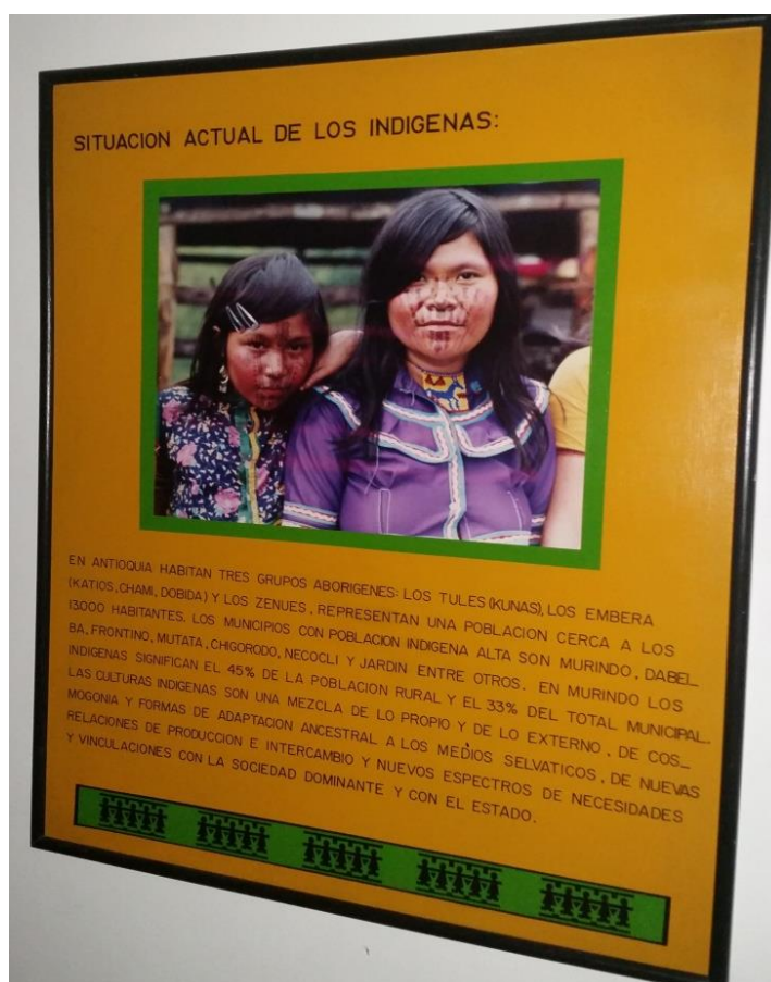
Gráfica No.4. Cuadro de la situación actual de los indígenas en la Organización Indígena de Antioquia-OIA. Fotografía: Grisales, D. (2015). Cr 49 No.63-57 Medellín-Antioquia, 28 de abril.

La economía de los pueblos indígenas tiene diferencias según las características del medio en que viven las comunidades, la naturaleza de la oferta y demanda ambiental, el nivel y la forma de vinculación a la economía del mercado (Arango & Sánchez, 1998, p.104).