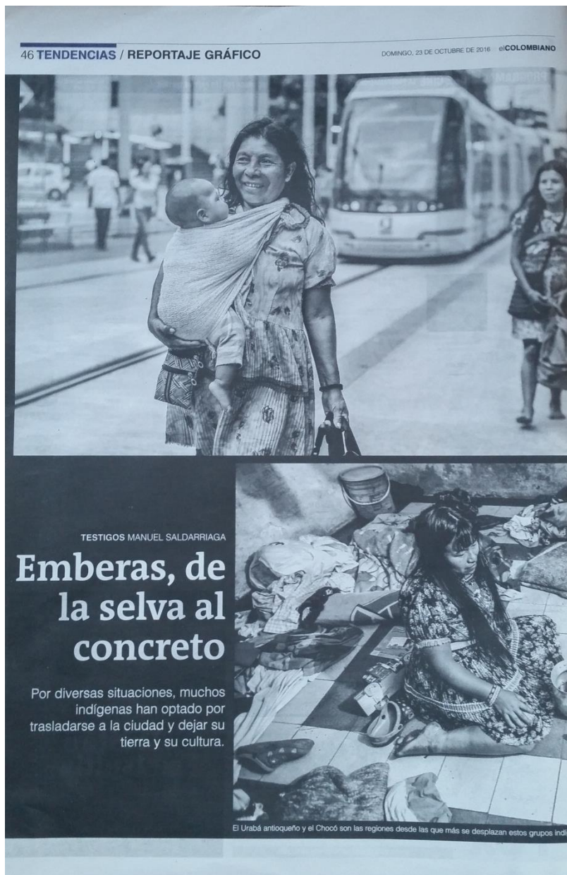
Gráfica No.10. Emberás, de la selva al concreto, parte 1.