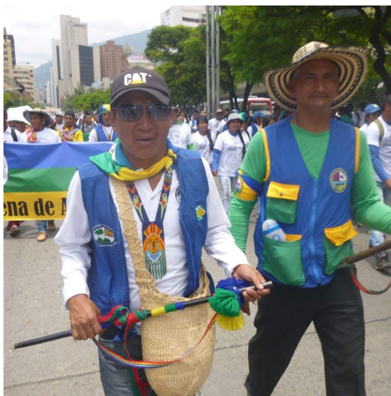
Gráfica No.7. Manifestación Emberá sale a la minga de la Organización Indígena de Antioquia-OIA en la ciudad de Medellín. Recuperado el 30 de julio de 2016 de: https://www.facebook.com/photo.php?fbid=1000504949994465&set=pb.100001049074929.-2207520000.1477260355.&type=3&theater.

Organización Indígena de Antioquia - OIA (2013), es un movimiento indígena que reclama el reconocimiento de una historia, una cultura y unos derechos, pero que no se abstrae de las luchas políticas por una sociedad en paz y más justa, generando alianzas estratégicas en la lucha por la supervivencia (prr.10), tal y como se evidencia en el siguiente gráfico extraído de la red social Facebook: