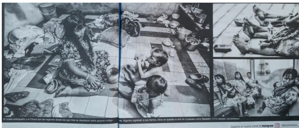
Gráfica No.9. Emberás, de la selva al concreto, parte 1. Fotografía: Saldarriaga. M. (2016). Periódico El Colombiano, Reportaje Gráfico, pp. 46-47, octubre 23.