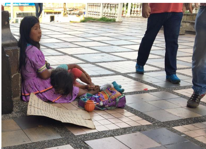
Gráfica No.8. Madre indígena Emberá y su pequeño hijo en el municipio de Copacabana. Atrio de la iglesia Nuestra Señora de la Asunción, Copacabana-Antioquia, 23 de octubre.

Visualizar el indígena Emberá Chamí y Dobidá en la ciudad de Medellín se ha convertido en un devenir del día a día, en cada calle que se camine siempre habrá hombres, mujeres y niños, de todas las edades realizando cualquier tipo de actividad con el fin de generar un sustento para sus familias radicadas en Medellín. Se puede observar en la fotografía una madre indígena Emberá con su pequeño hijo, tratando de generar un sustento económico a través de la mendicidad en el municipio de Copacabana: