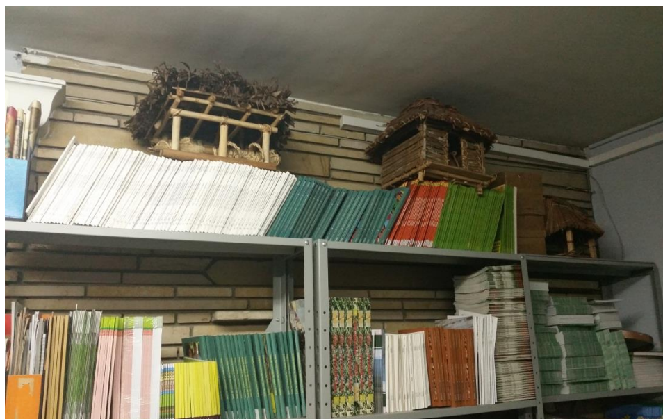
Gráfica No.2. Muestra de los tipos de chozas de los Emberá en la Organización Indígena de Antioquia-OIA. Fotografía: Grisales, D. (2015). Cr 49 No.63-57 Medellín-Antioquia, 28 de abril.

Dobidá significa habitante de las riberas de los ríos; los Emberá Dobidá representan el 2,67% de la población indígena del departamento de Antioquia. Se encuentran en el Atrato medio en la subregión de Urabá, en el municipio de Vigía del Fuerte.