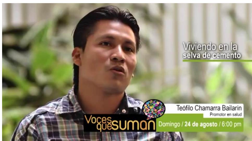
Gráfica No.12. Teleantioquia Viviendo en la selva de cemento.