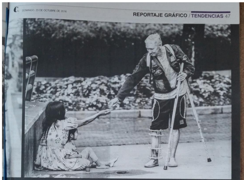
Gráfica No.11. Emberás, de la selva al concreto, parte 3.