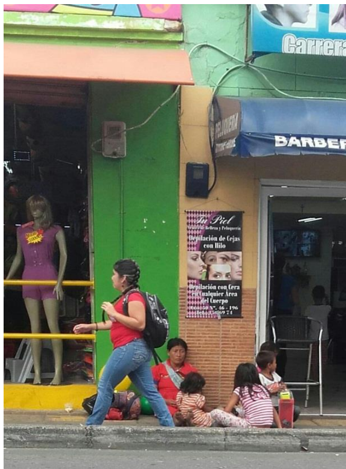
Gráfica No.1. Indígenas Emberá en el municipio de Bello. Parque de Bello-Antioquia, 4 de julio.

La fotografía representa cómo los indígenas Emberá emigran a la ciudad de Medellín, muchas veces a ejercer la mendicidad.