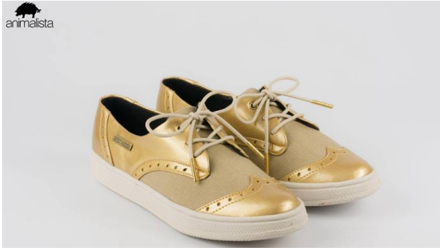
Imagen 4. Zapatos dorados Animalista diseño.