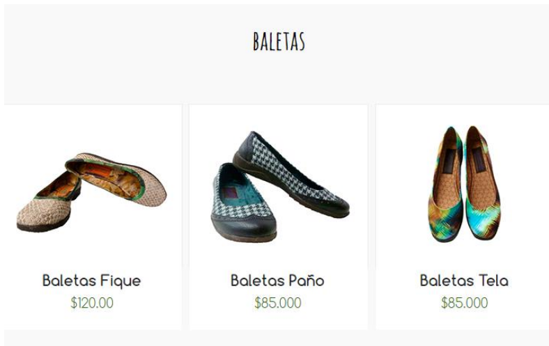
Imagen 3. Baletas Vegetariano Diseño Sostenible.

Animalista Diseño: Estos son algunos de los productos que ofrece nuestra competencia.