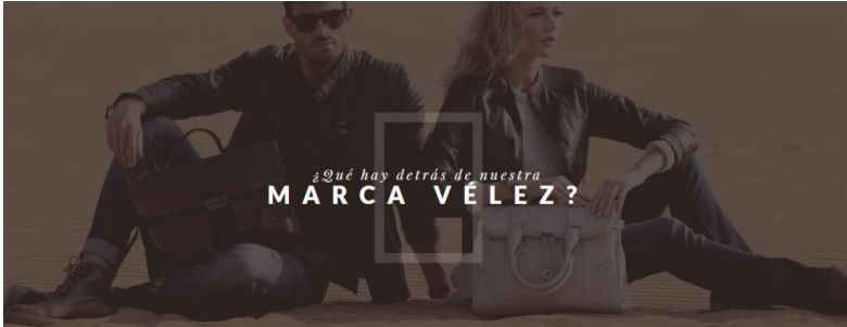
Imagen 15. Página Web competencia Vélez. Fuente página web