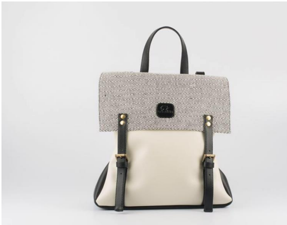
Imagen 5. Morral Gris Animalista diseño.