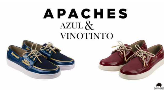
Imagen 19. Apaches Animalista diseño.

Animalista Diseño: Estos son algunos de los productos que ofrece nuestra competencia.