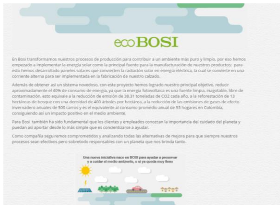
Imagen 14. Página Web Competencia BOSI publicidad ecológica y explicación.