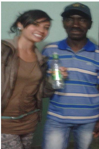
Imagen 11. Encuentro cultural.