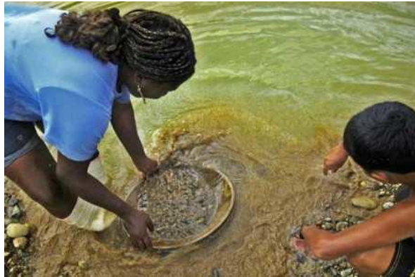
Imagen 2. Minería artesanal en Suarez Cauca