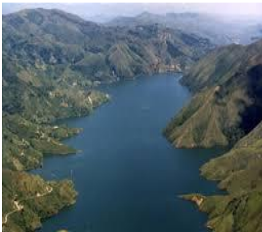
Imagen 1. Antes y después del embalse Salvajina

Lo cual deriva un proceso de resiliencia en donde se vulneran los derechos de las personas por medio de actos ilegales, en donde no se realizó una consulta previa de lo que se quería hacer con la región, lo que ocasiono que la comunidad afro migrara a la ciudad de Bogotá en busca de un refugio, el cual genero un fuerte choque cultural en estas personas, puesto que muchas de sus tradiciones y costumbres se perdieron y ellos se tuvieron que acostumbrar a una cultura totalmente desconocida. La presente imagen muestra el antes y el después del embalse la salvajina.