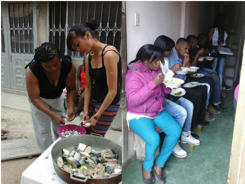
Imagen 12. Encuentro cultural.

la comunidad afro, la cual quedo sumamente agradecida con las profesionales en formación, tanto que se grabó un video por parte de esta comunidad, con el fin de dar unas palabras a las profesionales en formación, con el fin de exaltar el buen trabajo que se realizó. Después de esto las profesionales en formación agradecieron a la comunidad afro por el apoyo brindado en todos los encuentros, y por permitirles realizar su trabajo de grado el cual busca que la cultura afro prevalezca.