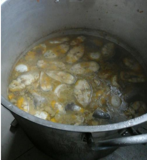
Imagen 7. Sancocho Caucano