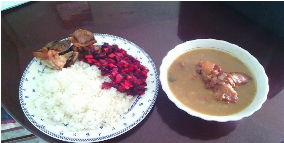
Imagen 6. Plato típico viernes santo.