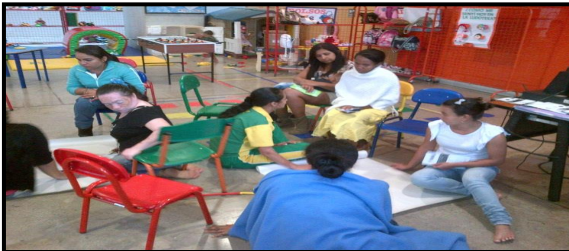
Figura 4. Evidencia fotográfica taller con mujeres víctimas de violencia intrafamiliar, (2014)