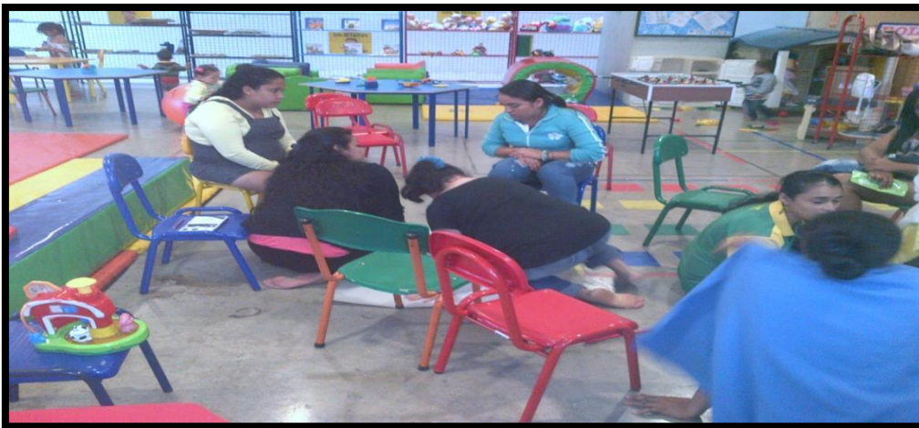
Figura 3. Evidencia fotográfica de taller con mujeres víctimas de violencia, fuente elaboración propia (2014).