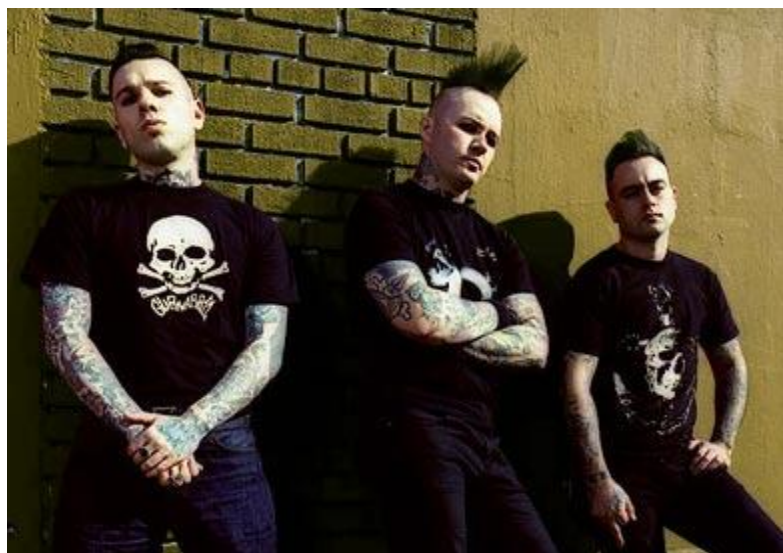
Banda Tiger Army

Para contextualizar al lector, se entiende que el Psychobilly, es un género musical que nació a finales de los años 70 en Inglaterra, rescatando varios elementos y conceptos musicales del Rock and roll, Punk / Rock y Rockabilly principalmente. Este género se