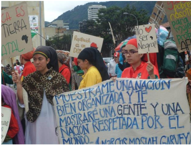
Participacion de mujeres Rastafari de la casa Boboshanti en la Marcha del día nacional de la Afrocolombianidad.