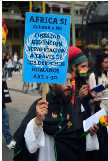
Participacion lideres en los movimientos cimarron y Rastafari de la casa Boboshanti en la Marcha del día nacional de la Afrocolombianidad.