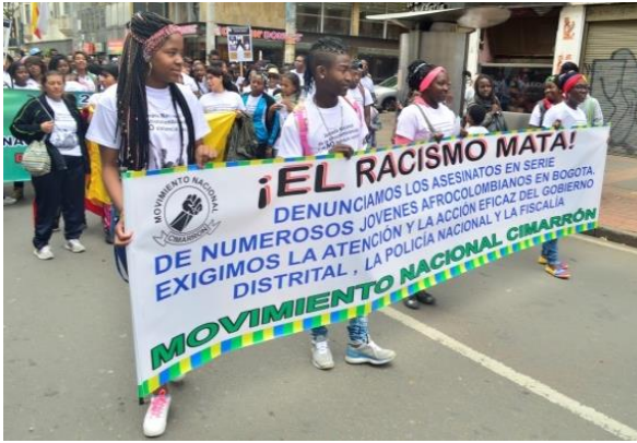
Comunidad Movimiento Nacional Cimarrón, en la marcha del día nacional de la Afrocolombianidad. Jovenes Afrocolombianos.