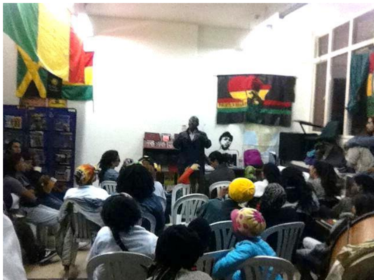
Reunion de la comunidad Afrocolombiana y Rastafari en la Biblioteca Negra Haile Selassie. Fotografo: Daniela Niño (2015)