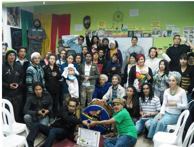
Posteriores encuentros y participaciones en la Biblioteca Negra Haile Selassie, con las comunidades Afro. Fotografo: Daniela Niño (2015)