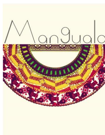
Ilustración 5. Logro Proyecto Manguala

El logo del Proyecto Manguala, fue realizado durante el primer trimestre del año (2015,) por el Diseñador Gráfico Mario Benavides, quien aportó al proceso, dando una