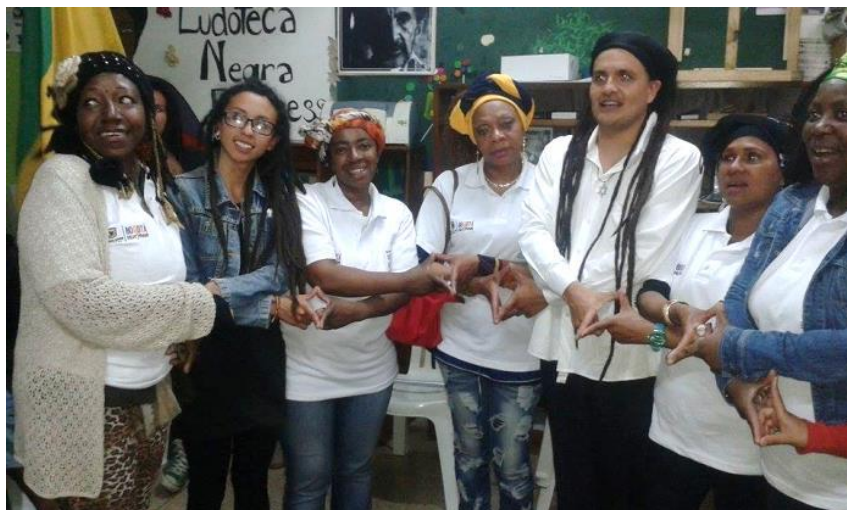
Mujeres Afro, Investigadores, lideres afro y Rastafari en la Biblioteca Negra Haile Selassie. (2015)