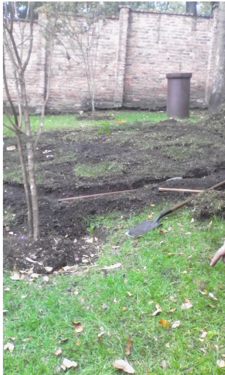
Ilustración 19 Fase devolución creativa, círculos de palabra