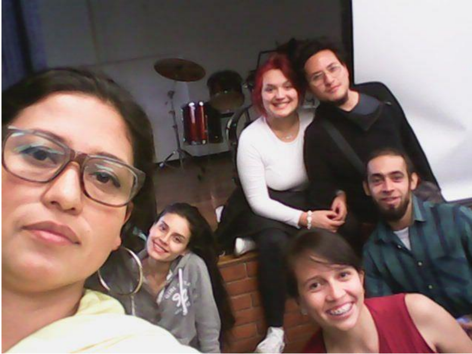
Ilustración 14 Fase actuar, ensayo de SCAD