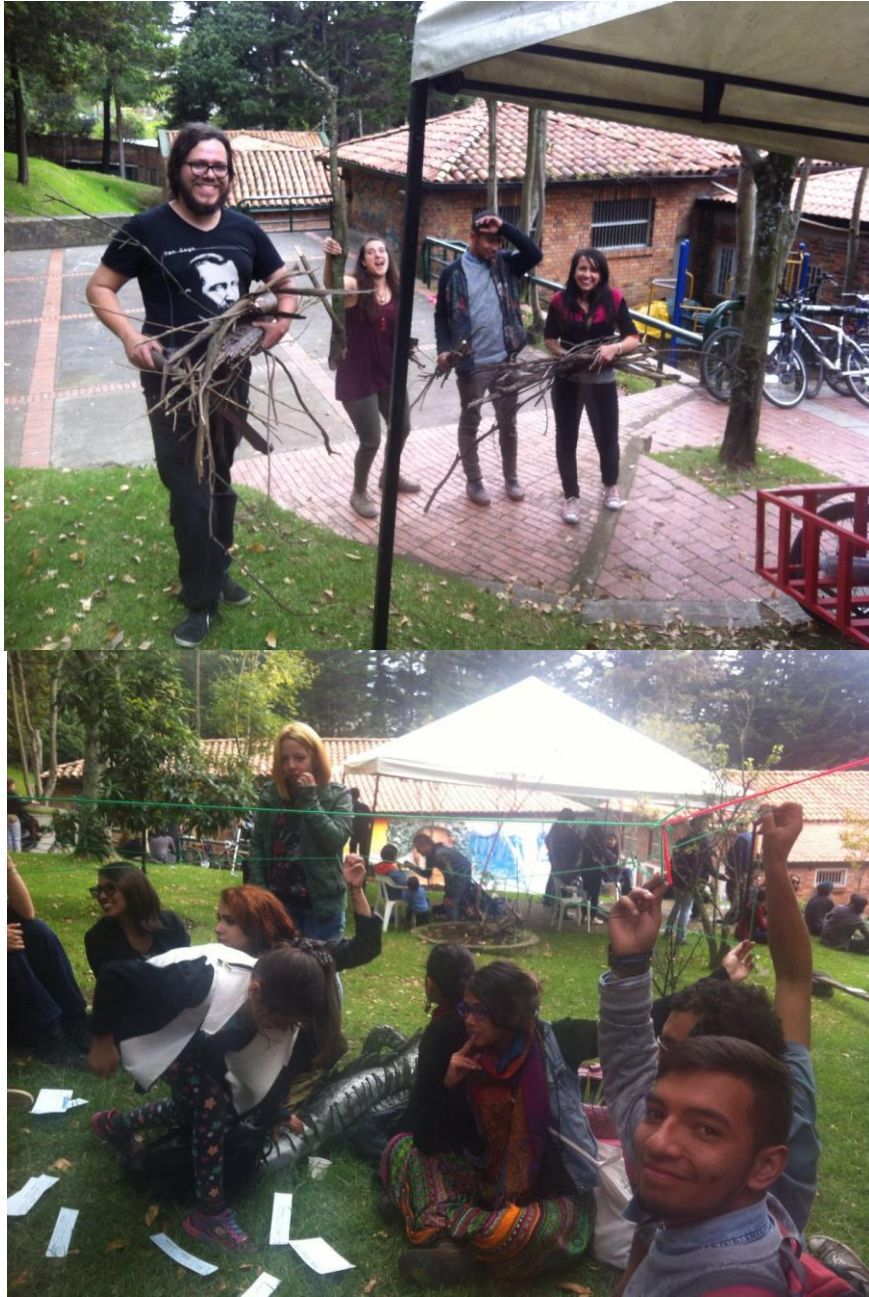
Ilustración 18 Fase devolución creativa, nuevas prácticas decoloniales en compañía con el colectivo Red Ie Cho