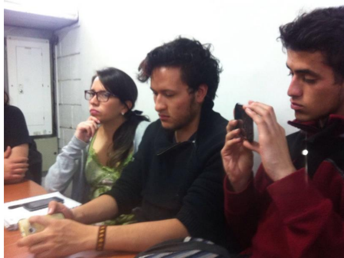
Ilustración 11 Fase juzgar: debate y consenso problemática