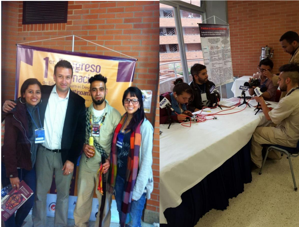
Ilustración 7 Evidencia fase ver congreso CED