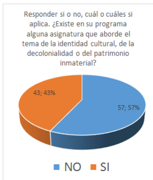
Ilustración 4 Gráfico del análisis de la categoría patrimonio

A partir de esta matriz surge el siguiente gráfico que evidencia el conocimiento frente a los espacios que aborden la identidad cultural, el patrimonio intangible de la humanidad en Colombia y la decolonialidad en la Universidad.