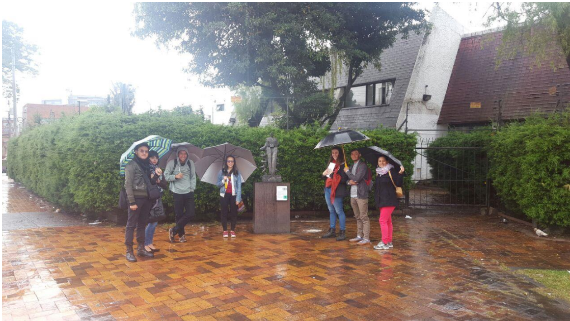
Ilustración 10 Fase juzgar debate y lluvia de ideas frente a la postura decolonial por medio de un ejercicio práctico