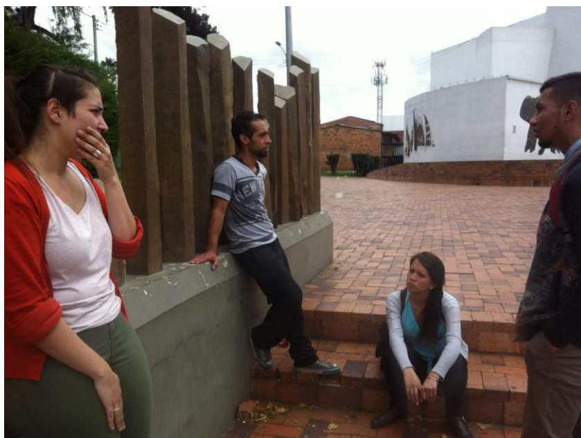
Ilustración 13 Fase actuar, lluvia de ideas en una sesión con semillero Suna Cubun