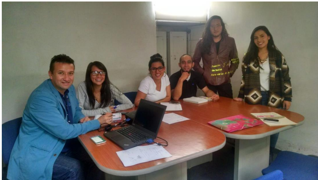
Ilustración 12 Fase juzgar, diseño escrito del ejercicio práctico