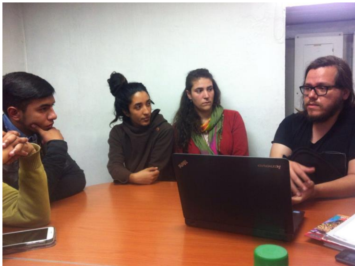
Ilustración 17 Fase devolución creativa, reunión con el colectivo Red Ie Cho