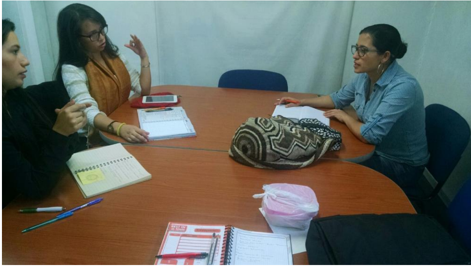
Ilustración 8 Evidencia fase ver, indagar.