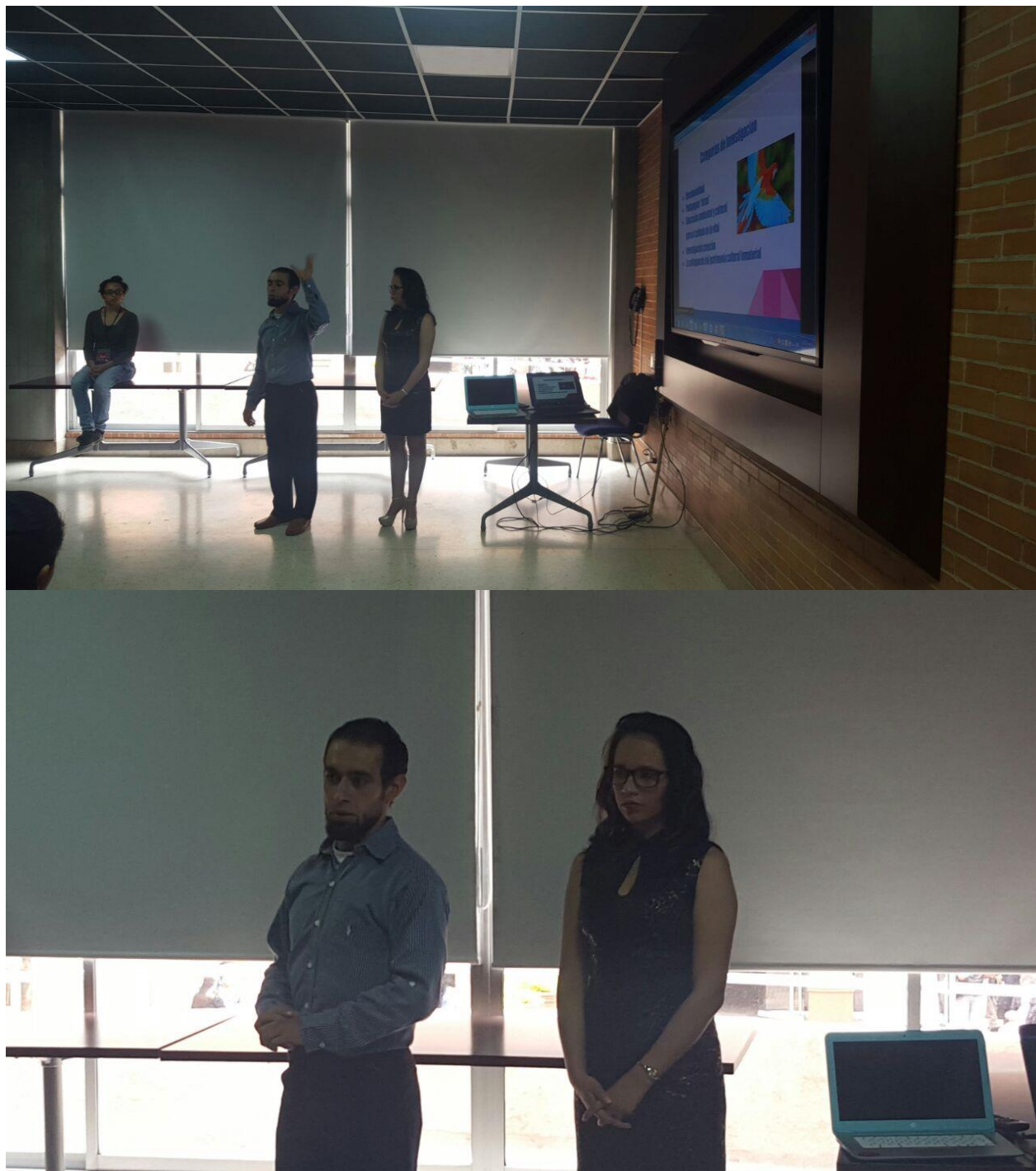
Ilustración 15 Fase actuar, puesta en escena de SCAD 4-5 Mayo 2016 VI semana de la educación