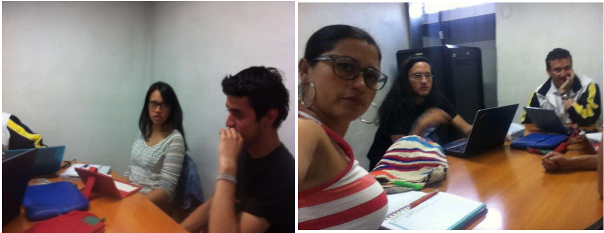
Ilustración 9 Fase ver indagar