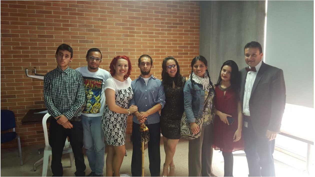
Ilustración 16 Fase actuar, integrantes del laboratorio PDEA (actores y actrices invisibles)