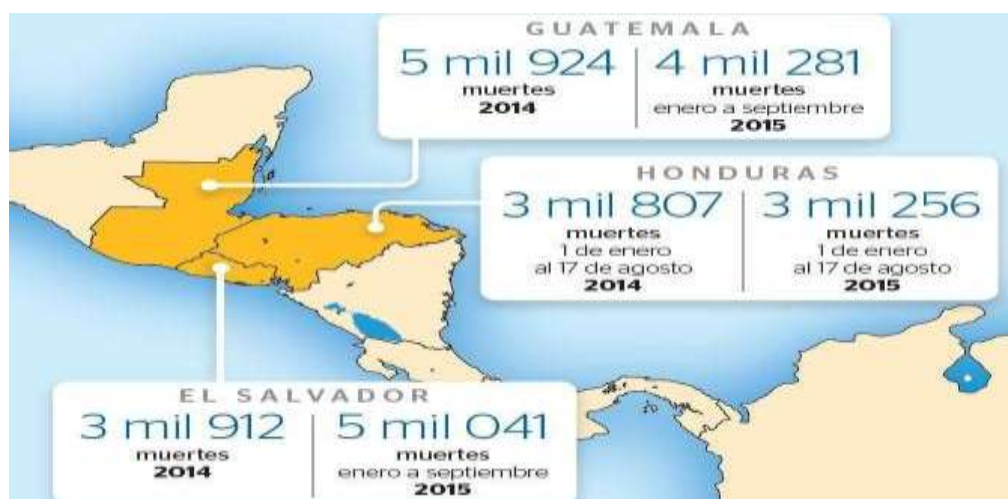
Ilustración 8:

La experiencia de conocer Centroamérica en carretera es bastante impresionante, ya que se puede vivir el recorrido de muchas personas que migran hacia México, conociendo las rutas y accesos que toman (En estos tres países sus ciudadanos pueden transitar libremente). Entender el contexto en el que se desarrollan los migrantes es importante para comprender mejor la situación y entender por qué migran.