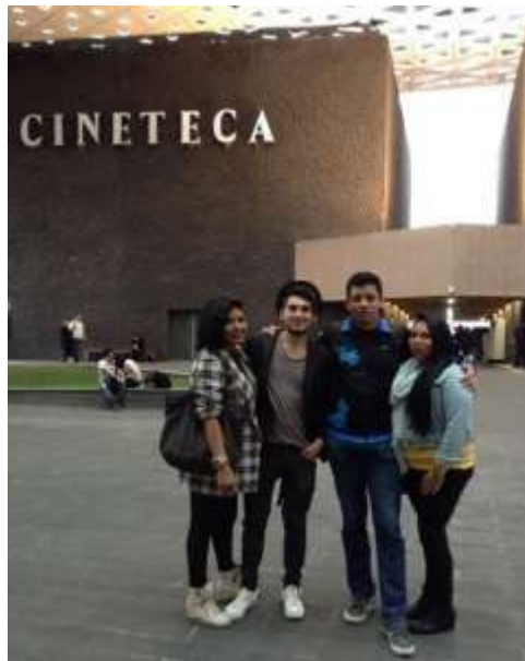
Ilustración 2 : Foto de la Cineteca Nacional en Ciudad de México

La cineteca Nacional de México es un epicentro cultural importante para ciudad, ya que congrega a cientos de personas afines al mundo del cine. Su variada programación con ofertas que permiten interactuar a la audiencia con directores por medio de conferencias o conversatorios nutren y promueven la participación de más personas a que se sumen a la industria.