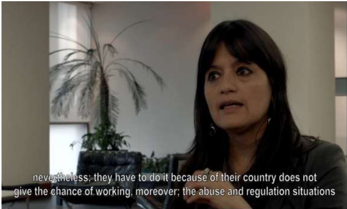
Ilustración 20: Entrevista a Julissa Mantilla para el Documental Ruta 94

Entendiendo las distintas formas de violencia en contra de la mujer, es importante establecer el tipo de conflicto que se diferencia al de los hombres migrantes, ya que las mujeres se enfrentan a situaciones más complejas. A continuación el Instituto para las Mujeres en la Migración hace referencia al contexto en el que se está inmerso el fenómeno de la migración para las migrantes: