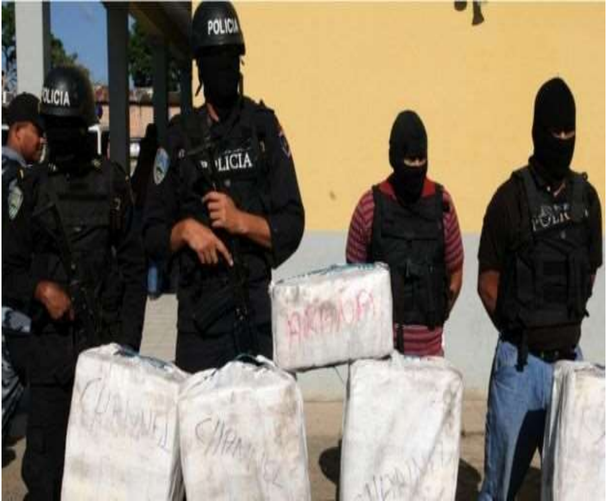
Image caption Cargamento de cocaína decomisado en Honduras