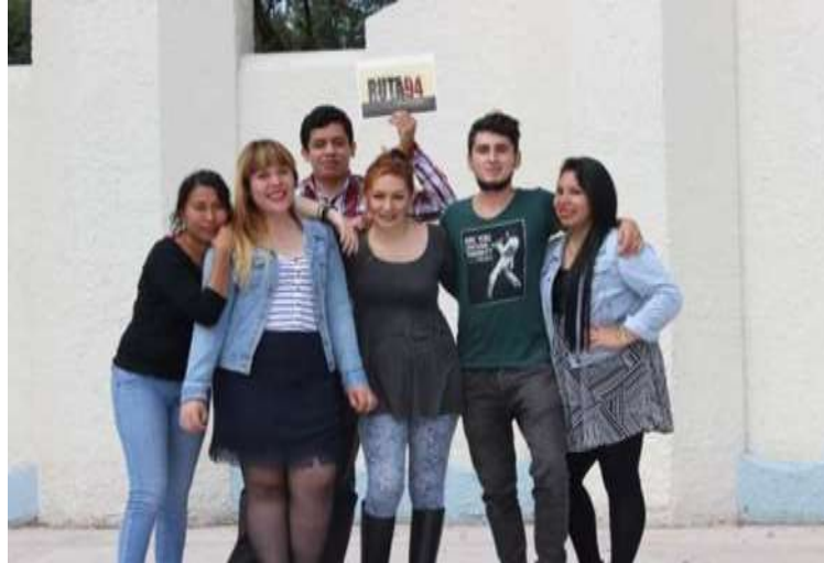
Ilustración 12: Equipo de Ruta 94 durante la campaña de crowdfunding (Ciudad de México)

Adicionalmente a la colaboración de muchas personas en todo el mundo, recibimos apoyo por parte de la Red Europea de Refugios (RER), quienes aportaron $1000 Dólares (USD) tras ver un adelanto en la 3 cumbre mundial de refugios con sede en la Haya en el mes de noviembre. Las fuentes de financiación llegaron complementarias al capital estimado en $22 millones de pesos colombianos, incluyendo equipos, viajes y talento humano, en la cual la productora invirtió para solventar los gastos adicionales.