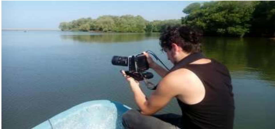
Ilustración 6: Toma desde Rio Suchiate (Frontera México-Guatemala)

Conocer las zonas de flujo y crear registros a través del manejo de un equipo cinematográfico, en este caso una cámara Black Magic 2.5k, representó una experiencia y responsabilidad importante, ya que todo lo grabado dependía de mí en calidad como fotógrafo. En este punto es importante mencionar que anteriormente he trabajado en documentales y a lo largo de la carrera se trabaja la fotografía, (un complemento importante en la formación como comunicador social).