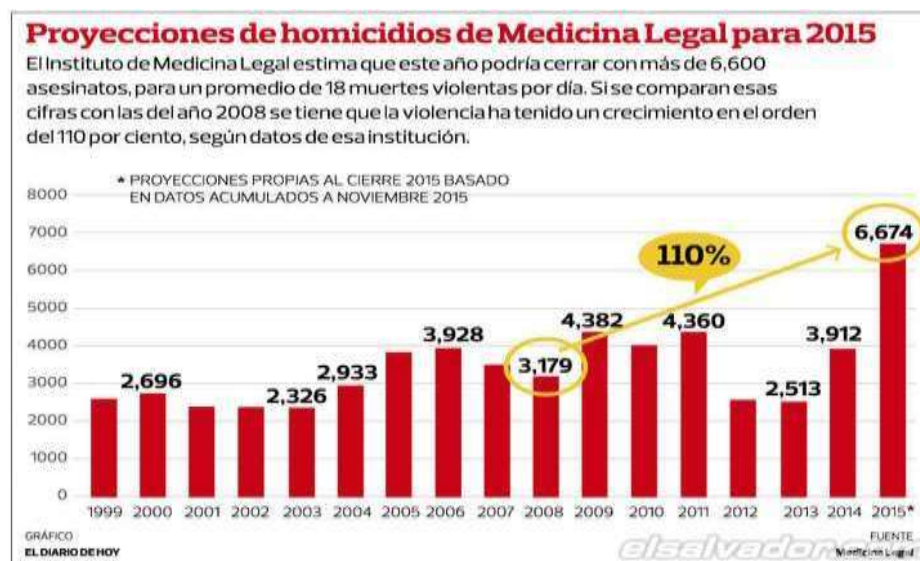
Ilustración 14: Imagen sacada de El diario de hoy (El Salvador)

La situación que se vive en países como El Salvador facilitan la salida de las personas, ya que la falta de garantías del Gobierno en materia de seguridad que ayuden a contra restar la guerra entre pandillas (principalmente la mara salvatrucha ms13 y barrio 18) dejando como saldo miles de muertos representa un aspecto determinante para emigrar. A continuación veremos un gráfico proporcionado por medicina legal y publicada por El diario de hoy, en el cual se ve disparado el índice de homicidios en los últimos años.