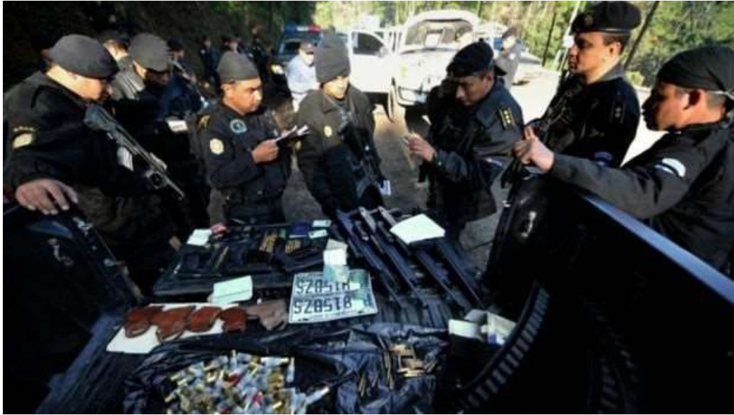
Image captionPolicías en Guatemala observan un arsenal decomisado al cartel de Los Zetas.

De las selvas entre Colombia y Panamá hasta el Río Suchiate, que separa a México de Guatemala. Por las costas del océano Pacífico y las rutas aéreas sobre el Atlántico; con sicarios propios o a través de pandillas aliadas.