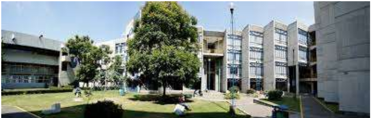
Ilustración 3 Tomada del Portal Web de La UAM Xochimilco

Es importante señalar el crecimiento personal, puesto que empezar a crear vínculos con otras personas afianzo mi identidad y confianza para desenvolverme en un entorno hasta entonces desconocido, en el cual interactuar con personas afines al cine desde la academia me permitió conocer más allá de las aulas, al punto de crear ejercicios complementarios con algunos compañeros que ya tenían experiencia previa y me brindaban más herramientas para entender mejor la industria cinematográfica.