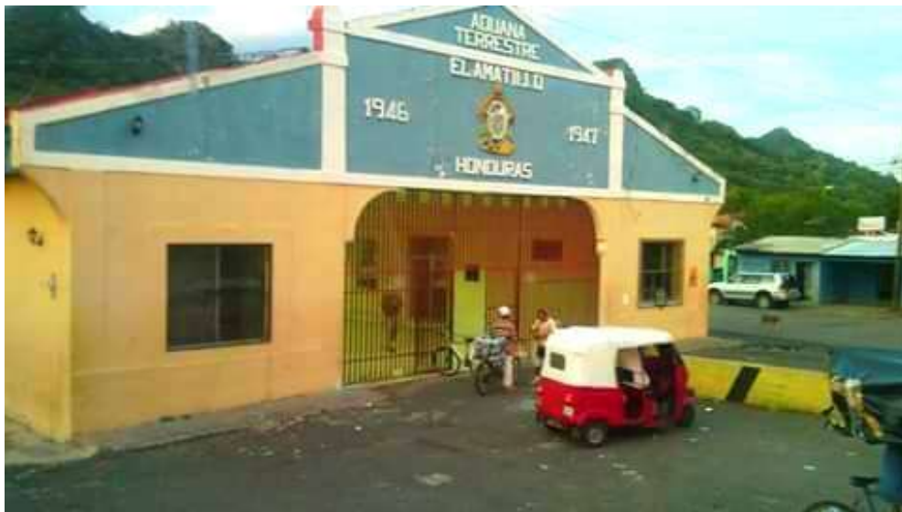
Ilustración 11: Frontera entre Salvador y Honduras

atracos a mano armada y secuestros se pueden ver de una forma más evidente con la caída de la noche en un lugar donde reina el miedo y la desconfianza.