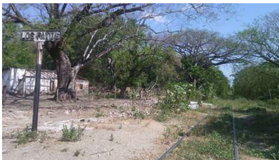
Ilustración 17: Los Patos, zona por donde pasa la bestia

Por parte de producción se pudo conocer algunos caminos donde interceptaban a migrantes para robarles sus pertenencias, golpearlas, secuestrarlas e incluso violarlas, en el Estado de Chiapas recorrimos por la zona de los patos, una zona conocida por su peligrosidad ya que esta es una zona de difícil acceso donde las bandas criminales, en especial la mara MS 13 hacen presencia para hacer el retén.