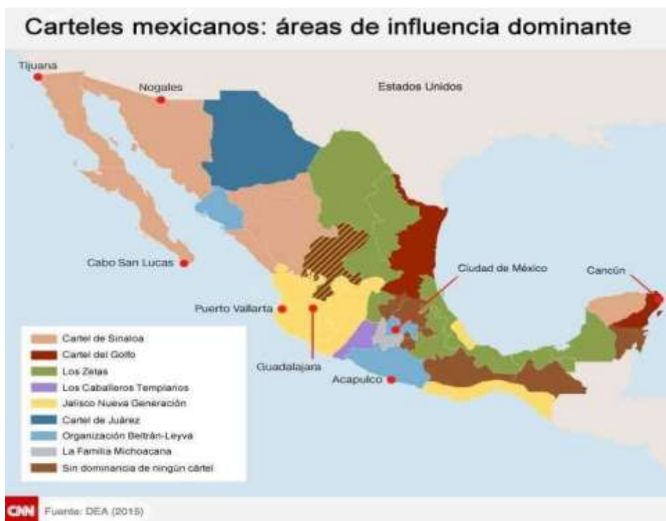
Ilustración 18: Imagen sacada de CNN en español

Para Jorge Fernández Menéndez (2001), se debe “entender al narcotráfico como una “estructura de poder” porque de esta manera se puede comprender la magnitud real de dicho fenómeno, “... sus relaciones con otras relaciones con otros fenómenos del crimen organizado, cómo operan sus espacios de influencia política y su relación con procesos desestabilizadores, con decisiones políticas, económicas y sociales...”p15)