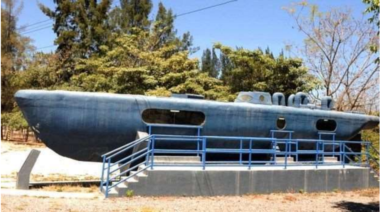
Image captionSubmarino decomisado en Honduras al cartel de

Sinaloa Pero no es la única organización mexicana en activo.