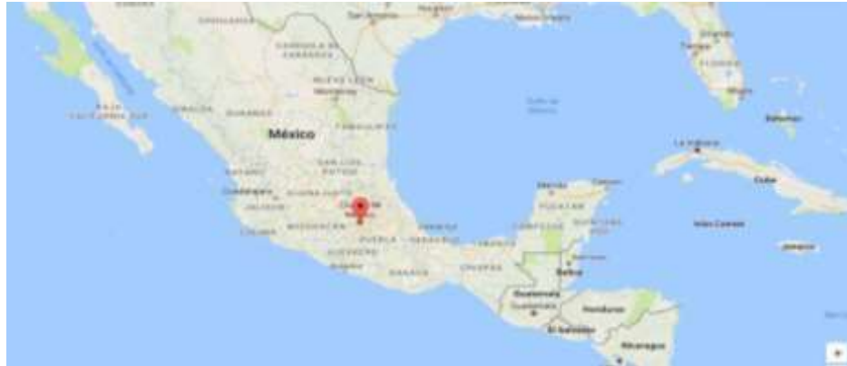
Ilustración 1 : Ubicación de Ciudad de México

Fue fundada en 1525 por conquistadores españoles, quienes, tras derrotar a los mexicas, construyeron una nueva ciudad sobre las ruinas de Tenochtitlán, sede del imperio azteca. La consolidación de la ciudad como una de las principales urbes del mundo por su población y oferta cultural, establecieron un buen lugar para el desarrollo profesional, académico y sobretodo personal. La ubicación geográfica también es un factor importante, ya que al limitar en el norte con los Estados Unidos de Norteamérica y al sur con Guatemala crea un corredor importante de economía, cultura y personas que tratan de llegar al norte en busca de mejores oportunidades.