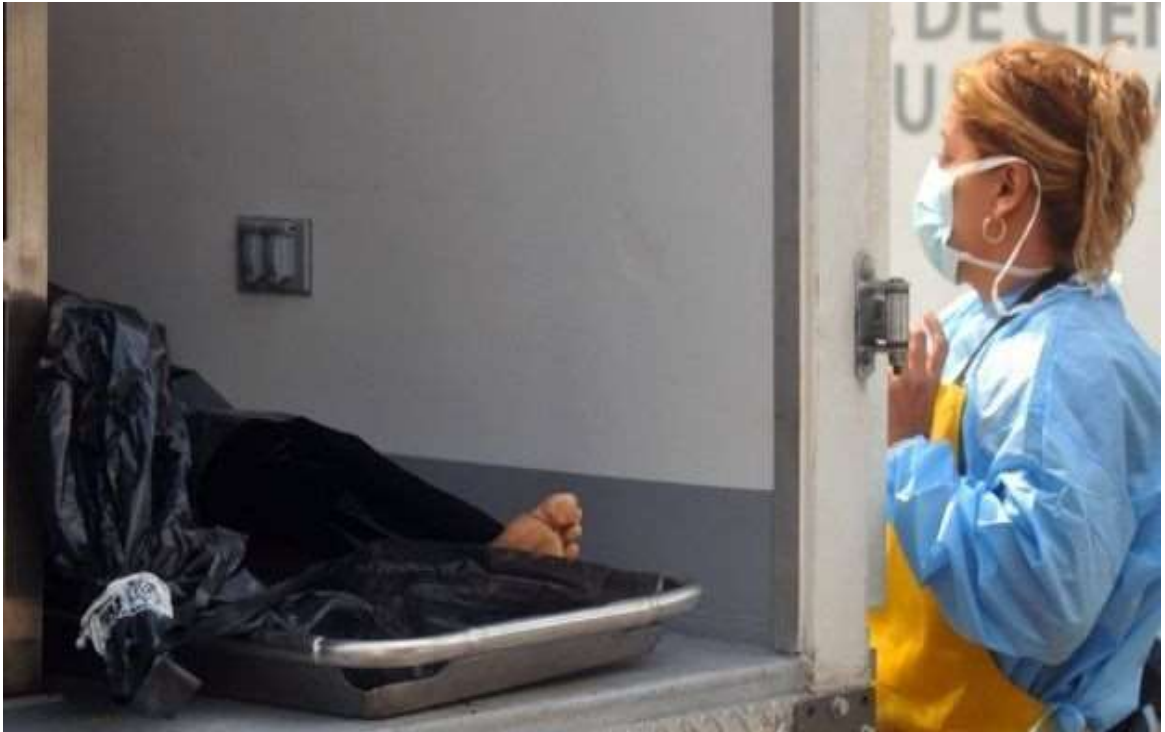
Image captionVíctimas de la violencia del cartel de los Zetas en