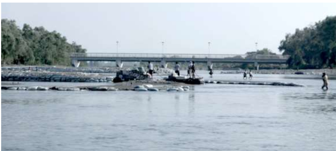
Ilustración 7: Toma del río Suchiate

Según las personas que transportan allí aseguran que tienen que pagar piso para poder trabajar en el lugar, ya que es controlado por organizaciones criminales, del lado de Guatemala la mara 18 y del lado de México un grupo relacionado con el cartel de Sinaloa.