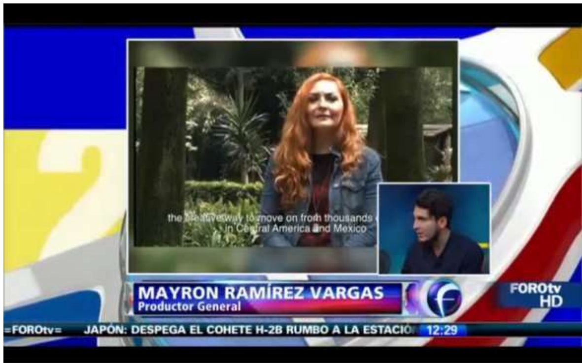
Ilustración 5: Entrevista Canal Foro TV (Televisa)

proyecto para lograr la meta, entre ellas la promoción del proyecto en medios de comunicación .