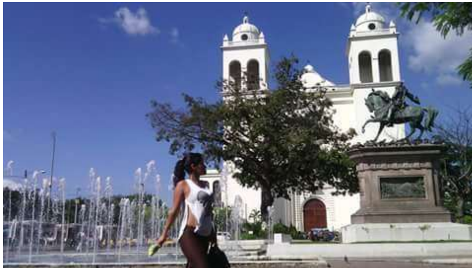
Ilustración 10: Plaza de San Salvador – El Salvador

La Experiencia en San Salvador fue algo compleja, ya que al llegar se pudo establecer contacto con la Directora de un Refugio quien nos comentó que por amenazas de la mara Barrio 18, decidió no dar declaraciones ya que teme a represarías por parte de los compañeros sentimentales de algunas mujeres que se encuentran en la casa de acogida.