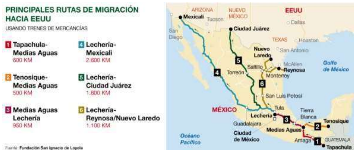
Ilustración 16:

3) Efectos disruptivos de la migración, pueden existir tales efectos en los países receptores si se produce algún choque cultural o rechazo en la sociedad que dificulte la integración del grupo migrante; las reacciones pueden reflejarse en la creación de comunidades excluyentes o antagónicas, quienes posteriormente puedan llegar a implementar la violencia. (p.53-59),