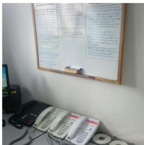
Sala de conmutación