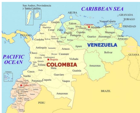
Imagen 1 Mapa geográfico de Colombia y Sus límites terrestres.