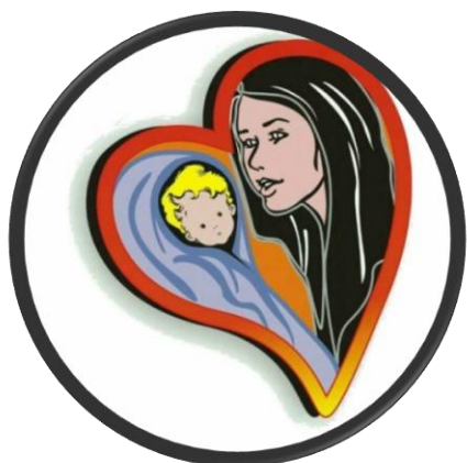
Imagen 5 Urrego, w. (2013). Logo crónica Audiovisual de historias de vida sobre El trabajo informal nocturno en madres Cabeza de familia en Villavicencio.