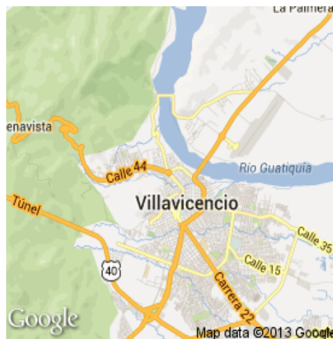
Imagen 4 Mapa geográfico de Villavicencio.