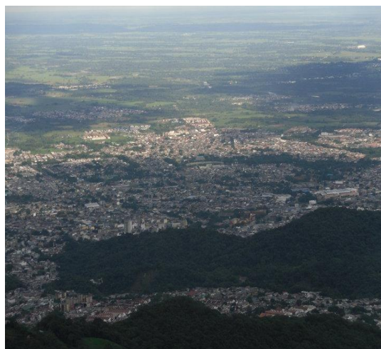
Imagen 3 Panorámica de Villavicencio. 22 de abril del 2010