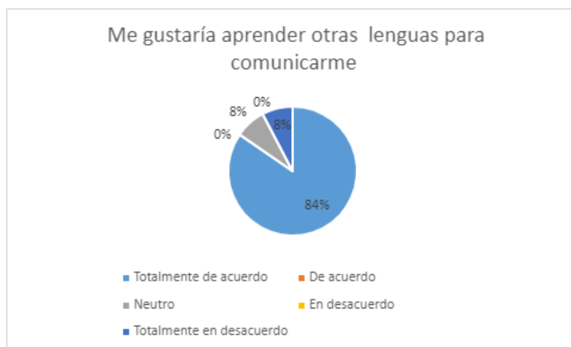
Gráfico 1 Escala Likert