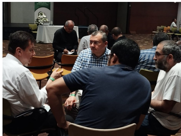
Trabajo en pequeños grupos

datos precisos relacionados con el “síndrome del cansancio del cuidador”, que también afecta al colectivo sacerdotal por las exigencias pastorales actuales de escucha y acogida de las personas que acuden a ellos.