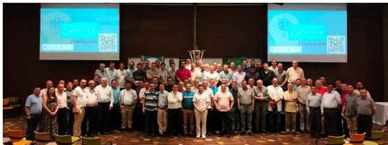
Grupo de presbíteros de la Arquidiócesis de Bogotá – Talleres de salud mental