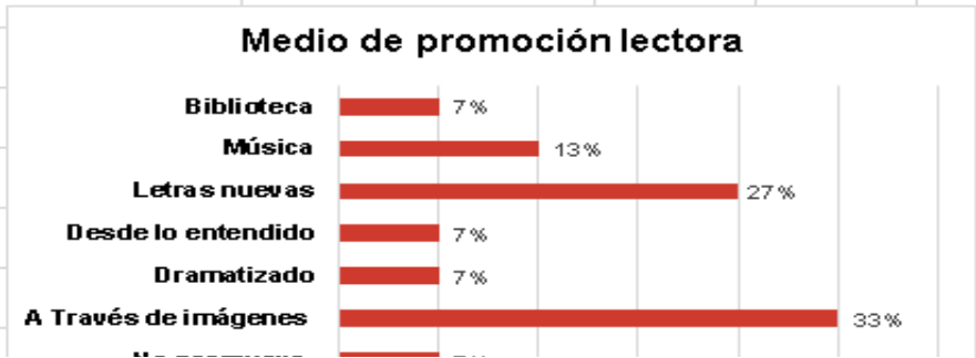
Figura 1 2Resultados encuesta pregunta 2

La lectura de la siguiente gráfica deja ver que las familias comparten la lectura que realizan en un 7% la visita bibliotecas, con música infantil o canticuentos lo comparten en un 13%, realizan lecturas nuevas en un 27% responden los encuestados, desde lo que entienden y la acción de dramatizar o interpretar desde esas representaciones lo hacen en un 7% , el 33% por ciento de las familias utiliza imágenes para el compartir de las lecturas que realizan y el 7% responde que no promueve la lectura.