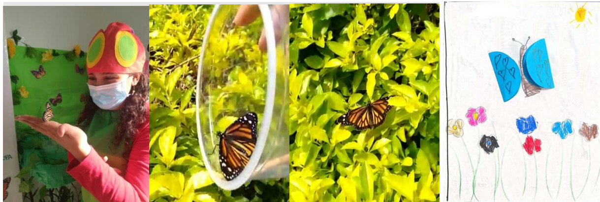
Tabla 7. Bob y Otto