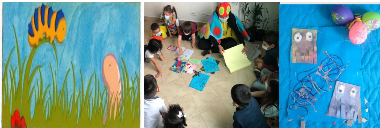
Tabla 8. Mariposita va a la escuela