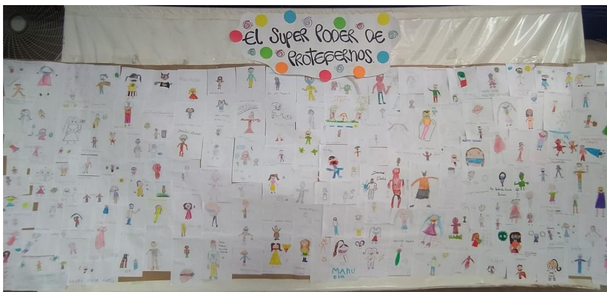
Figura 1. Mural actividad identificación de súper héroes

covid-19. Para finalizar la actividad se les suministro materiales para que a partir de la imaginación se dibujen a ellos mismos como super héroes usando tapabocas (Figura 1), explicando que super poder les da el tapabocas. La duración de la actividad fue de 40 minutos por cada grupo culminando con la recolección de cada dibujo para la elaboración de una cartelera en el patio de la escuela donde ellos pudieran observar sus dibujos en los recreos recordando el super poder de protegernos.