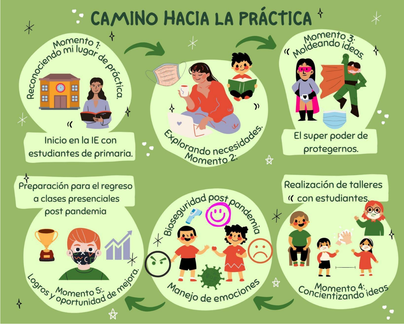
Diagrama de la reconstrucción