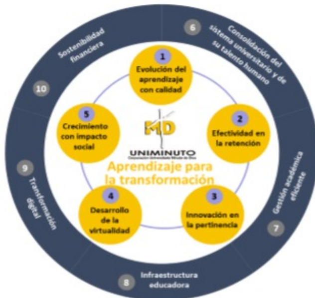
Figura 3. Representación gráfica de las líneas estratégicas PED 2020-2025.

Fuente: Gerencia de Planeación y Desarrollo – Servicios Integrados UNIMINUTO.