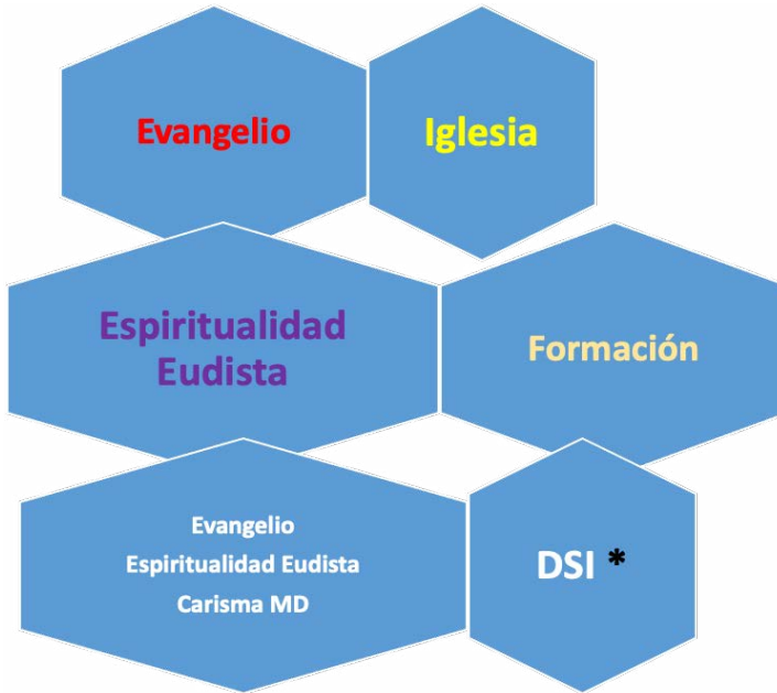
Figura 5. Enfoque funcional y formativo: DSI en sus fuentes y dinámicas.