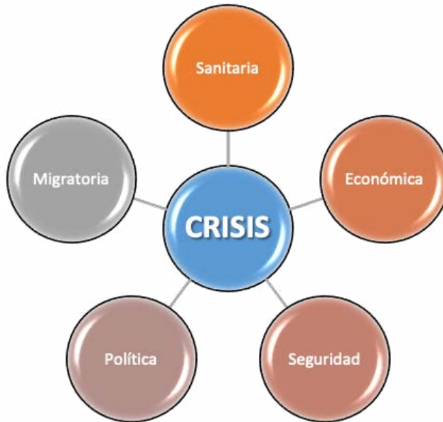
Figura 1. Crisis recientes en Colombia.