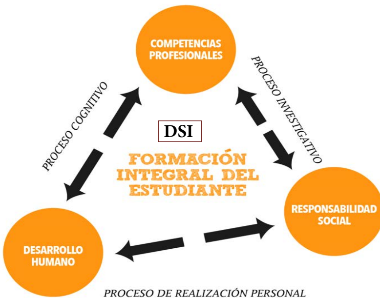
Figura 4. DSI como detonador de la formación universitaria.