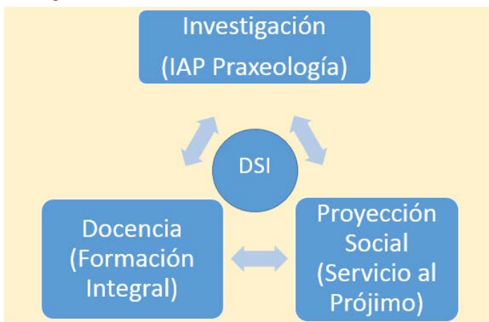
Figura 6. DSI como detonador de la sustantividad universitaria.

La respuesta a lo anterior quizá también la encontremos en la figura 6, donde muy similar a la anterior, se incluye la DSI como detonador central de las funciones sustantivas y sus respectivas gestiones universitarias.