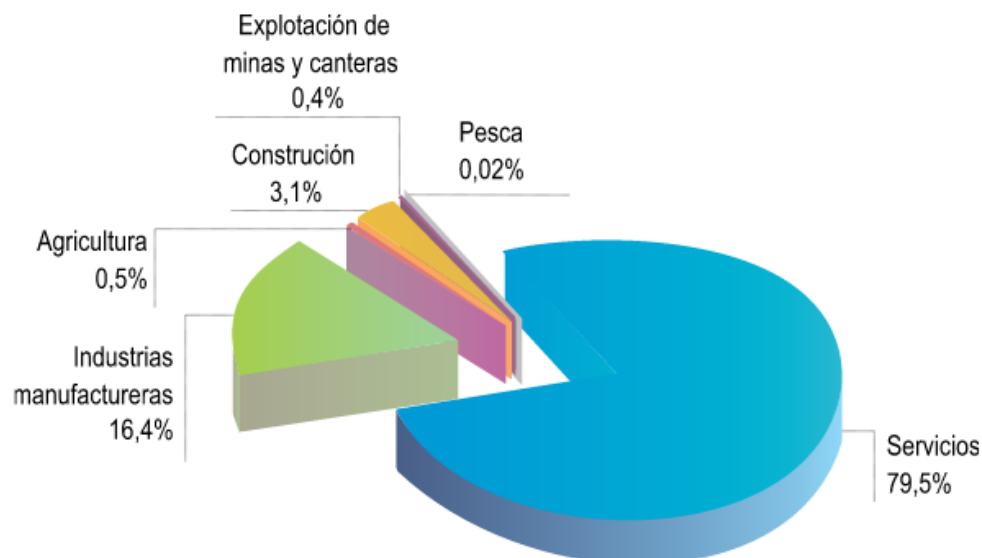
Figura 6. Distribución de las empresas por sector económico

Fuente de consulta. Datos expresados en unidades. (Camara de Comercio de Bogotá, 2006)