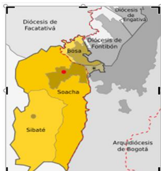
Figura 2. Mapa de la Provincia de Soacha-Sibate

Sólo dos municipios conforman la Provincia