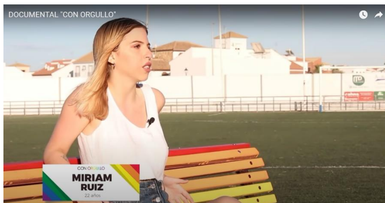
Ilustración 1 ser parte de la población debe mostrarse “Con orgullo”.

Un documental con varios testimonios en el cual dan a conocer su proceso en el cual han sentido libertad por su orientación sexual y expresión de género que conllevan en el entorno Sevillano.