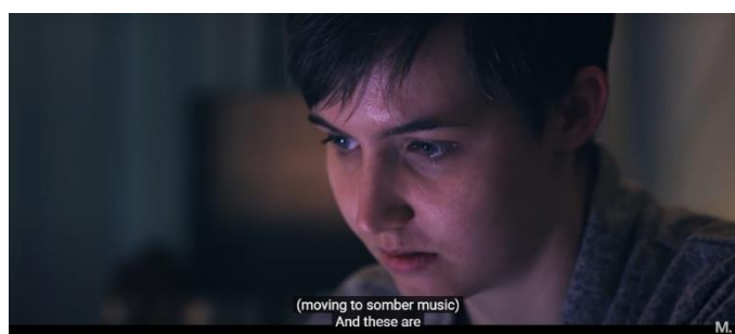
Ilustración 4 “discriminación por identidades de género”

Un cortometraje basado en la vida de un chico trans en sus comienzos de tránsito. El cortometraje uno de sus mayores enfoques son los tonos cálidos y trata de reflejar una estética que genere una buena aceptación de público con respecto a la calidad de imagen, también hay planos detalles como plano americano, plano entero y detalles.