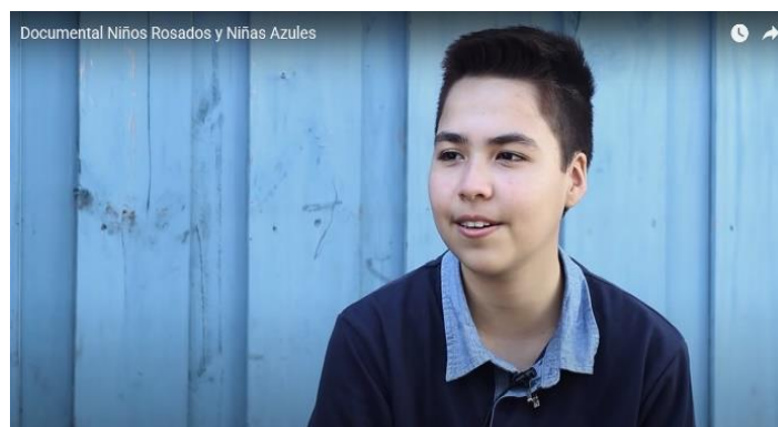
Ilustración 3 “Niñez diversa”

Un documental basado en las experiencias trans de niños y niñas, además su entorno social. Todo a través de narraciones evidenciando esa metamorfosis contada con apoyo filmográficos de sus cotidianidades.