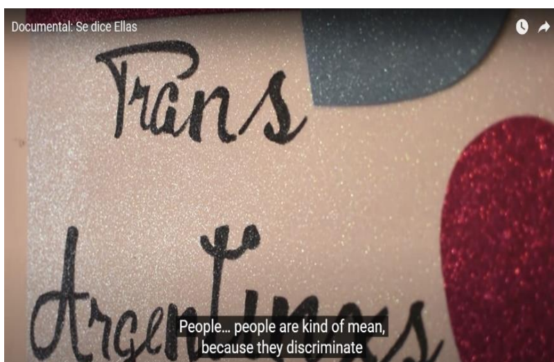
Ilustración 2 Se dice Ellas

Un documental que muestra el diario vivir de una niña trans y dos mujeres trans que viven en Villa María en España, aquí el documental se basa más tipo entrevista y sus tomas muchas veces radican en primeros planos.