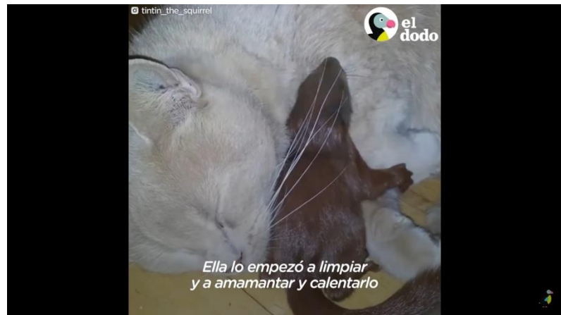
Ilustración 1 Ardilla fue salvada tras caer del techo.

Un micro-documental que evidencia una ardilla que tuvo un proceso de rescate y ha sobrevivido ante ello. Una narrativa que logra mostrar esos vínculos de inter-especies y nuevos estilos de familia.