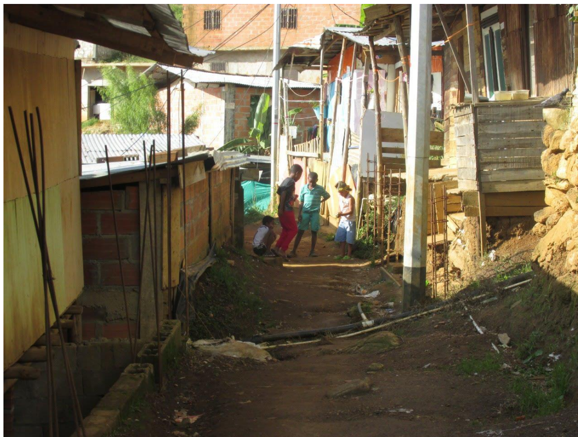
Fotografía 6 Niños jugando en medio de las calles del barrio Manantiales