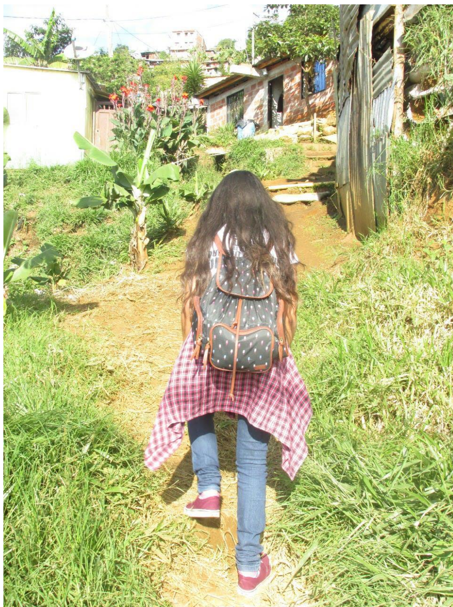
Fotografía 5 Primer visita al barrio, caminando por todo el sector reconociéndolo.