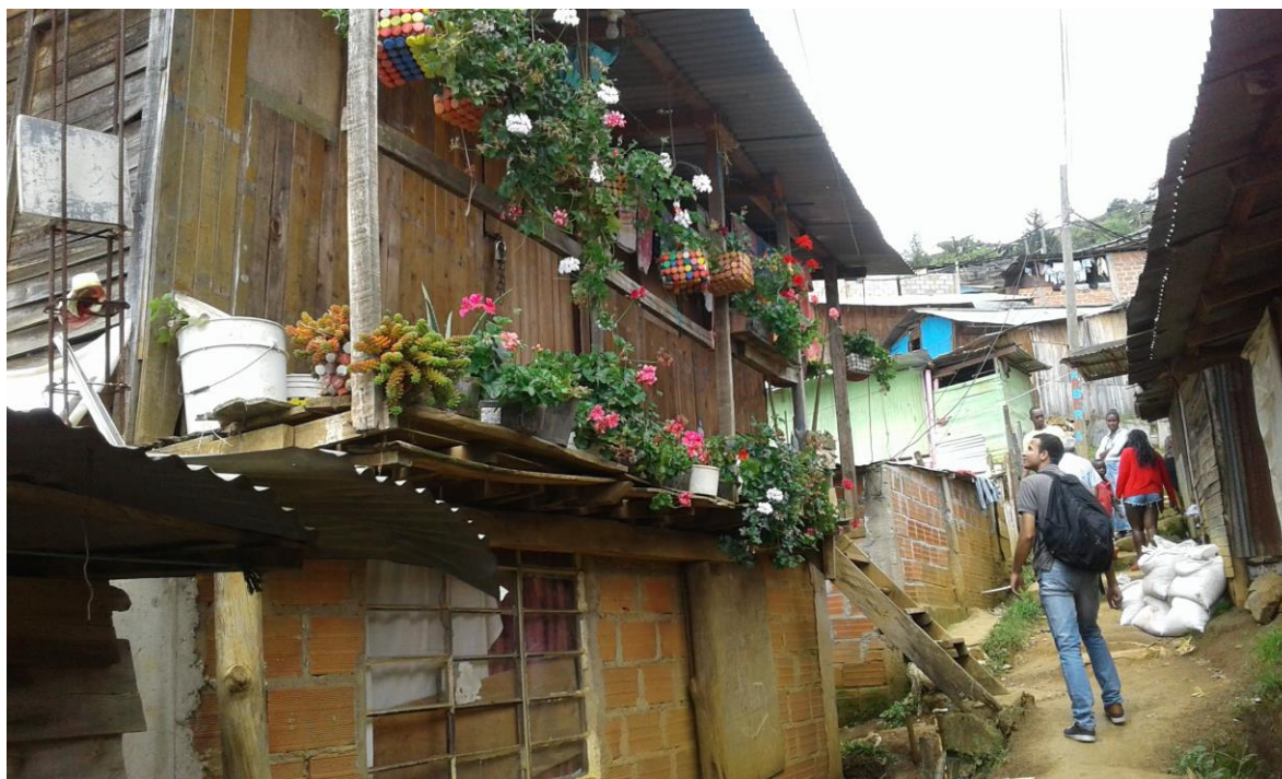
Fotografía 3 Casa esperanzadora en el barrio Manantiales