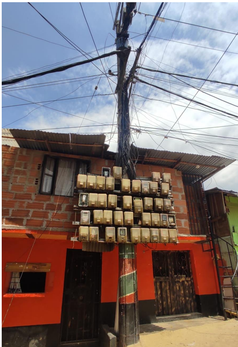
Fotografía 8 Poste y cableado de luz.