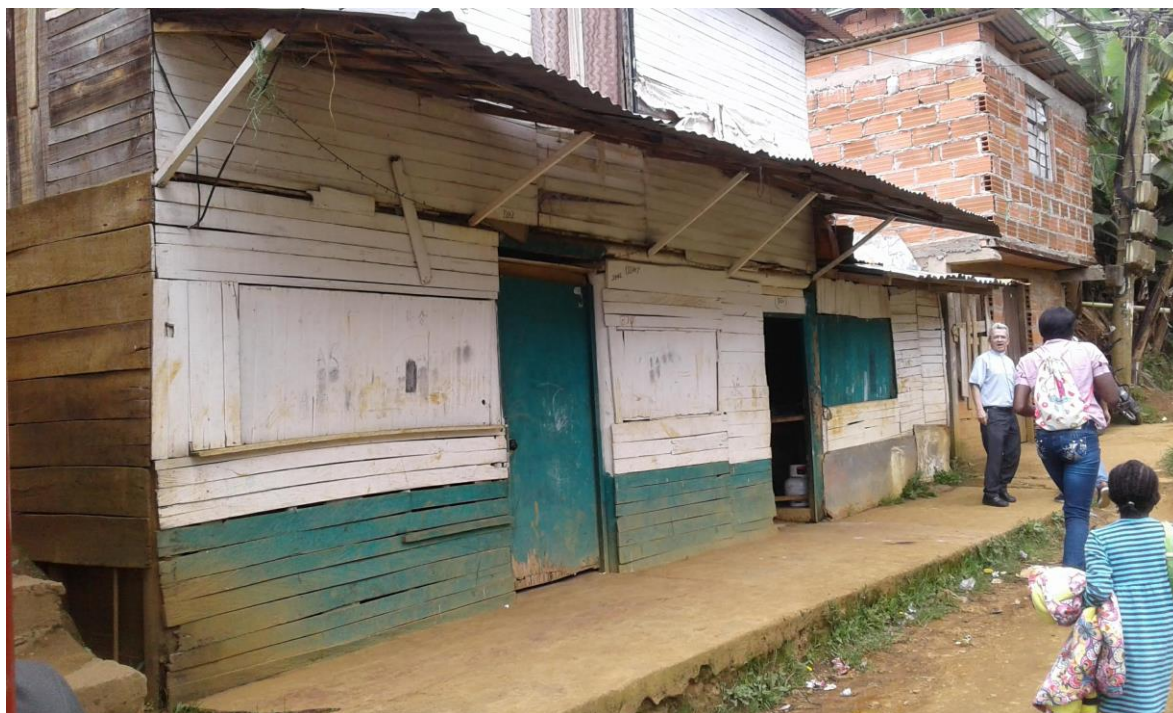
Fotografía 9 Representación del material de las casas del barrio Manantiales.