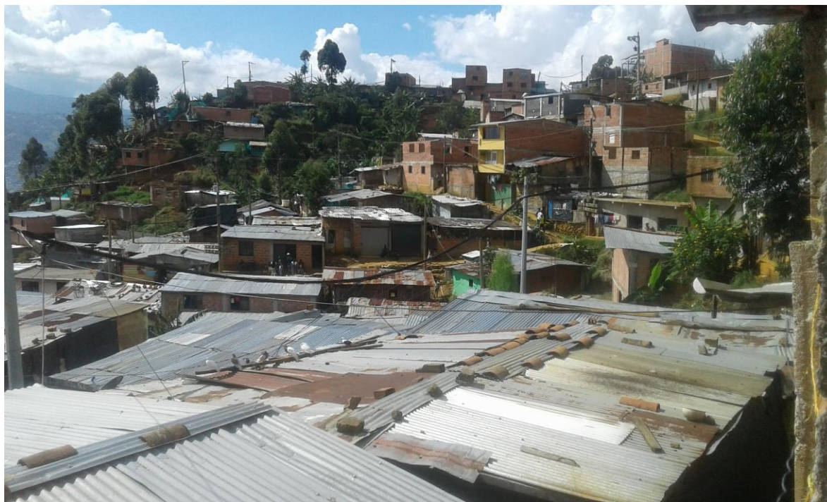
Fotografía 4 Vista del barrio Manantiales desde la casa de un habitante del sector.