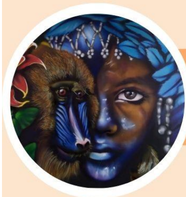
SELVÁTICO, SERIE SER, FAUNA Y FLORA Esteban Cadavid / Arte Vital

La pintura de caballete condiciona la imagen a su estructura bidimensional. El mural nos ofrece un espacio más complejo, multidimensional y polisémico. Muro, espacio y obra forman parte y condicionan un solo discurso estético, en donde los códigos morfológicos y cromáticos normalmente se concilian. El mural ha tenido que adaptarse a un espacio ajeno, ya construido y predeterminado.