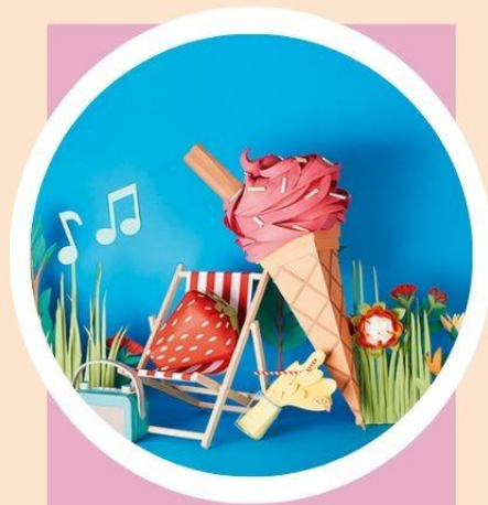
THE PARK Andy Singleton