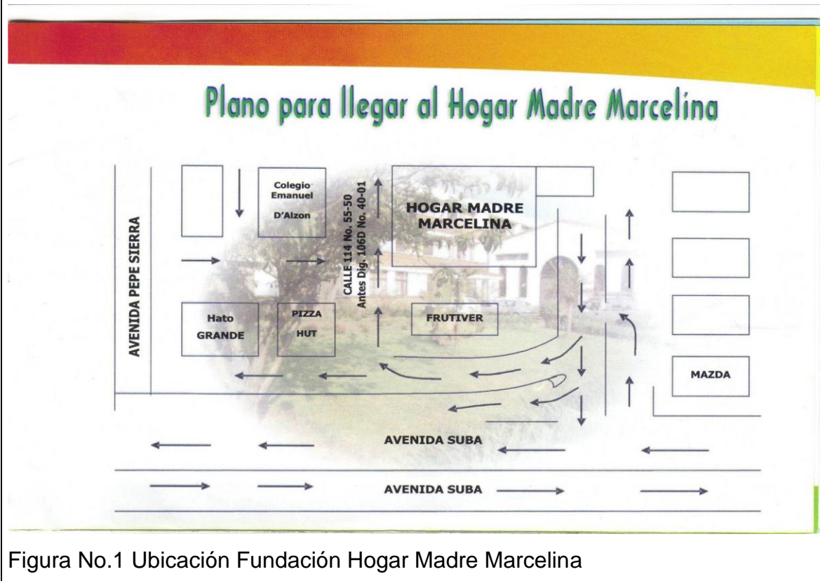
Figura No.1 Ubicación Fundación Hogar Madre Marcelina

El lugar donde se ejecutará el proyecto queda ubicado dentro de la localidad de 11 (Suba) Bogotá, Colombia; Hogar Madre Marcelina, dirección: Calle 114 No 55– 50.