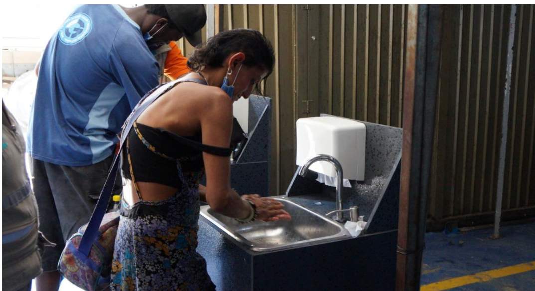
Gráfico 9. Nueva atención Básica