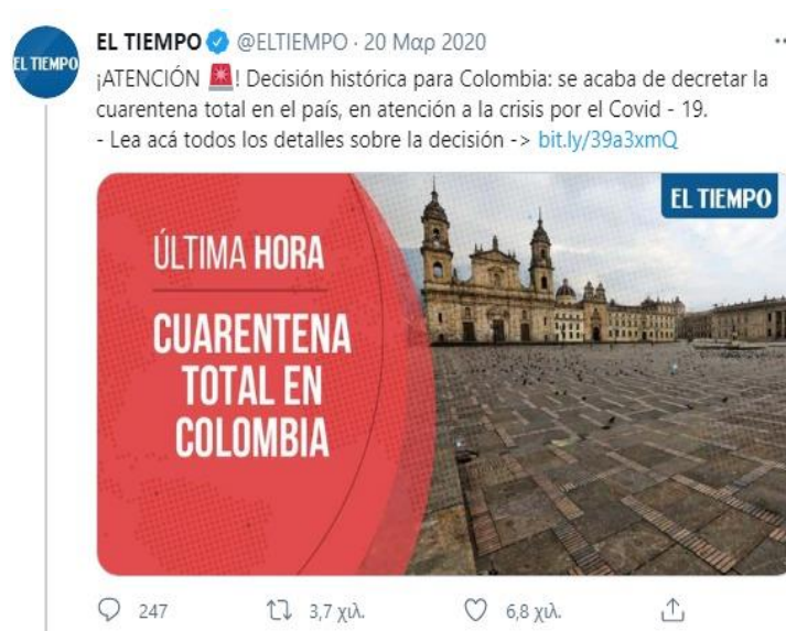
Gráfico 6. Anuncio de cuarentena en Colombia

El año 2020 llegó con la sorpresiva noticia de que, en China desde finales, del año 2019, había un brote en las personas, hasta ese entonces, desconocido y luego definido como Coronavirus COVID-19. Se sabía que era un virus con síntomas de gripa muy fuertes y el más relevante de estos es la falta de respiración. Al aumentar los casos positivos de COVID-19, se pudo determinar la gravedad del asunto y las consecuencias de este en el estado de salud de una persona. Los ciudadanos de todo el mundo empezaron a encontrarse con titulares como: