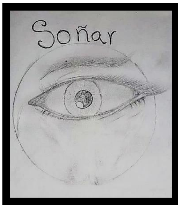
Figura 1. Representación de ser joven. Grupo focal, estudiante 2 (2020)

La categoría descriptiva del significado de ser joven para los estudiantes, se identificó a partir de lo abordado en el grupo focal con los líderes estudiantiles, donde cada uno compartió su percepción de lo que para ellos es ser joven.