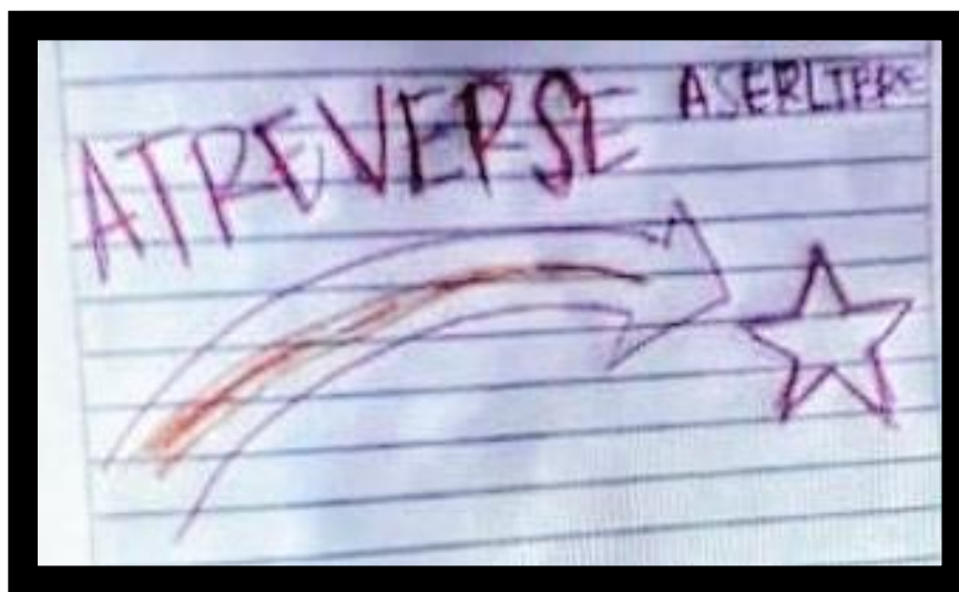
Figura 2. Representación de ser joven. Grupo focal, estudiante 1 (2020)

Así lo representa una de las líderes estudiantiles frente al “ser joven”: