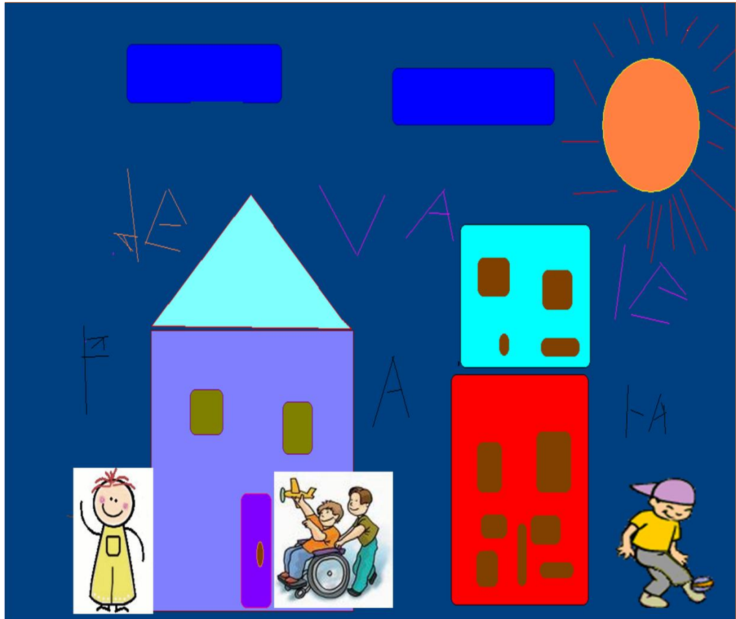
Ilustración de Fondo: Valentina Savedra Suanca. (6 años) 2007