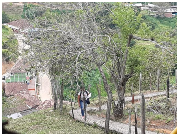
Ilustración 6. Camino a la escuela rural