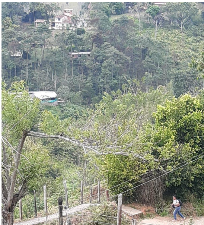
Ilustración 5. Vereda Popalito

Se les agradecerá por la participación activa en el encuentro, ya que todas las opiniones son importantes y de gran ayuda para el proyecto investigativo. Se les obsequiara un dulce como agradecimiento por su gran ayuda.