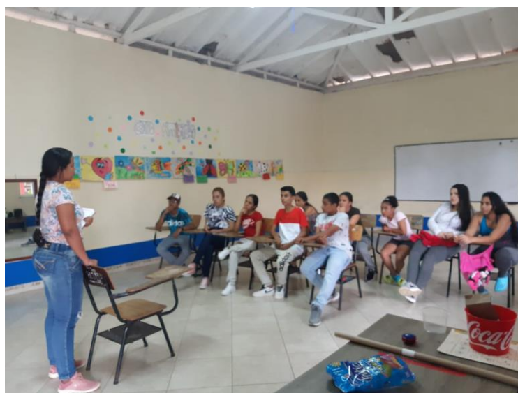
Ilustración 1. Grupo focal