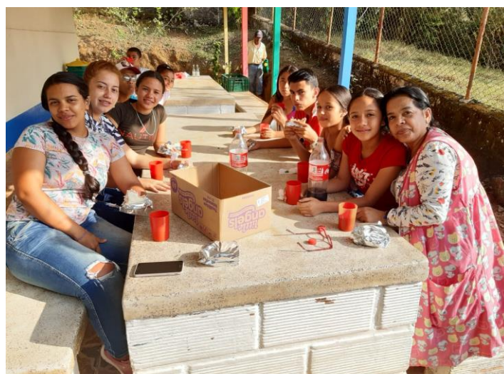
Ilustración 2. Compartir