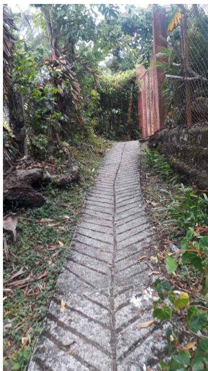
Ilustración 3. Ingreso a la escuela rural Popalito