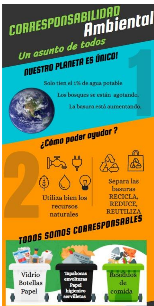
Ilustración 3 Infografía compartida a los padres de familia de la I.E.