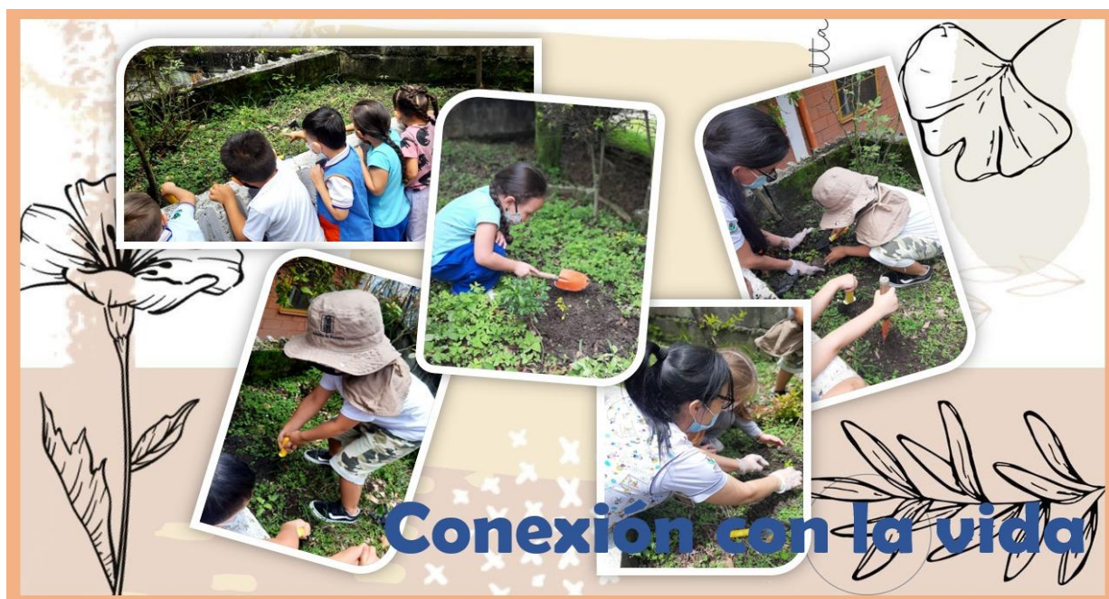
Ilustración 5 Inicio de actividad de preparación de la huerta escolar.