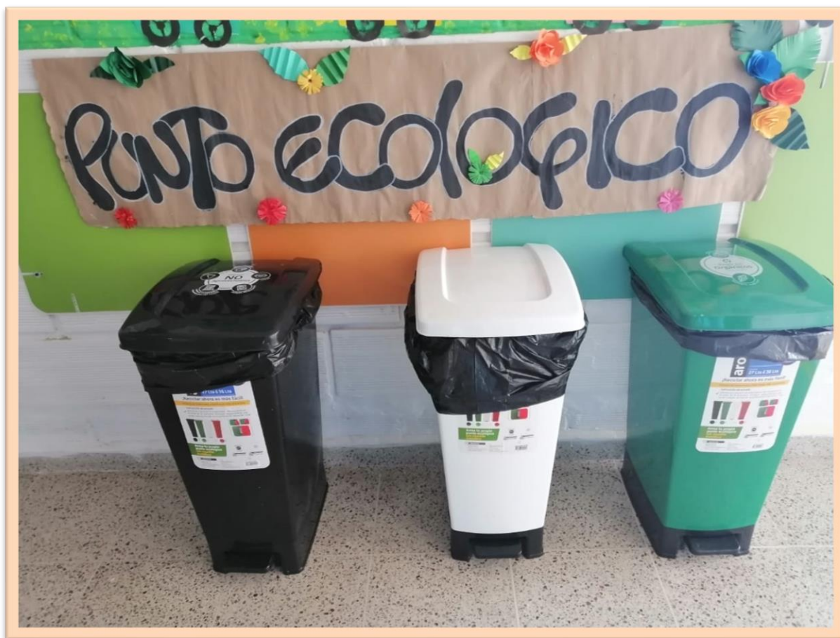
Ilustración 4 Actividad de identificación de los colores y recipientes de los residuos.