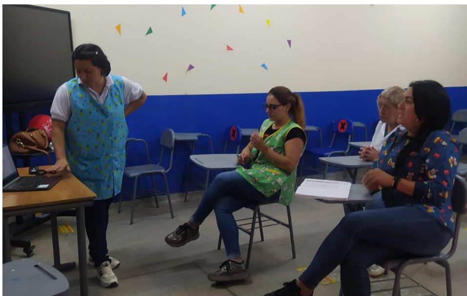
Ilustración 2 Socialización del proyecto con docentes.