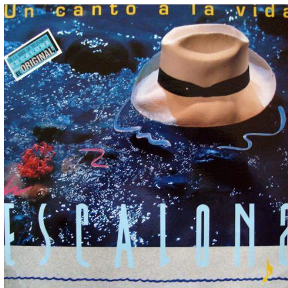
Ilustración 6: Álbum caratula delantera, " Escalona: un canto a la vida" (s.f)

La imagen muestra la parte delantera del disco en acetato y que adicional formó parte de la implementación de la serie Colombia donde Carlos Vives representaba a Rafael.