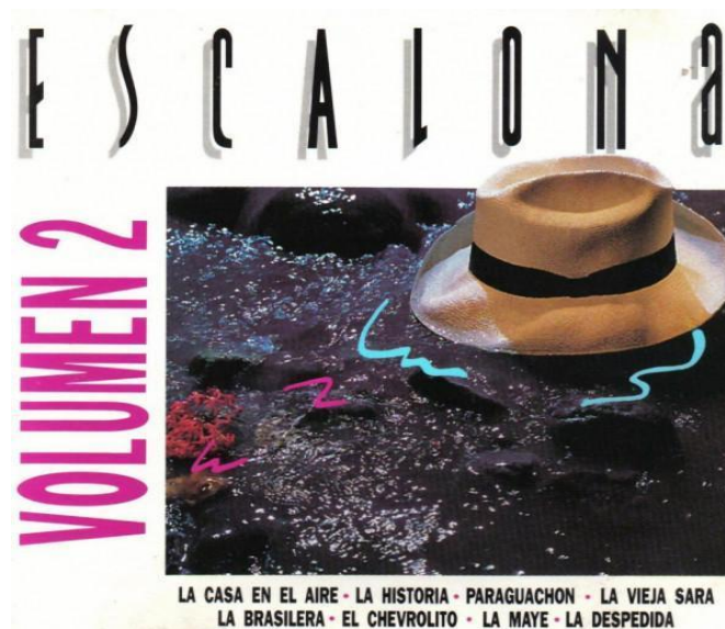
Ilustración 7: Álbum caratula delantera Escalona "volumen 2" (s.f).

Las letras de las canciones de Rafael Escalona entran en un punto de partida con Carlos Vives al emprender elementos modernos partiendo de una línea entre lo tradicional y moderno, implementando nuevos ritmos el cual abre caminos comerciales y establece un posicionamiento en la industria musical sin perder la esencia discursiva. La siguiente imagen fue el álbum en acetato grabado por Vives y la banda sonora que acompañaba la serie “Escalona” lanzada en 1992 y que contó con 13 canciones y una de ellas “Casa en el Aire” con mayor reconocimiento.