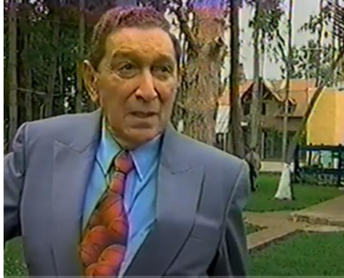
Ilustración 3: Fotografía tomada del documental Rafael Escalona (2019)

(Peñaranda Zequeda, 2019) confirmó que: “Escalona es el máximo exponente del llamando “vallenato costumbrista”, ese que describe las costumbres populares de una región, que, con el tiempo, se dio a conocer a punta de acordeón, caja y guacharaca” (p. 20). Es así como cada letra de Rafael Escalona presenta características clásicas o tradicionales en la sociedad folclórica de la región del caribe, no aprendió a tocar ningún instrumento y aun así logró el ritmo de sus letras sujetando melodías. La mayor parte de las líricas de las canciones fueron inspiradas en mujeres, Cada letra fueron narraciones de historias cotidianas, de personajes reales y de emociones vividas. La siguiente imagen fue tomada del portal Elvallenato.com donde narra la historia del compositor, sus inicios, estudios, fuentes inspiradoras para sus composiciones, viaje y parrandas musicales.