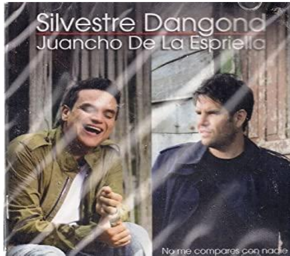
Ilustración 11: Álbum Silvestre Dangond - " No Me Compares Con Nadie " (2015).