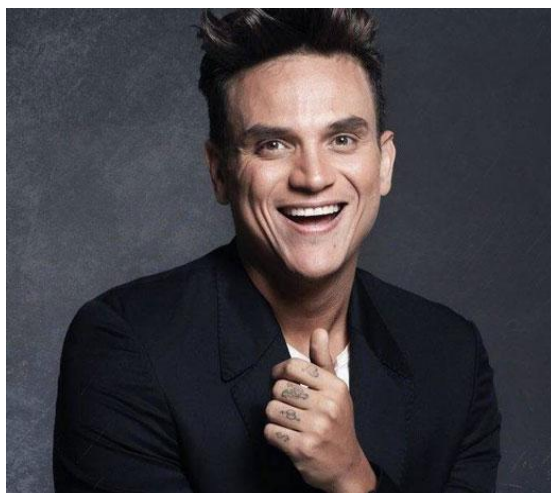
Ilustración 8: Biografía artista Silvestre Dangond (s.f).

Líricas de los juglares, un concepto modificado en el vallenato moderno