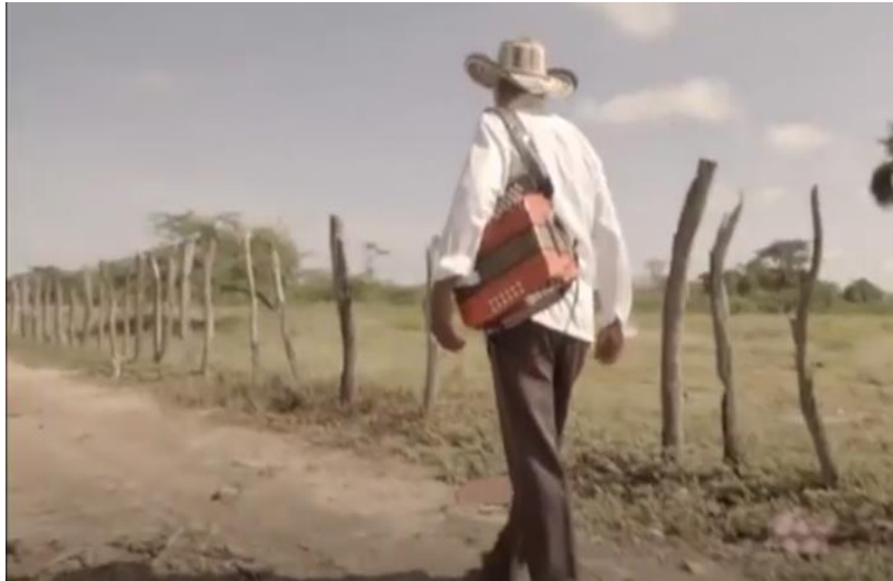
Ilustración 1: Fotografía tomada del documental, Raíces de la música vallenata. Los últimos juglares y el nuevo rey. I Parte (2018).

Al detenernos en los referentes, encontramos los documentales Raíces de la música vallenata. Los últimos juglares y el nuevo rey. I Parte (2018) y 'Pedazo de acordeón', un viaje a través de la historia del vallenato - Capítulo 1 - parte I (2019) allí se narra los inicios de vallenato en la región caribe colombiana en especial Valle de Upar que va desde Río Magdalena hasta el centro de la Guajira, Riohacha, los inicios de los primeros juglares, las primeras melodías acompañadas con el acordeón, y la evolución que fue presentando el género al implementar guacharacas y tambores; también, fue posible evidenciar las variaciones generadas en la narración y lírica desde la influencia del vallenato.