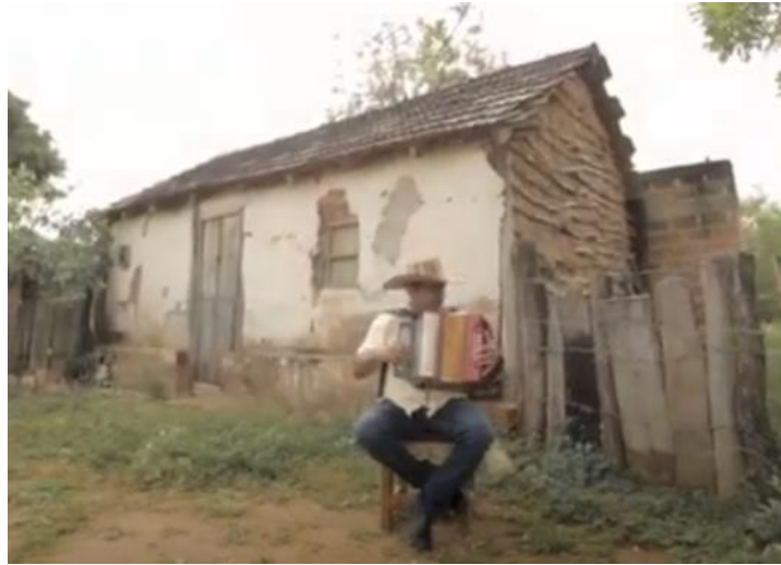
Ilustración 2: Fotografía tomada del documental y 'Pedazo de acordeón', un viaje a través de la historia del vallenato - Capítulo 1 - parte I (2019).

A continuación, se mostrarán dos fotografías de los referentes narrativos mencionados anteriormente donde la primera evidencia el proceso del juglar a ir de pueblo en pueblo con su acordeón colgado del hombro para cantar sus composiciones inspiradas en la zona rural del Caribe colombiano, la segunda imagen se observa como el acordeón es fundamental para darle el ritmo a cada letra de las canciones vallenatas.