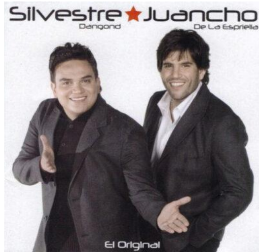
Ilustración 10: Álbum “ El Original ” de Silvestre Dangond y Juan Mario de la Espriella (s.f).

cumbia /Vallenato. En la imagen se muestra la parte delantera del CD donde el cantante y acordeonero se ven con expresiones alegres para determinar la originalidad de su álbum.