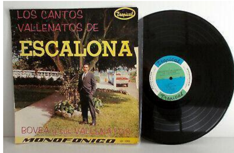
Ilustración 5: disco acetato "Los cantos vallenatos de Escalona, Bovea y sus vallenatos" (1955)

Las composiciones de Rafael Escalona en los años 70' comenzaron a clasificarse en la música popular al escucharse por diferentes pueblos de la provincia costeña, asimismo, al llevar un mensaje de la música de Escalona, se encontró que en los años 80' las letras comenzaron a grabarse por más artistas como Jorge Oñate, Elías Rosado y Juancho Rois y el grupo vallenato Binomio de Oro con Rafael Orozco e Israel Romero, en 1991 pasaron de un catálogo internacional y evolución al implementar nuevos arreglos de la mano de Carlos Vives y donde se ejerció la producción televisiva de la biografía de Escalona para impactar el mercado colombiano y conocer el proceso juglar e histórico. La novela fue protagonizada por Carlos Vives quien recrea la vida del cantautor colombiano y traza un impulso a sus canciones en el mercado discográfico y conciertos de América y Europa; Carlos Vives y la banda sonora que acompañaba a la serie colombiana "Escalona" lanzan el primer álbum " Escalona: un canto a la vida " en 1991 que se convirtió en un éxito al grabar las canciones del compositor.