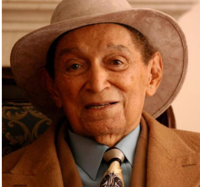
Ilustración 4: Biografía de Rafael Escalona (s.f)