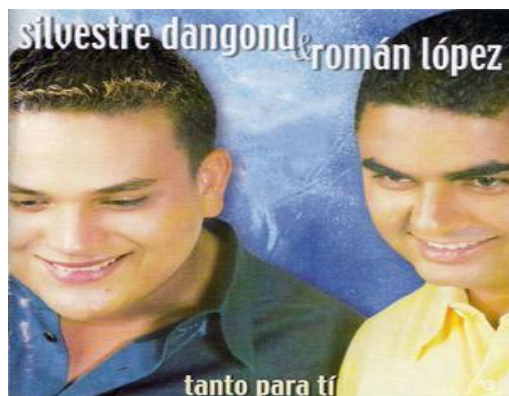
Ilustración 9: Álbum caratula frontal Tanto Para Ti de Silvestre Dangond (2002)

Silvestre ha logrado innovar el vallenato con un estilo propio y moderno y que sus letras han evolucionado mezclando con otros géneros musicales como Pop, Reggaetón o Tropical. Igualmente, se encontró la primera producción en el 2002 con el álbum “ Tanto para ti ” con el acordeonero Román López, grabado con la discografía Sony Music en su formato CD. La imagen muestra la parte delantera del álbum del CD con 12 canciones grabadas por el artista.