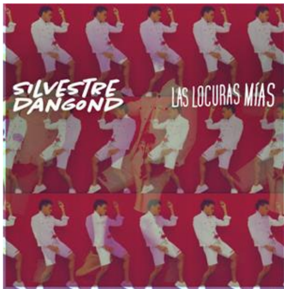
Ilustración 13: Álbum caratula frontal “Las Locuras Mías” de Silvestre Dangond (2020)

Líricas de los juglares, un concepto modificado en el vallenato moderno