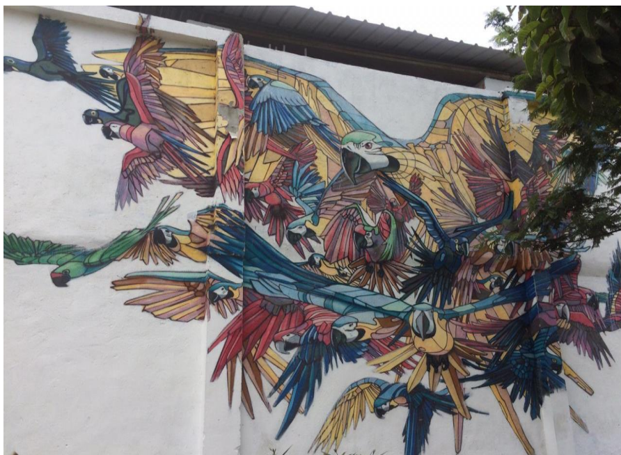
Figura 9. Grafitis entre la estación Buenos Aires y Miraflores, Aves Guacamaya Fotografía Digital, 2020. Elaboración propia

puro. Aun cuando fuera posible configurar una imagen enteramente, esta se uniría de inmediato al signo de la ingenuidad y se completaría con un tercer mensaje, simbólico. Las características del mensaje literal no pueden ser entonces sustanciales, sino tan sólo relacionales. (pág. Sp)