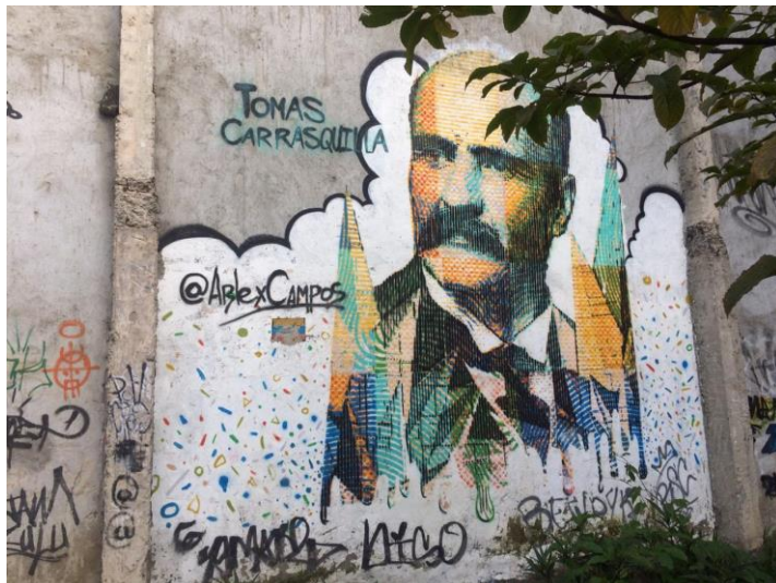
Figura 11. Rostro Tomas Carrasquilla, entre la estación Buenos Aires y Miraflores. Fotografía Digital, Elaboración propia.

Conociendo la intercesión de los grafitis y su desarrollo en el territorio, se despliega una construcción de memoria desde una evolución en la historia ayudando a las necesidades adaptadas con las posibilidades de demostrar y generar retentiva en los diferentes factores con un mismo fin colectivo. En la figura 11 , fácilmente se visualiza el rostro del escritor Antioqueño Tomás Carrasquilla, el cual hace alusión a los habitantes mostrando su rigidez y seriedad, así mismo, hace referencia al hombre trabajador debido a que en vida desempeño diferentes labores entre sastre, almacenista en una mina, escritor, entre otras. Esta obra inspira a la literatura no solo a los transeúntes, sino al personal que diariamente visita estos murales, debido a los diferentes géneros literarios abordados por Tomás, entre ellos novelas, crónicas, ensayos entre otras.