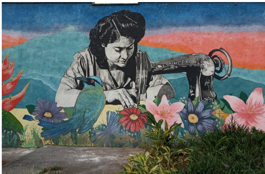
Figura 7. Graffiti mujer Cociendo, estación Bicentenario: Fotografía Digital ,2020. Elaboración Propia

Describir el contenido simbólico, técnicas, estéticas y temáticas que poseen los grafitis del corredor del tranvía, permite adoptar diferentes puntos de vistas con criterios diferentes, promoviendo la atención y cuidado de las personas que lo rodea. Por tal razón los contenidos simbólicos de las intervenciones de arte urbano cuentan sucesos relevantes, retratando el pasado y el presente con personajes emblemáticos como la deportista “Mariana Pajón” “escritores” “una mujer cociendo” que aparentemente puede ser una campesina, por su peinado icónico, la flor de heliconia que la acompaña y la variedad de colores característicos que la simboliza.