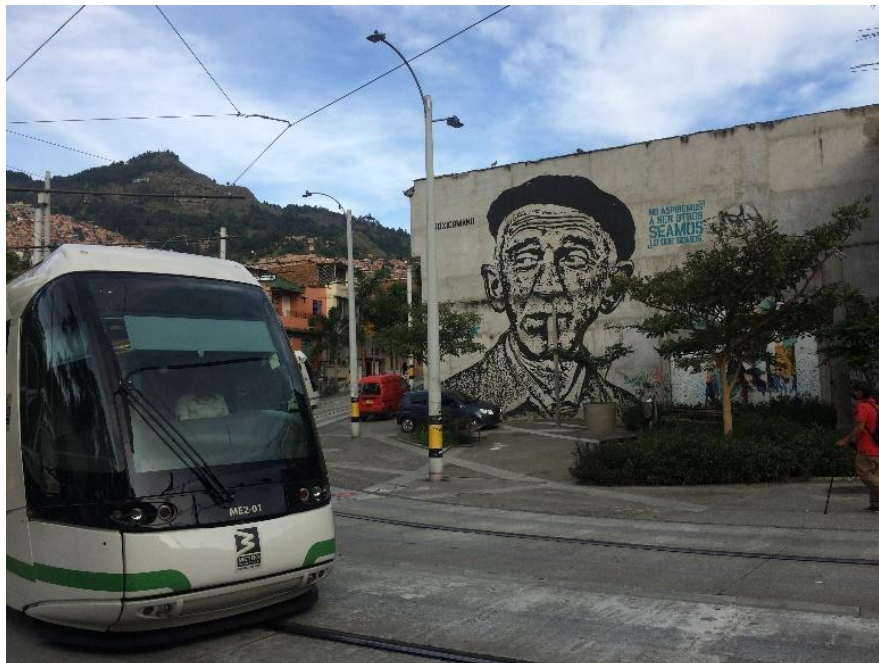
Figura 1. Rostro de Fernando Gonzáles entre las estaciones Buenos Aires y Miraflores.

Los mensajes encontrados en la figura 1 , son la relación que hay con el pasado y el presente, se observa el rostro del escritor y filósofo colombiano Fernando Gonzáles, el grafiti es a blanco y negro y fue realizado por el artista “Toxicómano”. Visualizando la transformación por la que ha pasado el barrio (Tranvía), sin dejar a un lado los aspectos ancestrales y las costumbres. Teniendo como fondos las viviendas que generan un territorio popular ubicados en la zona oriente de la ciudad, contando con espacios públicos adornados con murales representativos para la ciudadanía. El contexto histórico –social del territorio se ha presentado en un mundo imaginario creado a partir de los murales con que cuenta el barrio, también con referentes históricos que permiten hacer una relación pasado-presente, reflejada en casa uno de las anécdotas de los habitantes permitiendo hacer un análisis patrimonio sobre los sucesos relevantes del barrio Buenos Aires.