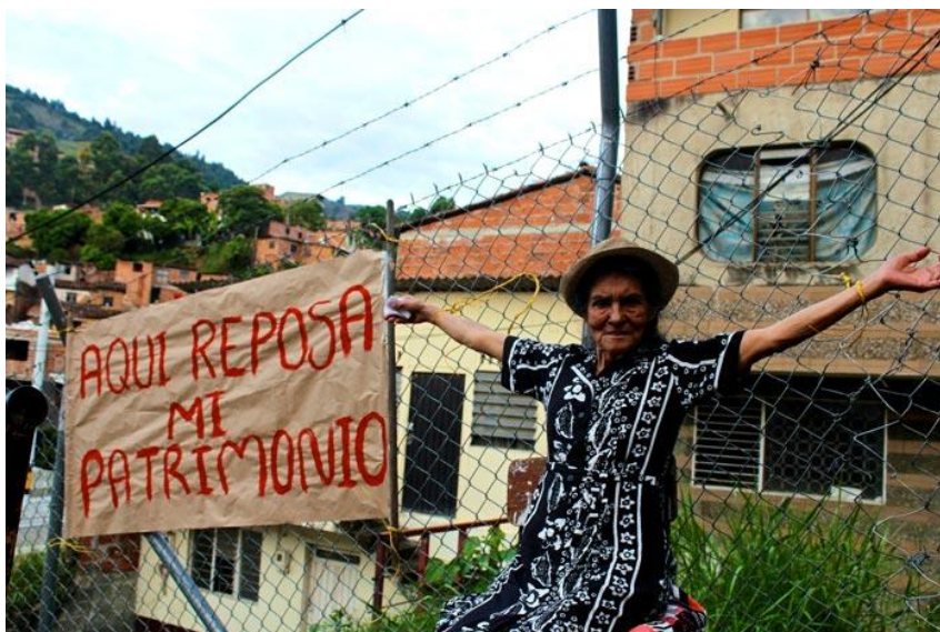
Figura 3. Habitante del Sector San Luis, Mostrando Resistencia. Fotografía Digital 2018, Sacada de Página Web Alianza en Medios Alternativos.

La figura 3 refleja una mujer atada de sus manos a una malla, el cual en su rostro muestra preocupación e indignación ante la situación por la que vivía sobre los problemas, teniendo una pancarta a su lado derecho, dando a entender que el lugar donde se encontraba amarrada era de su propiedad. Al no obtener respuestas positivas las 27 familias afectadas tuvieron que buscar acceder a una indemnización para poder obtener una nueva vivienda propia.