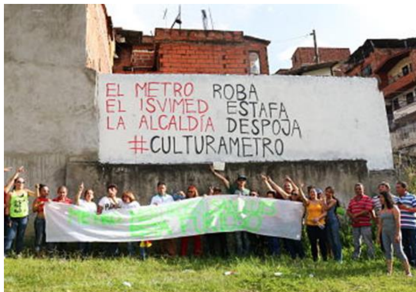
Figura 2. Habitantes del Barrio Buenos Aires, sector San Luis. Fotografía Digital 2019, Sacada de las 2orillas.

Las transformaciones realizadas llevaron consigo inconformidades por parte de varias familias, obteniendo varias expectativas desarrolladas a través de gestiones, de acuerdo al incumplimiento de los parámetros requeridos en el proyecto. Se desataron diferentes maneras de llamar la atención, no solo de los ciudadanos transeúntes, sino también la de las autoridades competentes en este proceso. Realizando diferentes acciones llamativas que cautivaran la visualmente la situación por la que pasaban los ciudadanos.