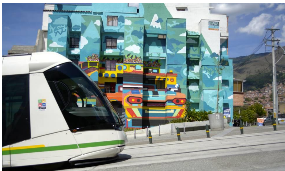
Figura 4. Grafitis de una chiva, en la Estación Buenos Aires. Fotografía digital 2017, Sacada del Periódico el País.

Como la intervención del entrevistado 1 hay muchos más con los que se puede generar una comparación, y crear perspectivas diferentes logrando la construcción de memoria histórica desde varias miradas críticas. Actualmente, aproximadamente más de mil ciudadanos han sido beneficiados por el tranvía de Ayacucho, no solo por su movilidad y comercio, sino también por el turismo incrementando a raíz de diferentes artefactos comunicativos que ayudan a embellecer y representar distintas evocaciones.