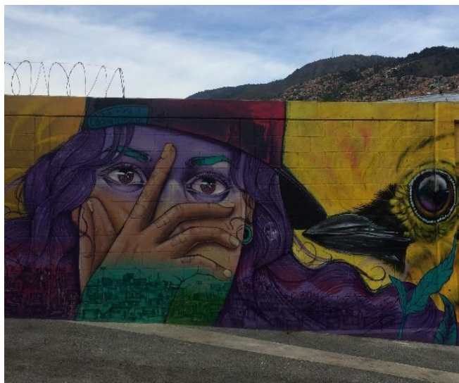
Figura 10. Grafiti estación Buenos Aires, rostro de una mujer. Fotografía digital 2020. Elaboración Propia

Las obras de arte urbano se han insertado en la cultura como un intervencionismo territorio que pretende construir significados asociados a la cultura y vinculados con procesos de resistencia que construyen memoria histórica e identidad.