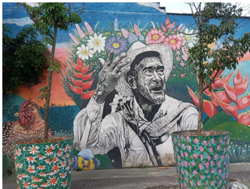
Figura 8. Grafitis de un Silletero, Estación Bicentenario. Fotografía Digital 2020, Elaboración propia.

En la figura 8 se observa un adulto mayor vestido de forma clásica, usando como distintivo un “poncho” en su cuello y una “mochila” en su cuerpo, los cuales hacen parte de su tradición y cultura; también brinda una espectacular sonrisa, mientras lleva en su espalda una silleta de flores margaritas, helechos, heliconia, entre otras, visualizando también una ave doméstica conocida como gallo, habitada con frecuencia en los hogares campesinos, haciendo alusión al campo, al igual que las diferentes formas de las montañas que adornan el mural. Los colores hacen alusión a los atardeceros, convirtiéndose en elementos claves presentados como técnicas orientadas al fortalecimiento de la identidad y con ello, la construcción de memoria en el territorio. Permitiendo desarrollar significados que, de acuerdo con la semiología de la imagen, estas intervenciones puedan generar mensajes inmediatos, como lo describe (Barthes, 1964)