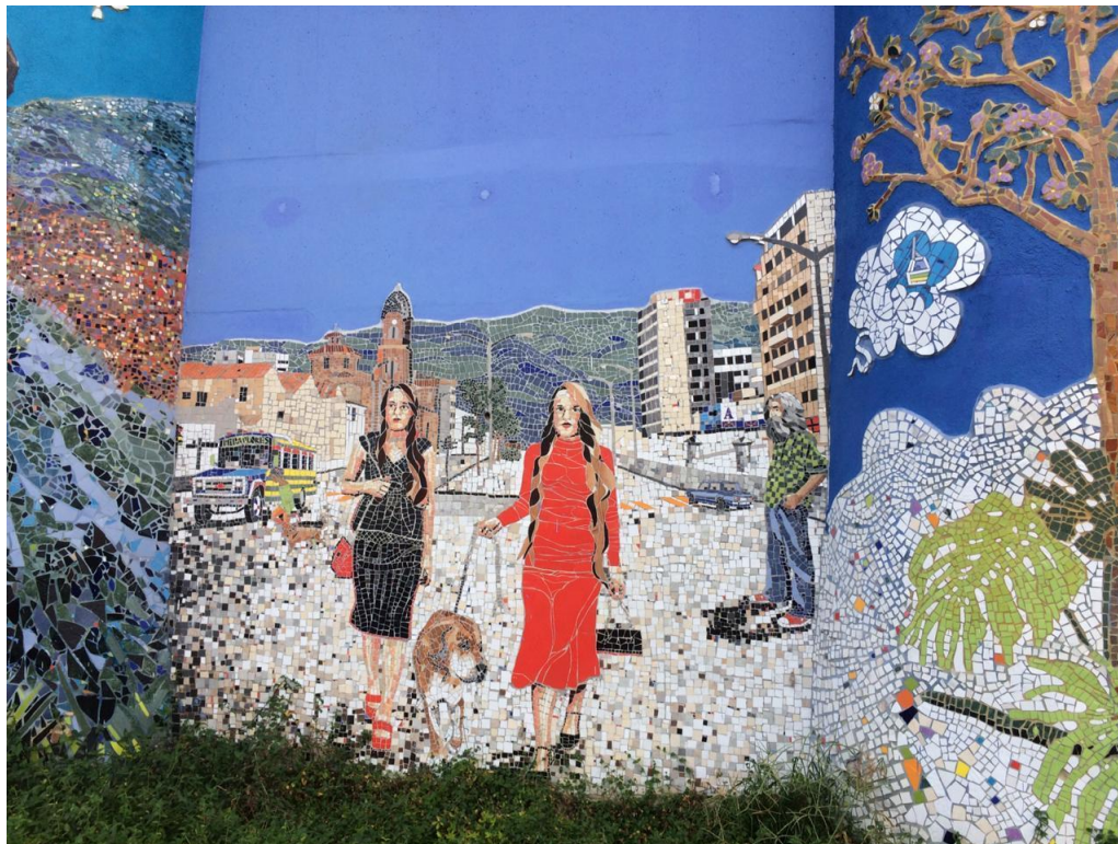
Figura 6. Grafitis en la estación Miraflores, Evolución del transporte en Medellín, Fotografía Digital 2020, Elaboración propia.

Implementar estrategias de construcción de memoria histórica a partir del desarrollo de identidad en el territorio, ayuda a reflexionar sobre la labor de la retentiva, teniendo como enfoque principal los aportes que se ven reflejados por los diferentes murales artísticos, buscando mostrar la perspectiva de una sociedad, implicando ejercicios de análisis considerado como una cobertura social y territorial.