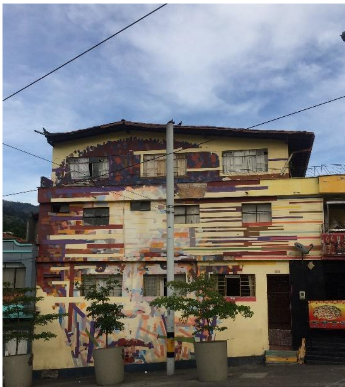
Figura 5: Grafiti en la Estación Buenos Aires, Casa de Blanca Escobar, Rostro de Belarmina Rojas, Fotografía Digital, Elaboración Propia.

del sector en relación con las dinámicas sociales, económicas y un cambio visual desde los diferentes murales artísticos.