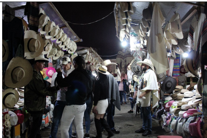
Imagen registro de campo # 5

La fundación tiene un catálogo amplio de productos, sin embargo Doña María afirma que el más pedido es el sombrero por su calidad y su reconocimiento. Me habló también sobre las