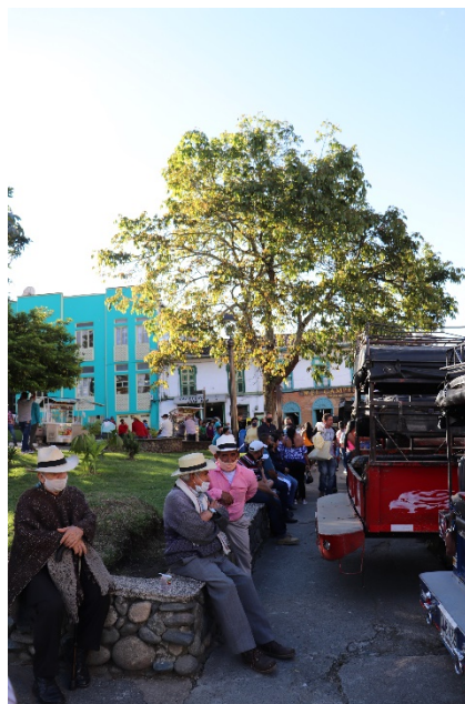
Imagen registro de campo # 9 – Autoría de: Maria Fernanda Nieto Vargas