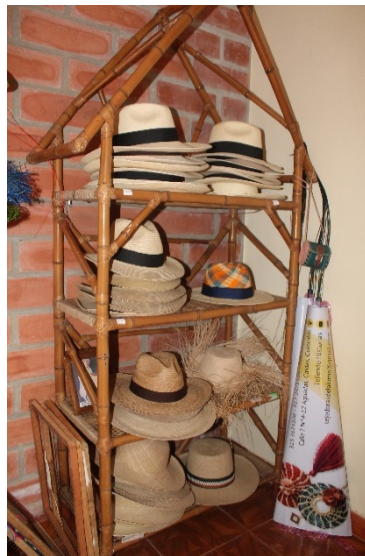
Imagen registro de campo # 8 – Autoría de: Maria Fernanda Nieto Vargas