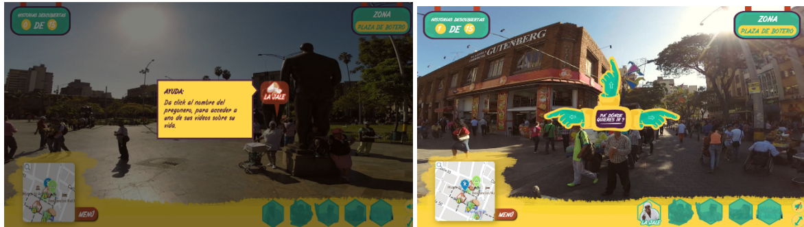
Imagen # 21, 22