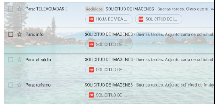
Imagen registro de campo # 12