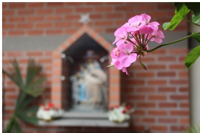
Imagen registro de campo # 6 – Autoría de: Maria Fernanda Nieto Vargas