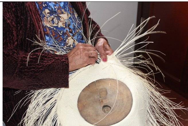
Imagen registro de campo # 2

En el parque principal del pueblo se podía observar una feria de ventas de artesanías y comida al lado de la tarima del show principal durante el fin de semana. En la feria se lograba ver que algunas tejedoras y sus familiares exhibían su puesto con todos los productos artesanales tejidos con Iraca y como principal atractivo, por supuesto estaba el sombrero aguadeño. Tanto locales como visitantes se acercaban a las chozas repletas de productos para averiguar precios y comprarlos como regalos o adquisiciones propias.