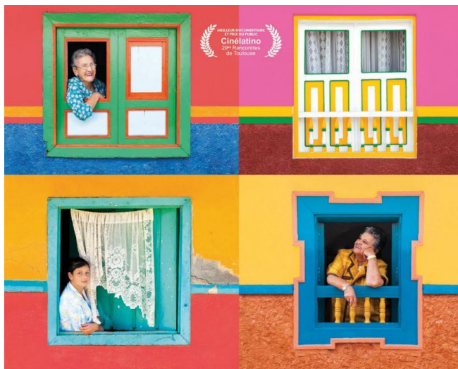
Imagen # 14