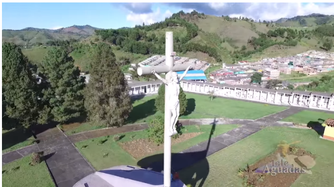
Imagen # 15