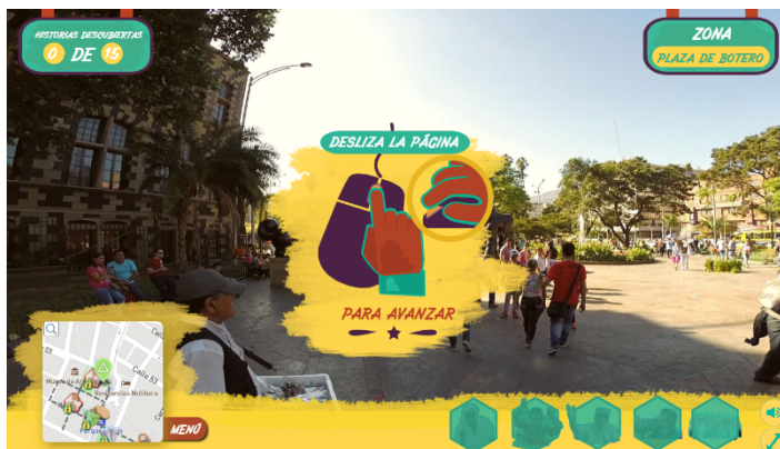
Imagen # 13