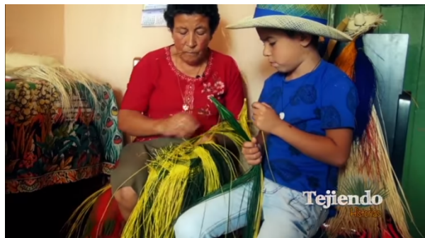
Imagen # 17, 18, 19, 20