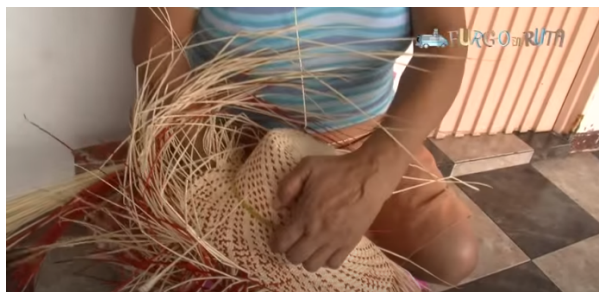
Imagen # 2