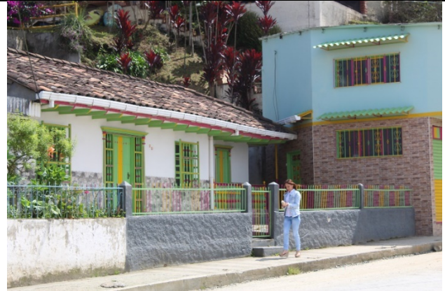
Imagen registro de campo # 10 – Autoría de: Maria Fernanda Nieto Vargas

Se escribió a organizaciones como la Alcaldía de Aguadas, la Secretaría de Turismo de Aguadas, la organización Palmato, la red distribuidora más grande de sombreros aguadeños, la Corporación Tejedoras Virgen de la Loma y a Teleaguadas, el canal oficial del municipio.