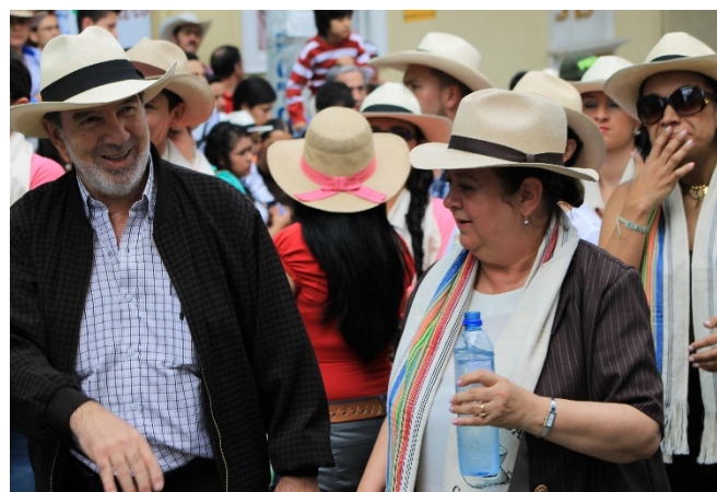
Imagen registro de campo # 4