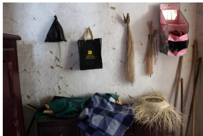
Imagen registro de campo # 3