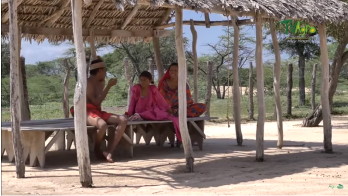
Imagen # 4