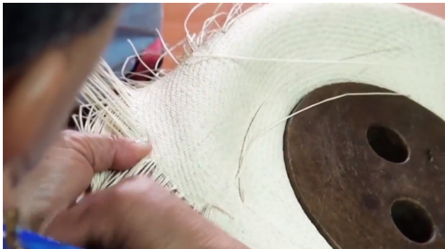
Imagen # 16