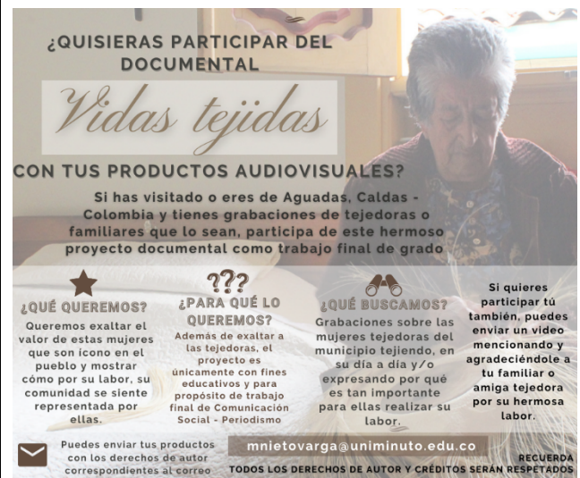
Imagen registro de campo # 11