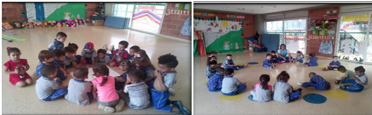
Imagen 1. Evidencias actividad 1: caja viajera