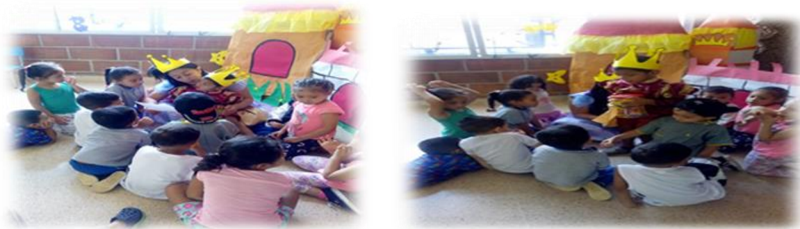
Imagen 7. Evidencia Actividad 7: el principe de los abrazos