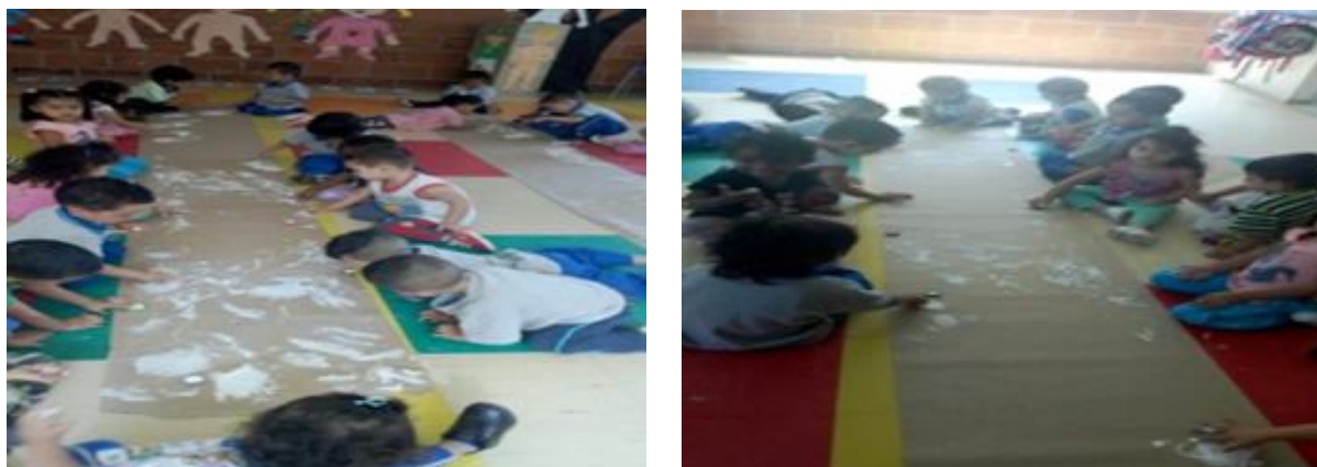
Imagen 2. Evidencia actividad 2: las voces de los niños- mural.

Evaluación: todos los niños participaron, algunos decían que no sabían dibujar, otros que no se querían ensuciar la ropa, pero al finalizar todos les dieron nombre a sus trazos y crearon un personaje producto de su imaginación.