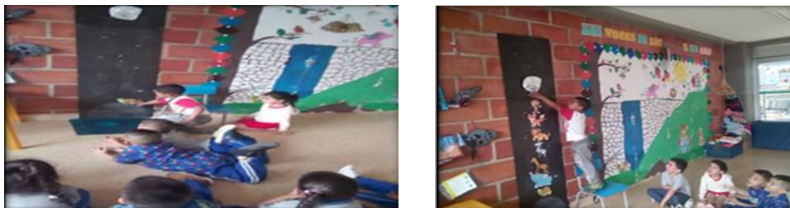
Imagen 8. Evidencia Actividad 8: cuento ah que sabe la luna

Evaluación: Esta actividad dejó una gran enseñanza a todos ya que en este cuento hubo varios factores el trabajo en equipo que siempre lo debemos hacer ya que cada uno de nosotros tiene diferentes cualidades que debemos poner al servicio de quien lo necesite para así lograr buenos resultados esto nos enseña el valor de la solidaridad, los niños disfrutaron mucho de esta actividad.