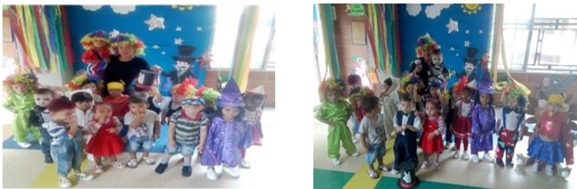
Imagen 3 Evidencia Actividad 3: lectura animada simulando el circo

Evaluacion: todos los niños eligieron libremente que usar para presentar su show, incluso los mas timidos participaron y bailaron frente a sus compañeros, la actividad fue de gran agrado para todos.