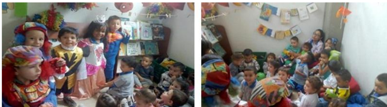
Imagen 6. Evidencia Actividad 6: super héroes y princesas

Evaluación: los niños se mostraron participativos en todo momento, actuaban como super heroes y princesas de verdad, cuidaban a los mas pequeños diciendo que iban a salvarlos, se pudo observar como esta actividad los motiva a cumplir con normas y deberes que se practican en el aula.