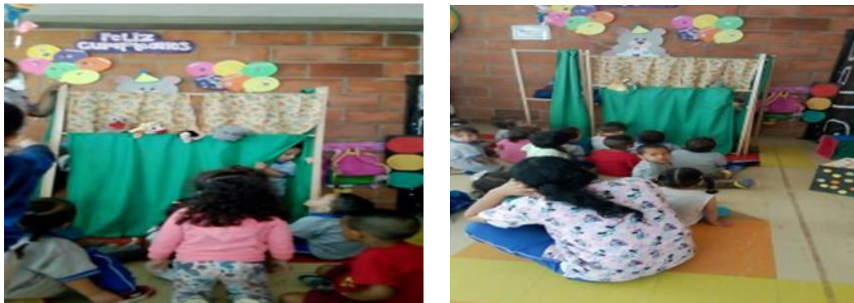
Imagen 4. Evidencia actividad 4: los tres lobitos y el cerdito feroz

escucharon e hicieron muchas preguntas a los lobitos y al cerdito le dijeron que no fuera feroz con los lobitos, luego tuvieron la oportunidad de jugar con los titeres.