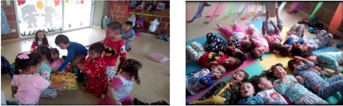
Imagen 10. Evidencia Actividad 10: cuento tipo radial y pijamada.