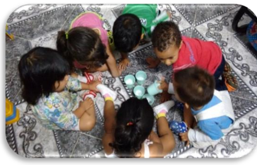
Aprendiendo a ser responsables Creación propia Figura 6