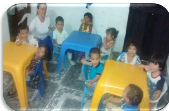
Normas en el Comedor Figura 16