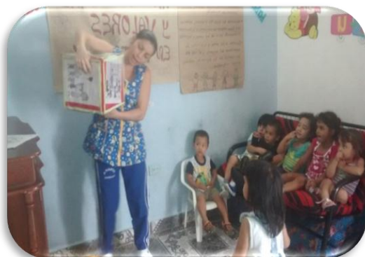
El Dado Preguntón Creación propia Figura 9