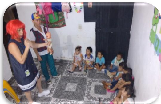
Los Valores en la Familia Creación propia Figura 13