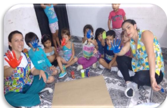
Elaboración manual de convivencia Creación propia Figura 3