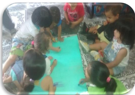
Expresemos nuestras Emociones Creación propia Figura 11