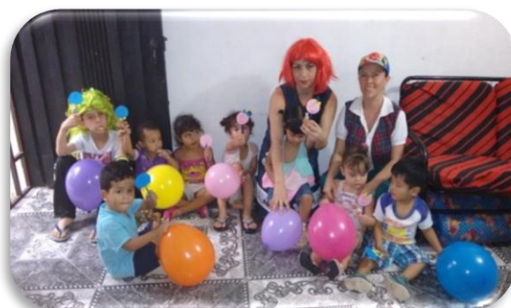
Los Valores en la Familia Creación propia Figura 14