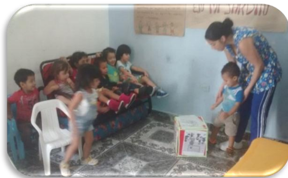
El Dado Preguntón Creación propia Figura 8