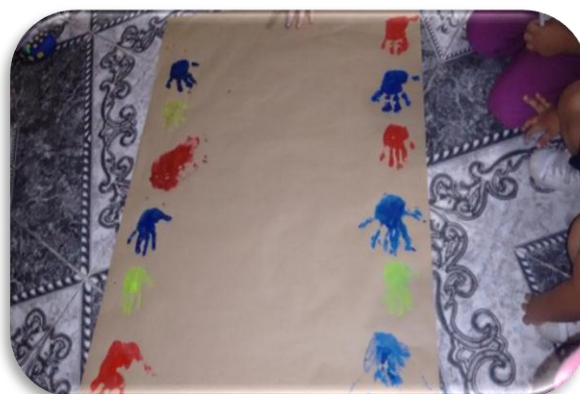
Elaboración manual de convivencia Creación propia Figura 2