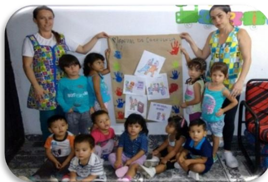
Elaboración manual de convivencia Creación propia Figura 4