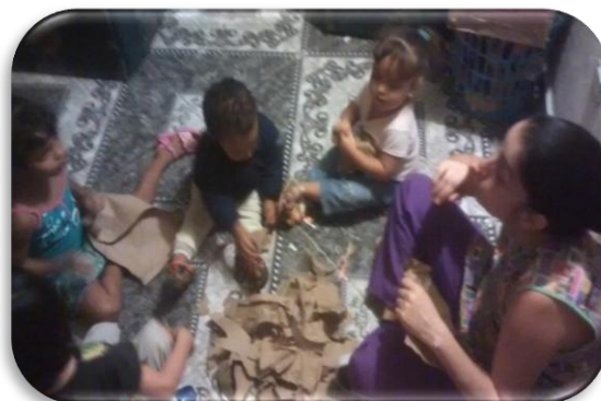
Liberemos nuestras Emociones Creación propia Figura 10