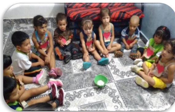
El Baúl de los Valores Creación propia Figura 12