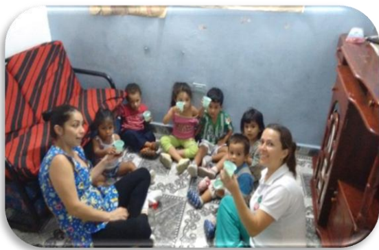
Aprendiendo a ser Responsables Creación propia Figura 7