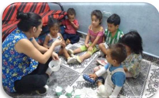
Aprendiendo a ser responsables Creación propia Figura 5