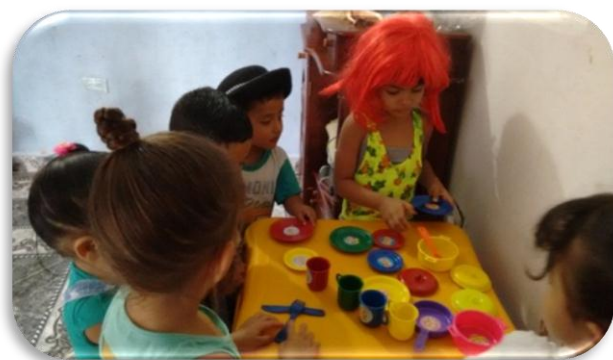
Imitando la Familia Figura 15