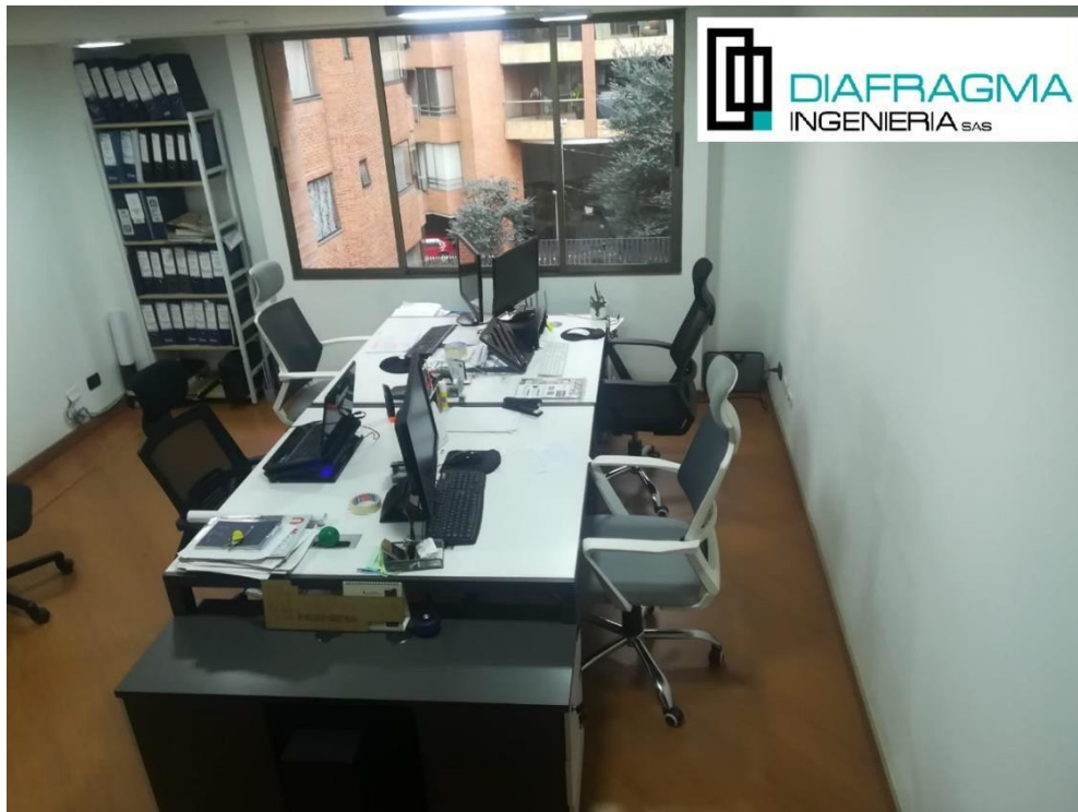
Figura 1. Oficinas administrativas de DIAFRAGMA INGENIERIA S.A.S

Desde su locación en la Calle 90 No. 18-53, en la ciudad de Bogotá D.C., Diafragma Ingeniería S.A.S. lidera sus proyectos y obras ejecutadas principalmente en la misma ciudad y en el altiplano cundiboyacense, sus ingenieros se centran en la solución de los requerimientos de distintos clientes sin importar su locación geográfica, esto los ha llevado también a aceptar trabajos en distintas ciudades de Colombia , tales como Tunja, Duitama, Sogamoso, Cali, Armenia y actualmente cuentan con propuestas para iniciar labores en otras ciudades, por lo tanto la compañía empieza a tener un campo de acción importante a nivel nacional.