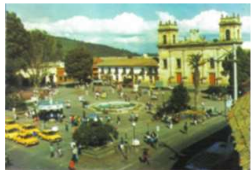
Ilustración 2 Plaza Simón Bolívar en los años 90.