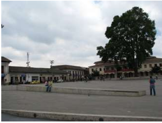
Ilustración 3 Plaza actual, elaboración propia.

La imagen 2 conecta con el diseño de la plaza de San José de Puerto Rico ¿Por qué? Porque aparecen otros elementos como los taxis, la fuente de agua, los árboles, los jardines encerrados y las sillas o escaños. Aquí era llamado parque de Facatativá y en la última imagen se ha convertido en la plaza Simón Bolívar.