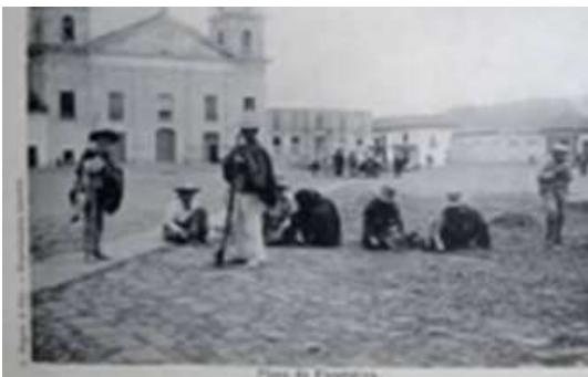
Ilustración 1 Plaza Simón Bolívar en el siglo XVI, archivo de la casa de la Cultura.

Setha Low describe una plaza con estilo colonial, con elementos como fuentes de agua, arboles, pisos adoquinados, tarimas o quioscos. Las figuras de poder son coincidentes en las dos plazas y los elementos del diseño, también.