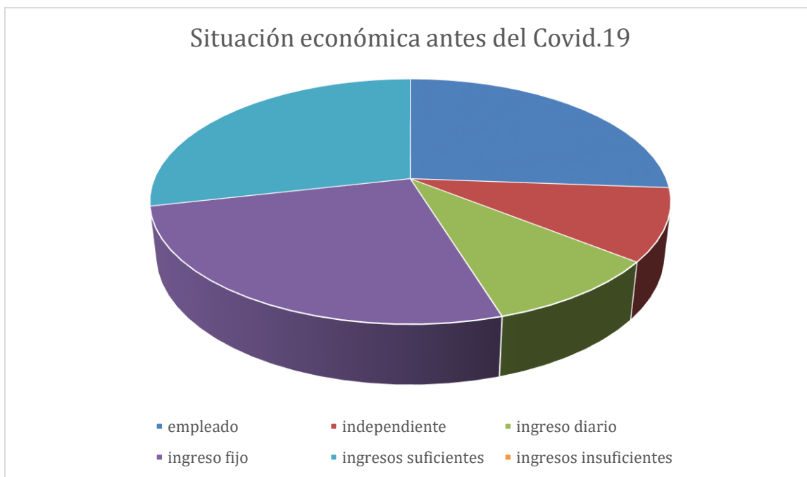
Figura 1 Situación económica antes del Covid.19

Donde la situación económica de las familias antes del aislamiento obligatorio a raíz de la pandemia por el Covid-19, fue como muestra la siguiente gráfica: