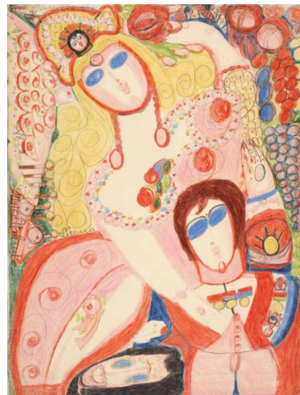
Fig .4 Aloïse Corbaz, Napoléon , 1943.

En este hospital Aloïse realizó 834 dibujos, por medio de esto la artista quiso calmar el tormento por el que estaba pasando, trato de idealizar una realidad llena de color donde crea su propia versión acompañada por un príncipe, castillos y muchas flores.