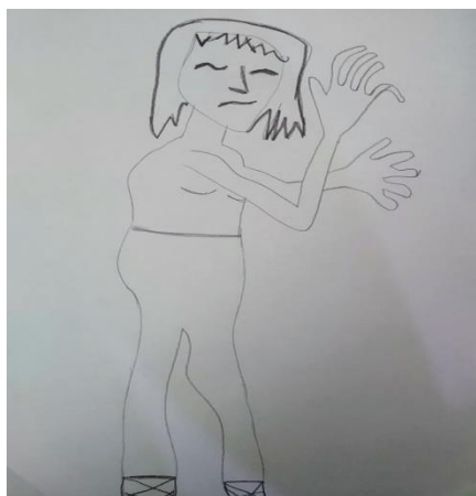
Dibujo elaborado por Susana “mujer paciente” (Nombre ficticio para proteger su identidad)