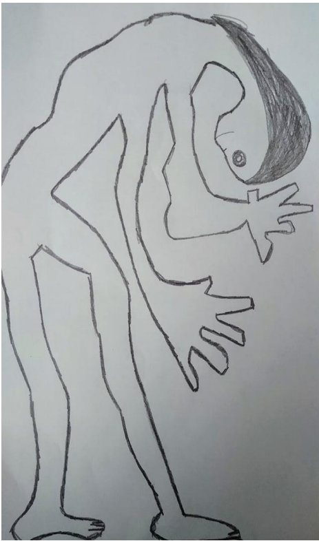
Dibujo elaborado por Ana “mujer paciente” (Nombre ficticio para proteger su identidad)