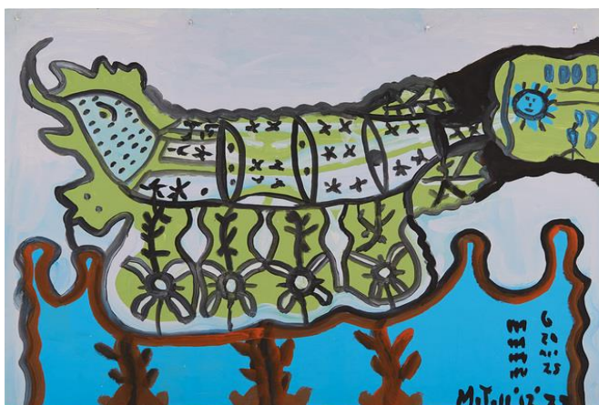
Fig. 3 Tarcisio Merati. Macchinetta trombetta , 1960.

En 1993 se organizó su primera exposición personal en el Teatro Social en Bérgamo Italia, está se repitió en 2006 en una segunda exposición llamada “más allá de la razón” en la misma ciudad pero esta vez se expandió llegando a la región Lombardía, donde dedicó su obra a todos los mayores exponentes del arte marginal.