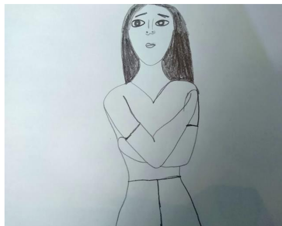
Dibujo elaborado por Carmen “mujer paciente” (Nombre ficticio para proteger su identidad)