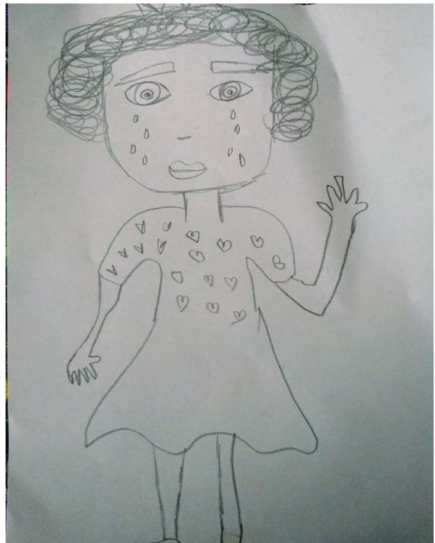
Dibujo elaborado por Alicia “mujer paciente” (Nombre ficticio para proteger su identidad)