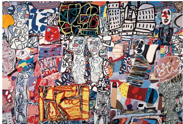
Fig.2 Jean Dubuffet. Mêle moments , 1976.

Se considera a Dubuffet como el representante más importante del Art Brut por el hecho de que gracias a él este tipo de arte tuvo un reconocimiento muy grande, es por ello que decidí tomarlo como mi referente principal, pues más allá de realizar un performance, lo que busco con este proyecto es darle un poco de reconocimiento a las obras realizadas por los pacientes, población estudio de esta investigación, además de que esta línea del arte plástico usualmente no es muy tomada en cuenta, debido a que la mayoría de estos artistas han sido pacientes mentales a los cuales se les ha visto desde ese ojo estigmatizador, el mismo que los aleja y los rechaza.