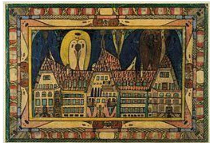
Fig.5 Adolf Wölfli. Clínica Waldau . 1921

Los doctores del sanatorio afirmaron que cuando Adolf dibujaba se mostraba más tranquilo, el médico Walter Morgenthaler lo alentaba a su labor artística, reunió su trabajo y en 1921 lanzó un volumen llamado “ Un paciente psiquiátrico como artista ” este hecho marcó la historia pues fue una de las primeras veces donde se dieron cuenta que el arte podía ser utilizado como terapia. Las obras de Adolf muestran la angustia, inquietud y los traumas infantiles por los cuales paso.