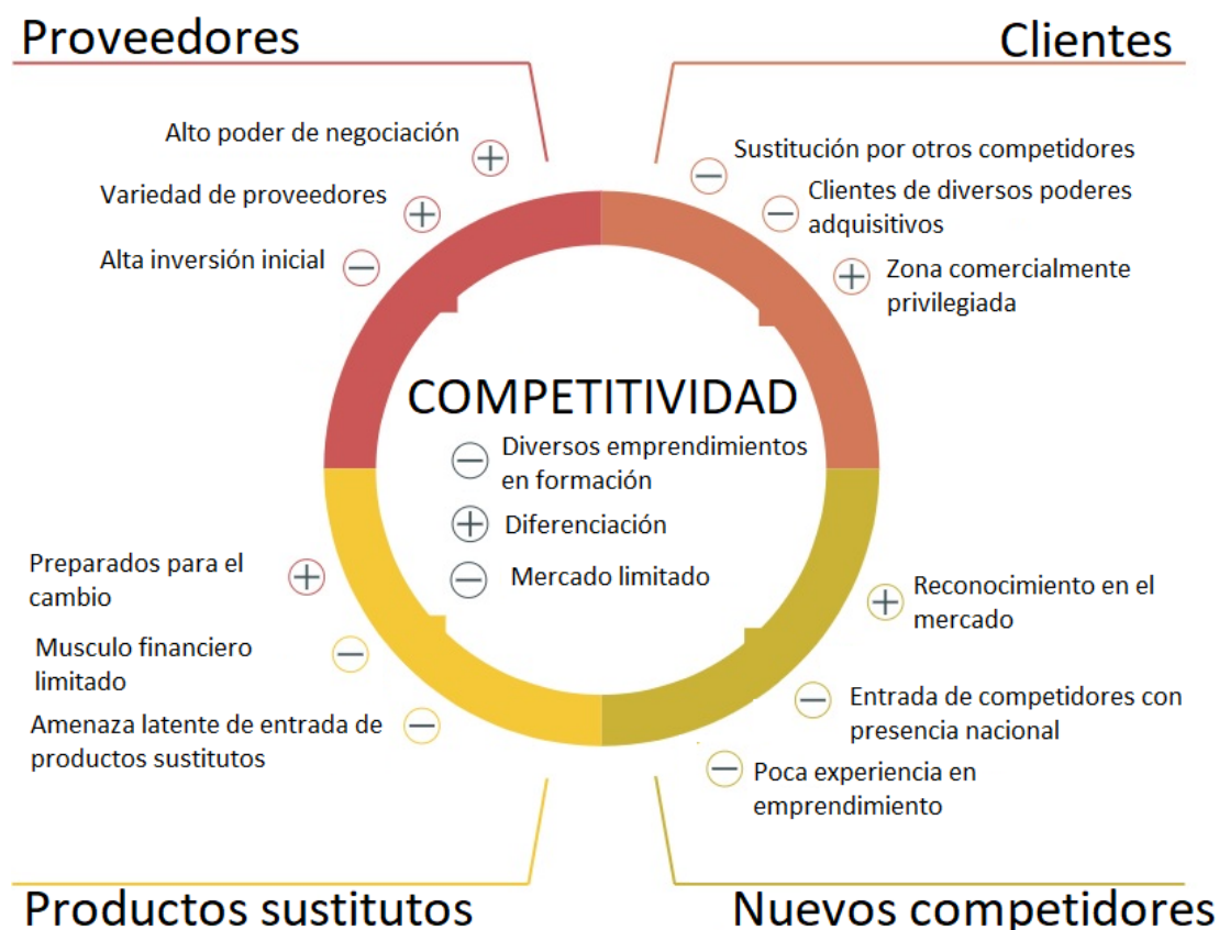
Figura 3 – Matriz de Competitividad de los emprendimientos de Girardot