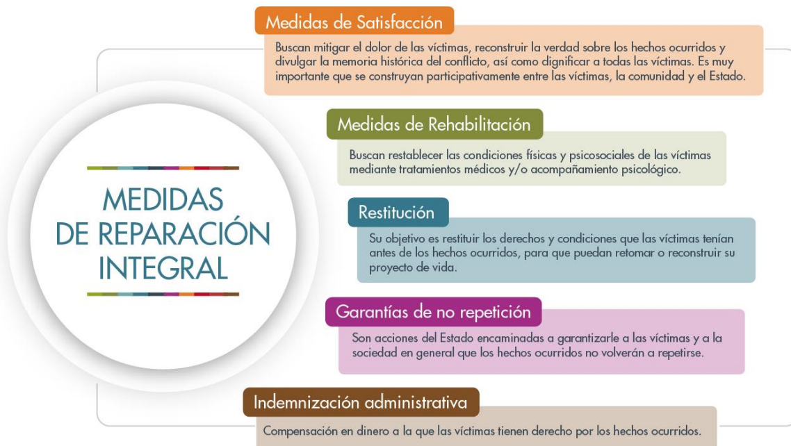
Ilustración 2. Medidas de reparación integral. Unidad para las víctimas.

administrativa. La siguiente imagen, elaborada por la Unidad para las víctimas resume las características de estas medidas: