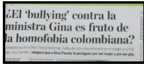
Periódico el País, Pagina 13, 8/8/2016

Otro aspecto relevante encontrado, son las pocas ocasiones sobre la cartilla en mención fue vago, incierto y poco entendible para el lector, pues la polémica se centró en una puja política que dejó más incógnitas que respuestas frente a la realidad y claridad del tema central que, entre otras cosas, el público interesado pedía y era tener claro lo que significaba la expresión ideología de género , idea que hasta la fecha no está despejada y que se consideró pertinente dejar por escrito en esta presentación.