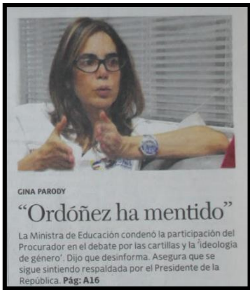
Periódico el País, Portada, 14/8/2016

De igual forma diferentes autores se escudan, en diferentes referentes que apoyan o no la cartilla, ambientes escolares libres de discriminación, haciéndolos participes de sus juicios socioculturales, lo cual exacerba a sus lectores desde su identificación personal y subjetiva con aquellos conocimientos y creencias previas sobre el acontecimiento, limitando así, la posibilidad de crear una postura propia basada en elementos racionales, explicativos y veraces sobre el tema en cuestión.