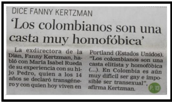
Periódico el Tiempo, Portada, 8/8/2016