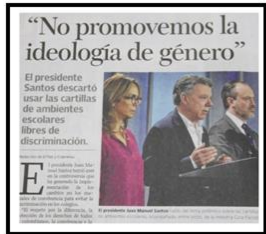
Periódico el País, Página B2, 8/12/2016.

En este mismo sentido, el uso de la negación como forma discursiva se hace muy evidente en diferentes artículos, siendo esta una posición muy arraigada y en la cual