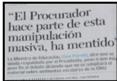
Periódico el País pág, A16, 14/08/16

Además los múltiples señalamientos son notorios en casi todos los artículos, en donde la victimización y los señalamientos, alimentan el show mediático, provocando que las personas se olviden de temas importantes a debatir como la ideología de género que había o no en la cartilla y asistan a un enfrentamiento público entre actores con ideologías y posturas encontradas, irreconciliables.