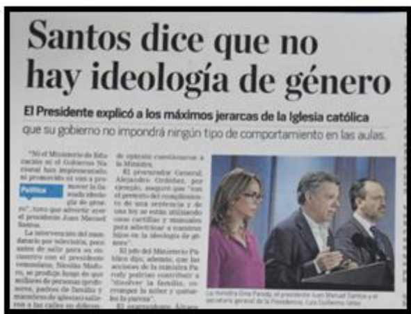
Periódico el Tiempo, Portada, 8/12/2016.

Como se puede observar en las siguientes imágenes tanto del periódico el País como el periódico el Tiempo, en los que aparece el presidente Juan Manuel Santos y Gina Parody, se evidencia como ambos diarios usaban la palabra ideología de género como eje del debate, pero sin explicar dicho concepto, centrando su mirada, y por tanto la del lector en el hecho político.