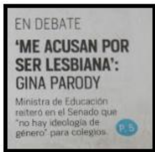
Periódico el Tiempo, Portada, Pág 5, 17/8/2016

La victimización y el dramatismo de los actores o involucrados en el conflicto mediático, es un resultado evidente en esta pesquisa, una vez más se demuestra el desvío del tema o más bien, la disonancia cognitiva que evade el argumento verdadero de ideología de género. Siendo la victimización una de las formas de captar y desviar la atención de la sociedad es utilizada con fines diversos.