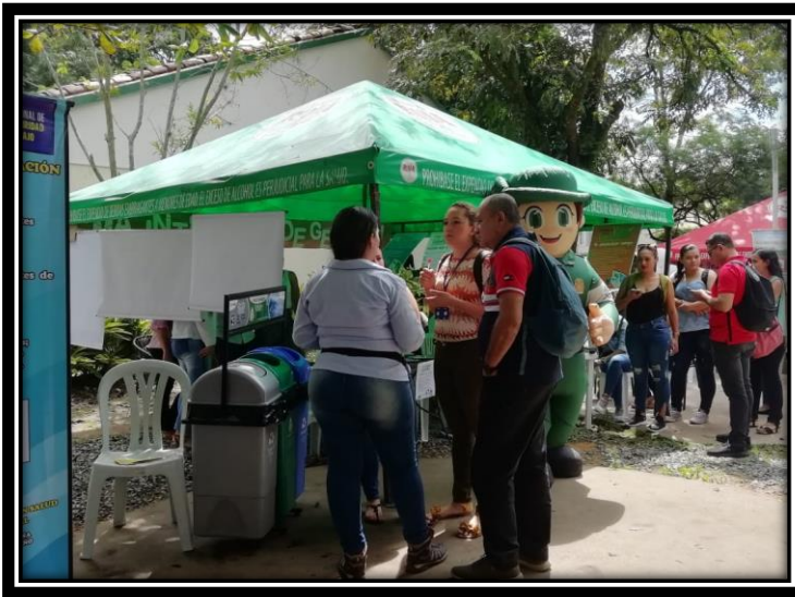
Fotografía 2 Socialización uso de los Puntos ecológicos