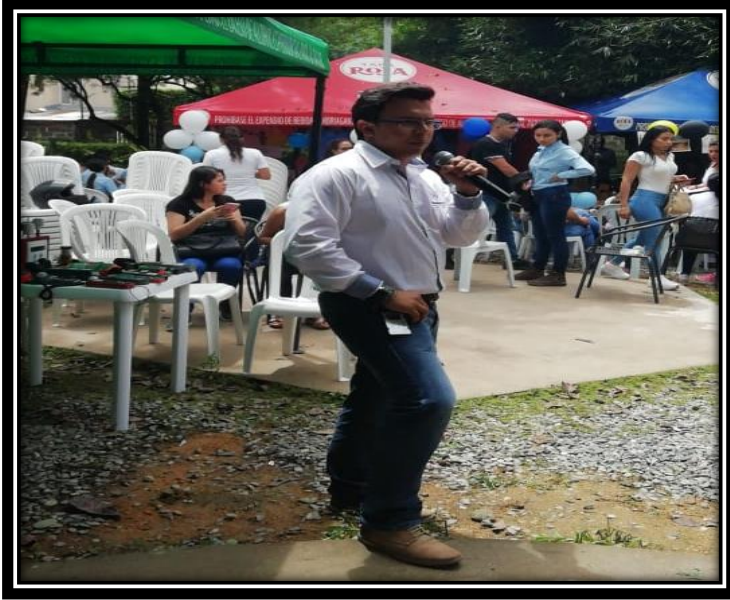
Fotografía 1 Charla de apertura del Stan PIGA