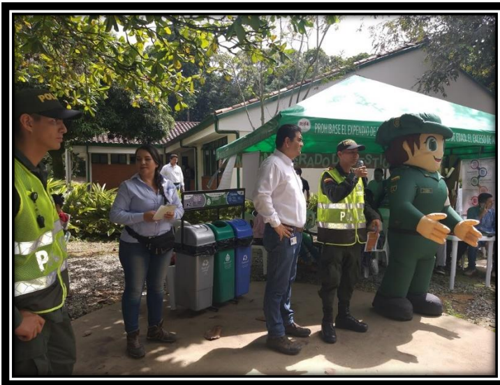
Fotografía 8 Presentación por parte de la Policía Ambiental