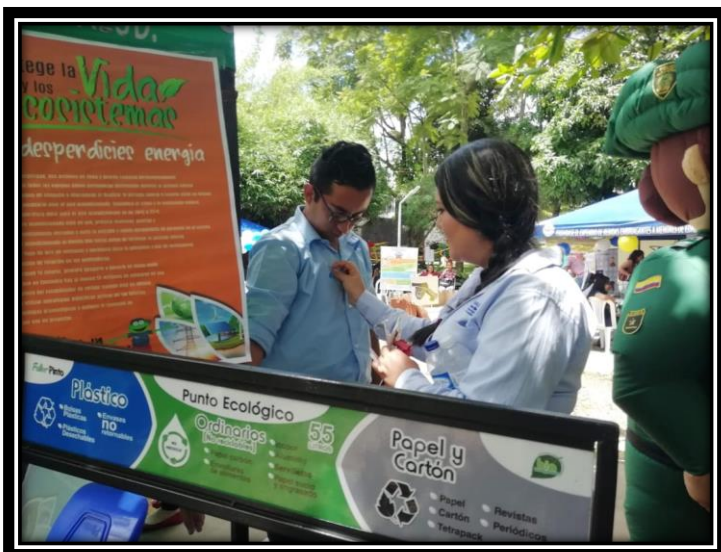
Fotografía 12 Estimulo Uso adecuado Puntos Ecológicos