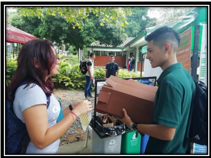
Fotografía 3 Instrucción uso de los puntos ecológicos