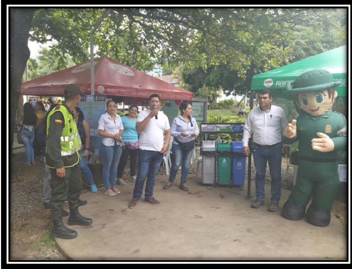
Fotografía 9 Socialización importancia ambiental encargado del SGSST de la METIB