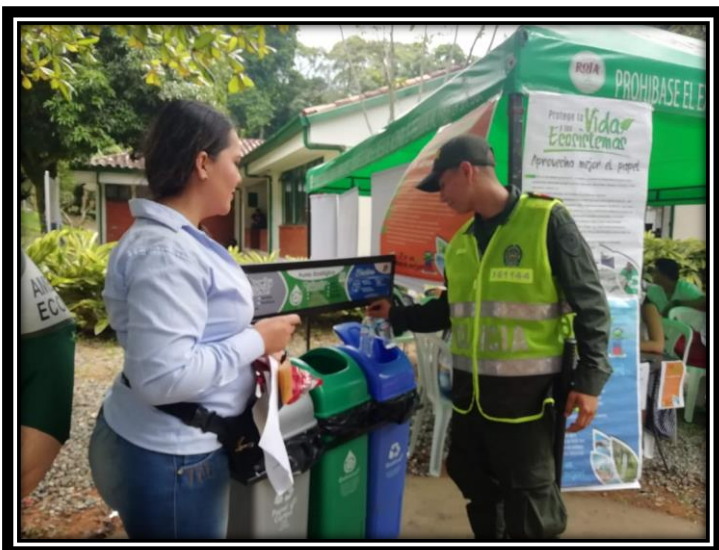
Fotografía 4 Formación uso de los puntos Ecológicos