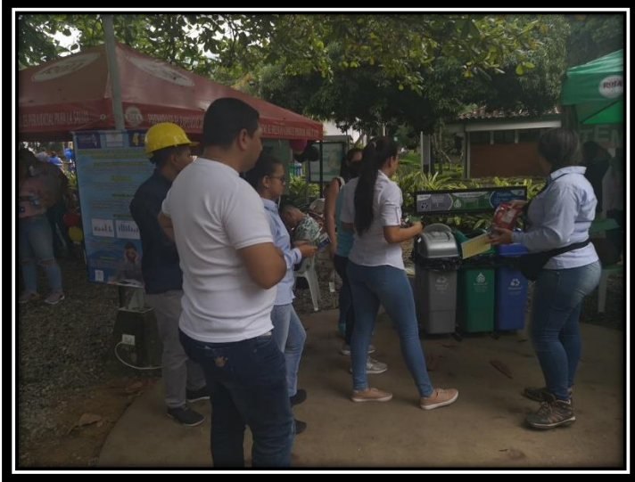
Fotografía 10 Actividad didáctica uso de los puntos ecológicos con estudiantes Uniminuto