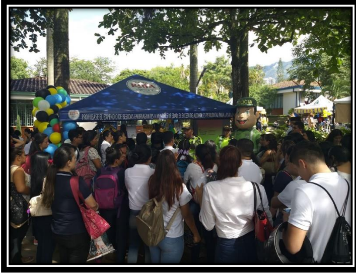
Fotografía 5 Charla educativa por parte de la Policía Ambiental