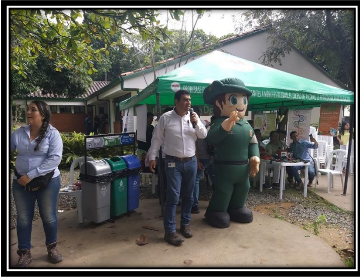
Fotografía 7 Charla por parte del líder del Grupo Ambiental