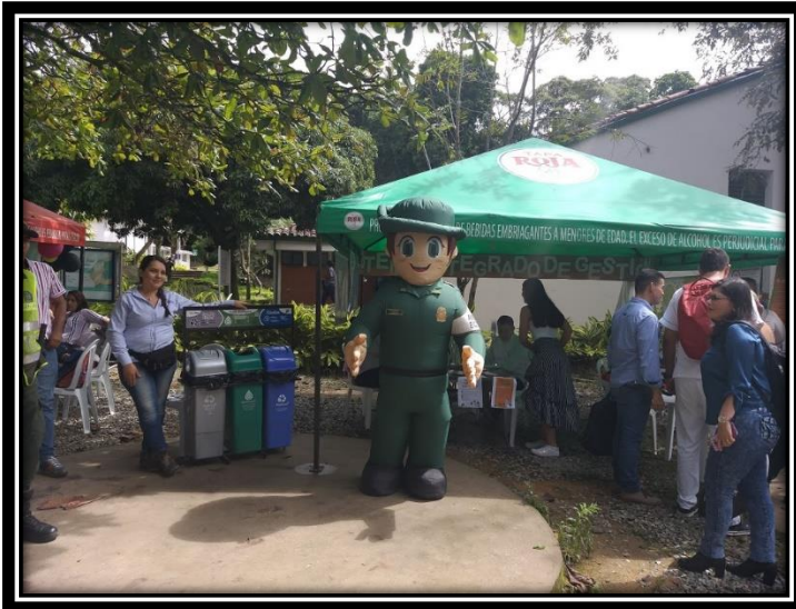
Fotografía 6 Tomada a Dumi ambiental