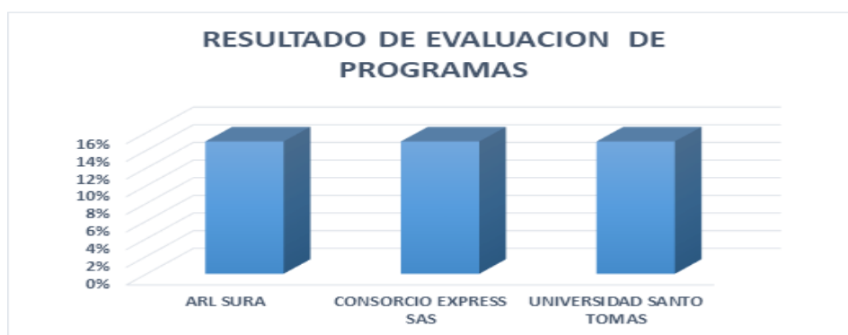
Figura No 5. Resultados de evaluación en la lista de chequeo de los 3 instrumentos evaluados durante la investigación.

evidenciar en la figura No. 5, que del 100% de los indicadores establecidos por esta investigación (Tabla No. 7), solo tienen incorporados el 15% de los 28 indicadores que se obtuvieron como resultado del análisis de contenido (Tabla No. 7). Lo cual no implica que tenga una valoración negativa, sino que las organizaciones consideran que la medición de ausentismo debe responder únicamente a lo dispuesto en la Resolución 0312 de 2019 y no otras causas distintas a las médicas, lo cual no se alcanza a dimensionar las horas laborales perdidas por los trabajadores y las implicaciones que trae consigo el ausentismo para cada una de las organizaciones.